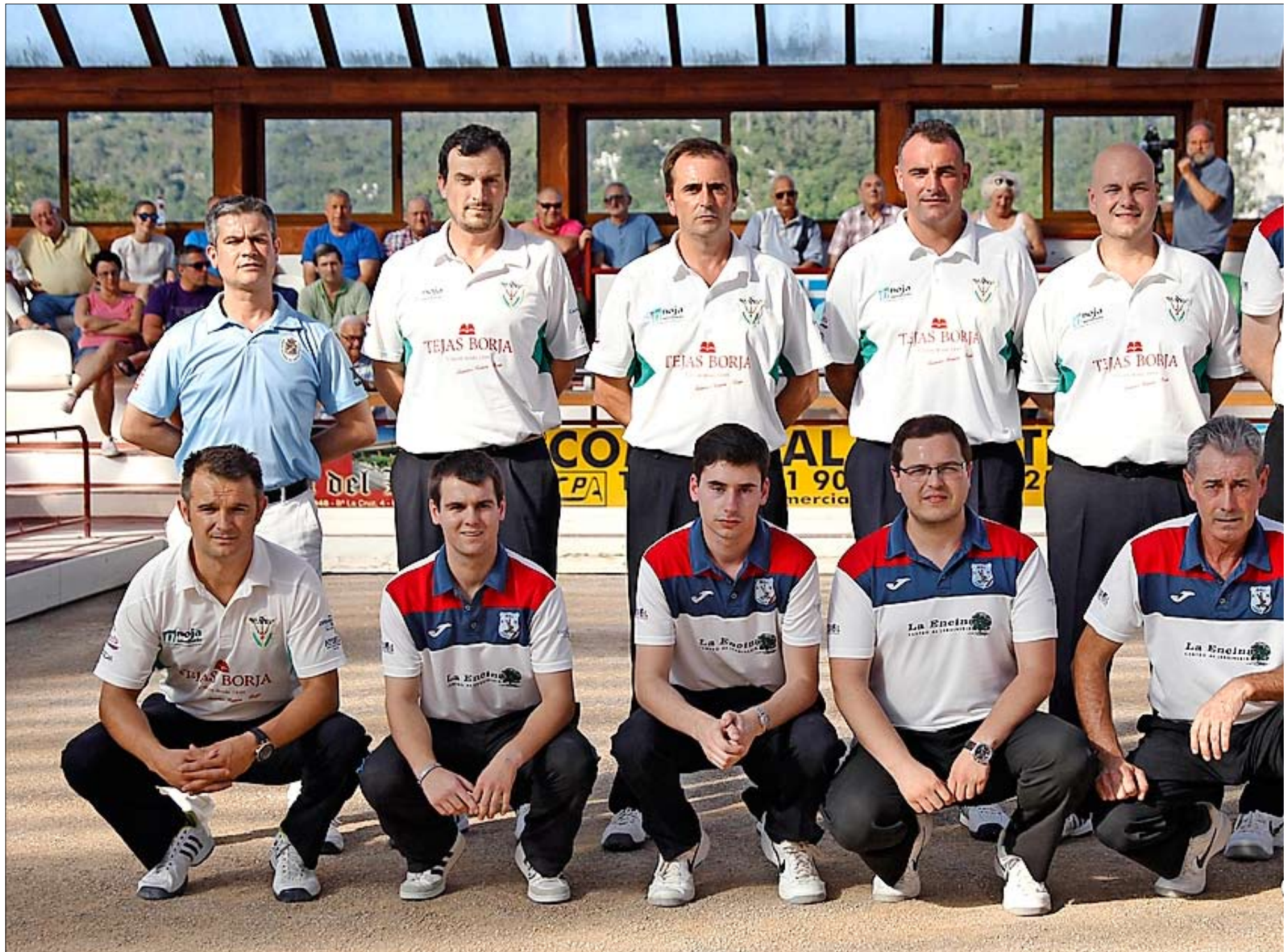
El líder Hermanos Borbolla Villa de Noja y el colista Mali Jardinería La Encina se vieron ayer las caras en la bolera La Anunciación de Arce.