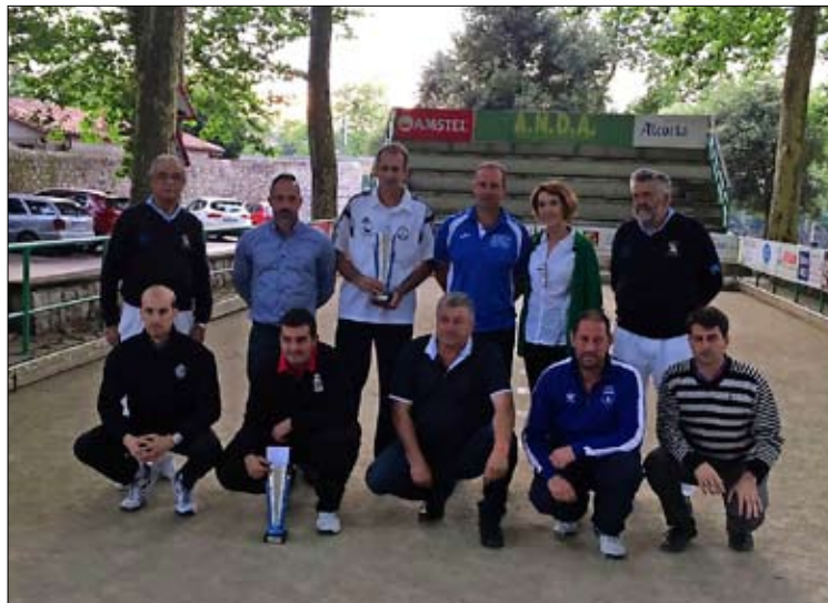
Finalistas, organizadores y patrocinadores del Concurso Ayto. de Piélagos.