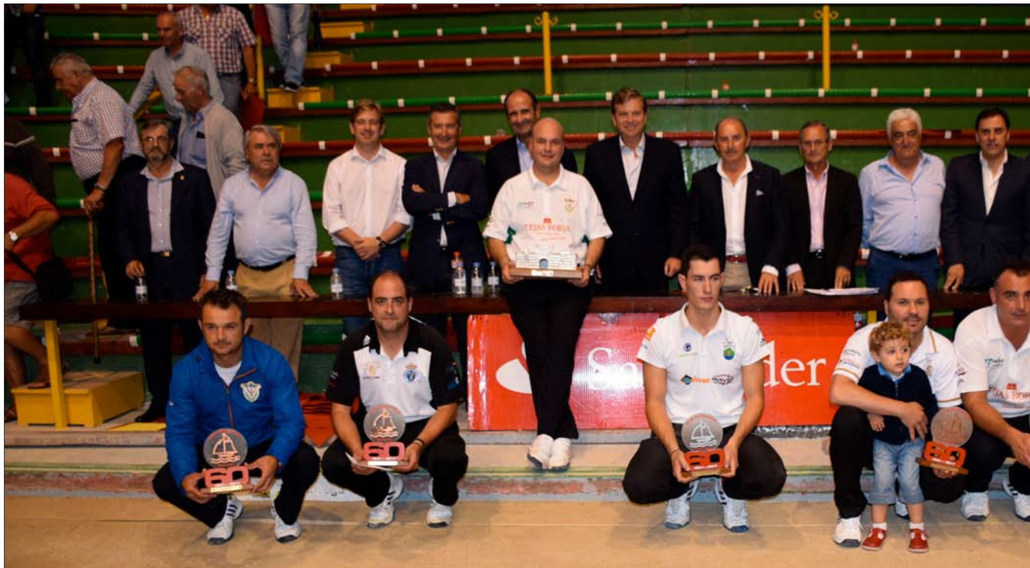
Autoridades y jugadores tras la entrega de premios en la bolera Severino Prieto de Torrelavega.