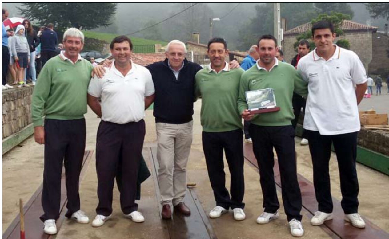
La Peña Margutsa de Resconorio logró su undécimo título, todos consecutivos, de campeón de la Liga de Primera categoría de bolo pasiego.