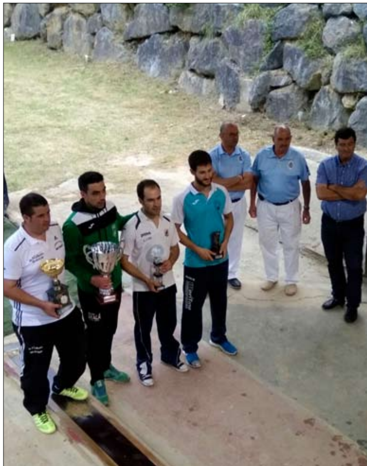
Podio del Regional de Primera categoría.

El sábado 29 a las 17 horas serán las finales del Trofeo Villa de Laredo para categorías menores: