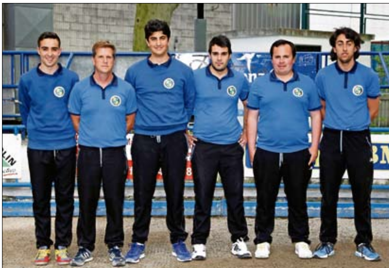
Peña Rosequillo de La Concha de Villaescusa de Segunda.