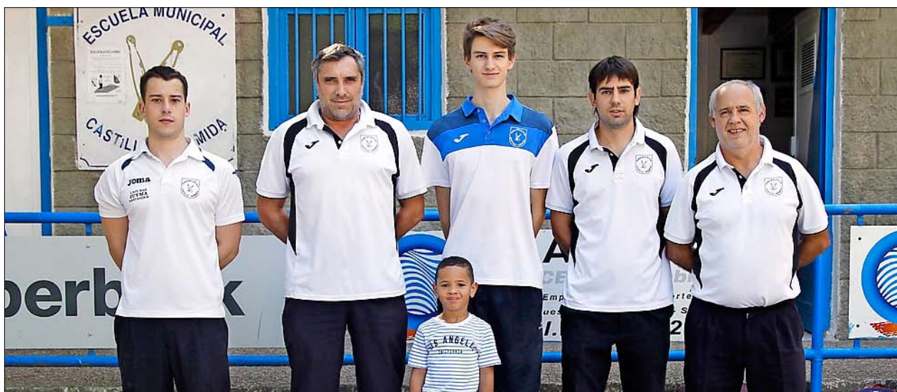
Integrantes del Castilla Hermida de Segunda. / JOSÉ RAMÓN