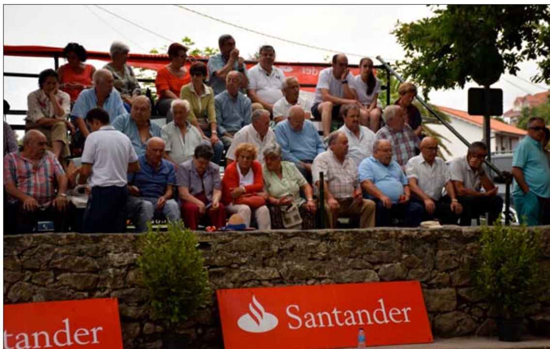
Numeroso público se dio cita en La Robleda de Puente San Miguel desde primera hora.

GRAN PREMIO ESTRUCTURAS ROTEDAMA. Los días 24, 25 y 26, desde las 16.00 horas, se realizarán las tiradas de clasificación para el Gran Premio Estructuras Rotedama para benjamines y alevines, que organiza la Peña Sobarzo. Las finales están previstas para los días 9 y 10 de agosto. Teléfono de contacto: 678 90 93 41.