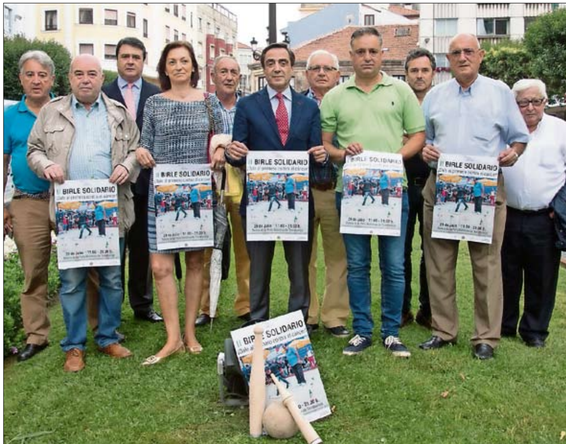
Presentación del Birle Solidario. / ALERTA

Las bases del Birle Solidario establecen dos categorías; una para jugadores federados y otra para no federados. Los cinco primeros clasificados de cada categoría por número de bolos derribados recibirán los premios asignados en las bases, así como los dos antepenúltimos de la clasificación y el 7º de entre los socios de Amigos de Torrelavega, que tendrán sus respectivos premios de consolación. En caso de empate, un sorteo entre los igualados decidirá la asignación de premios. El resto