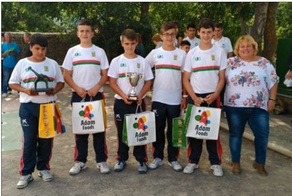
EB Torrelavega, campeona de la Liga infantil.