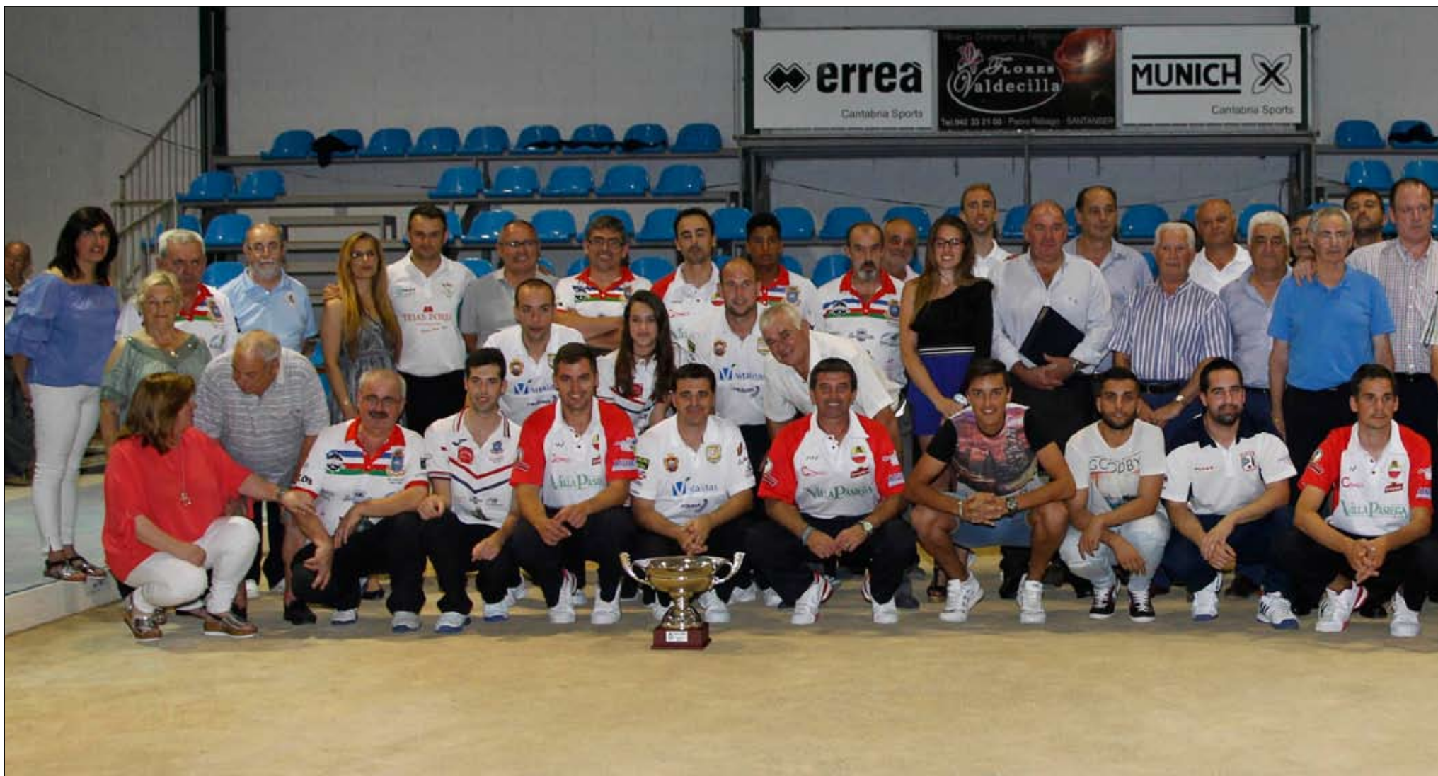
Foto de familia con autoridades, jugadores, invitados y organizadores.