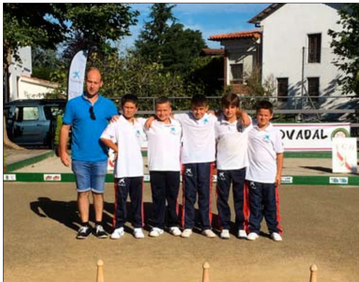
EB Peñacastillo, campeón alevín-benjamín. / DAVID

REGIONAL ALEVÍN, APLAZADO AL 12 DE AGOSTO. La lluvia impidió ayer la celebración del Campeonato Regional alevín, previsto en la bolera Ramiro González de Casar de Periedo, organizado por la Peña Delicatessen La Ermita Casar de Periedo. La competición, con la misma programación y horario, se ha trasladado al sábado, 12 de agosto.