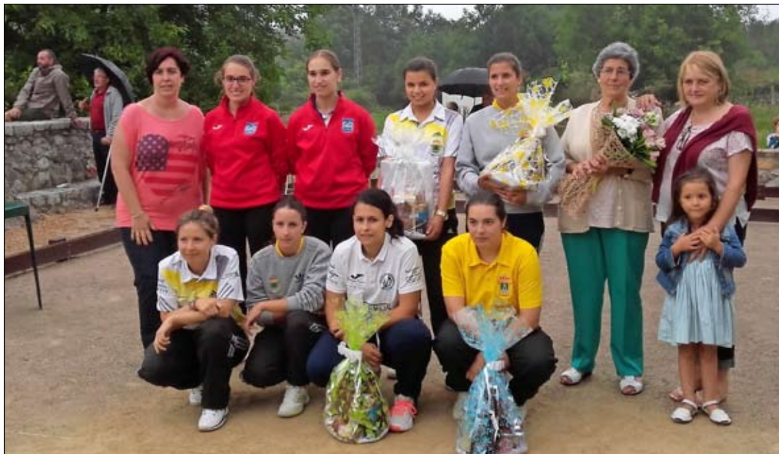
Jugadoras y organizadoras tras la entrega de premios en la bolera de Santa Marina.