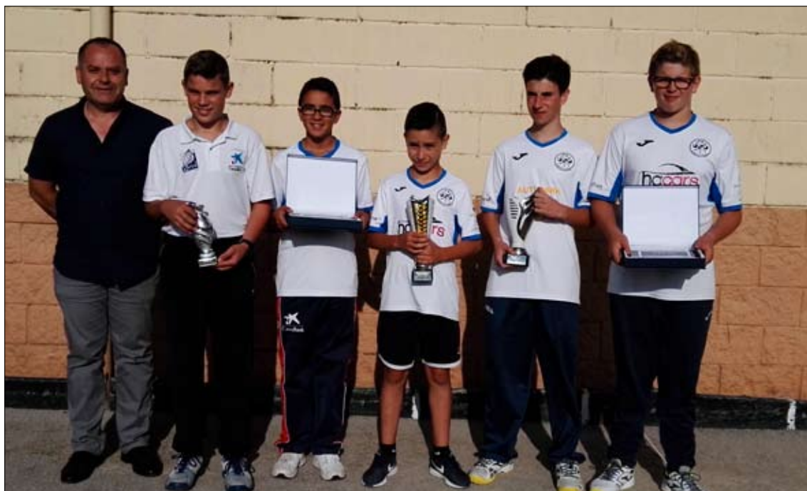
Infantiles finalistas en el Memorial María del Carmen Galán Posadas.

con 113, son los jugadores clasificados para la fase final del VIII Concurso Comercial Anievas de juveniles, que organiza la Peña Peñacastillo Anievas Mayba y cuya final tendrá lugar hoy en la bolera Mateo Grijuela.