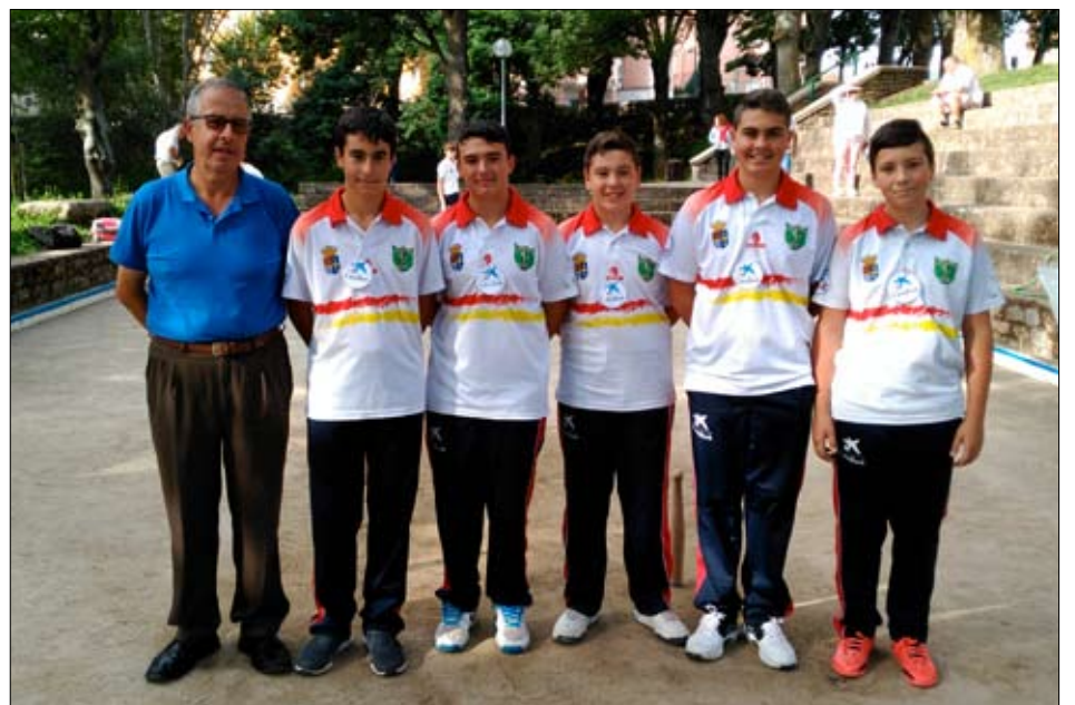
EB Sobarzo. / DAVID