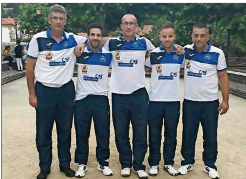
Peña Delicatessen La Ermita Casar de Periedo de Primera.