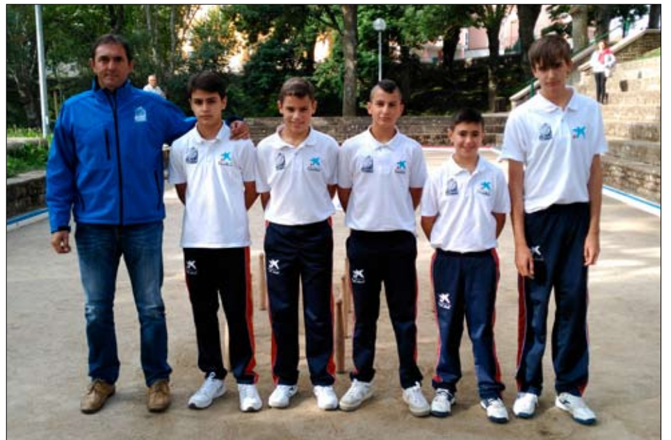
EB Borsal Textil (Cabezón de la Sal), subcampeona.