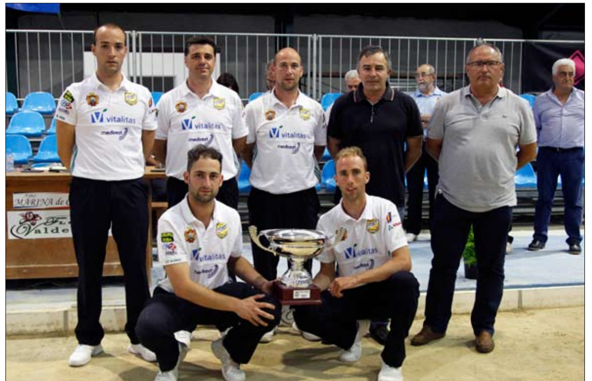
Peña Los Remedios Vitalitas, ganadora del Trofeo El Carmen. / JOSÉ RAMÓN