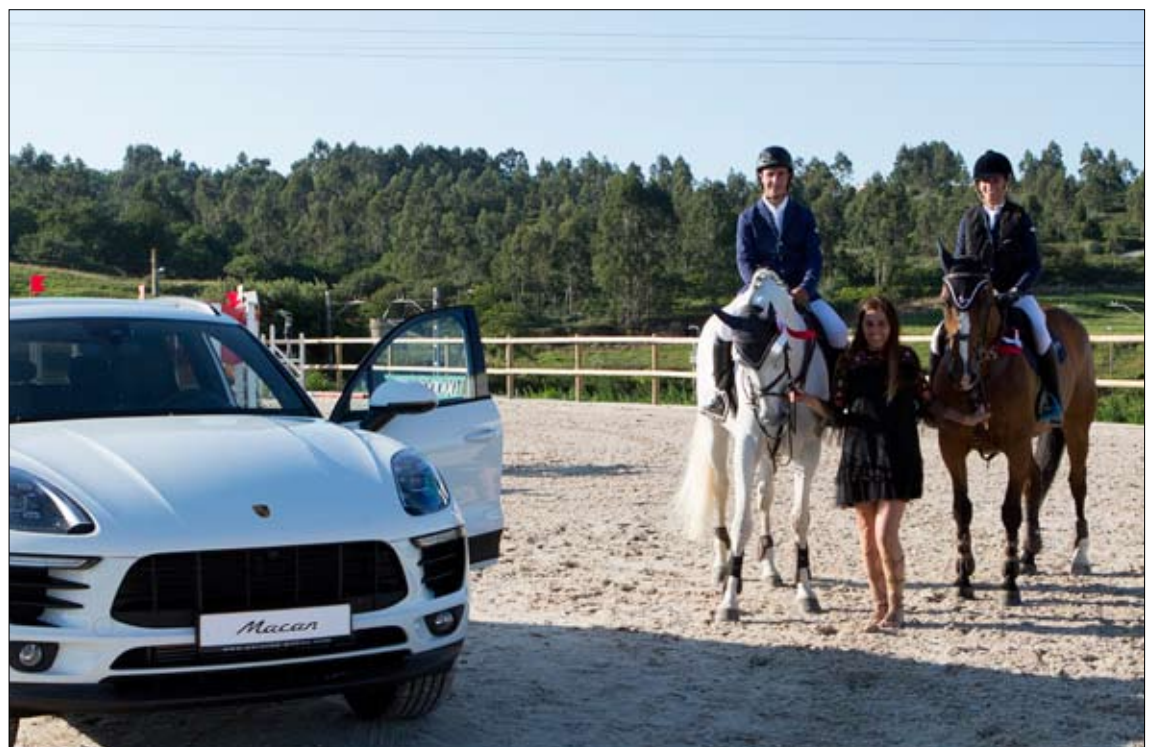
Foto de los vencedores del concurso hípico.

La temporada nacional de salto en Cantabria continuará el 28,29 y 30 de julio en Isla.