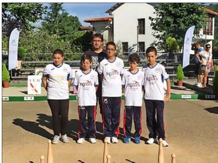
EB Casar de Periedo. / DAVID