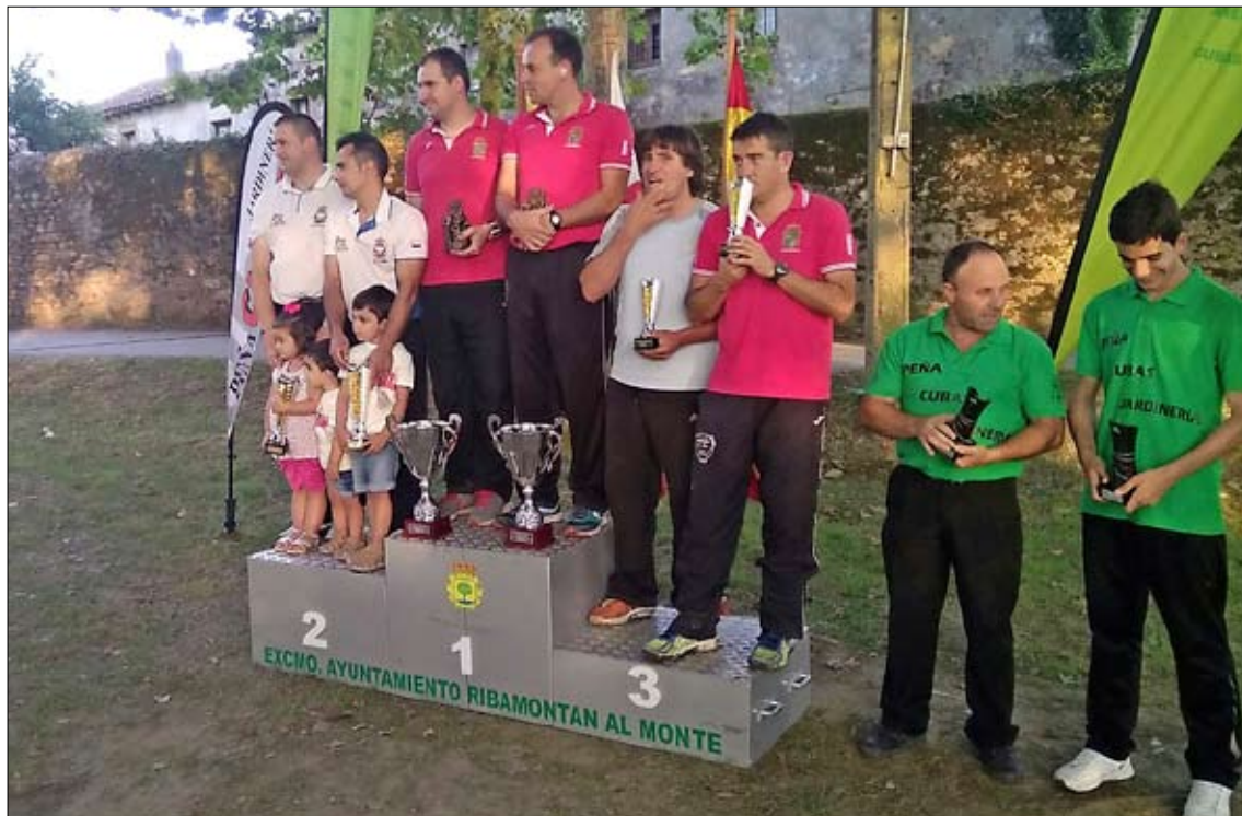
Podio del Regional de parejas de pasabolo losa.