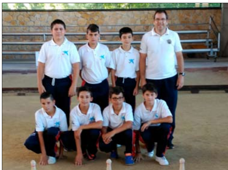
EB Castilla-Hermida de Santander.