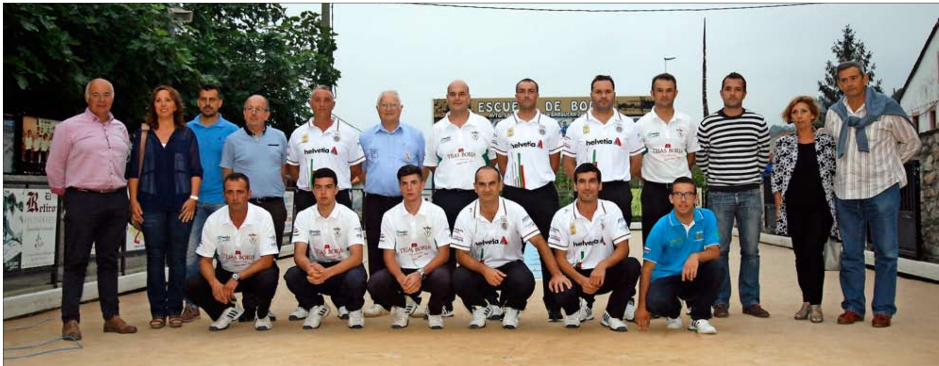
Las formaciones de Hermanos Borbolla Villa de Noja y Casa Sampedro, junto a las autoridades y organizadores.