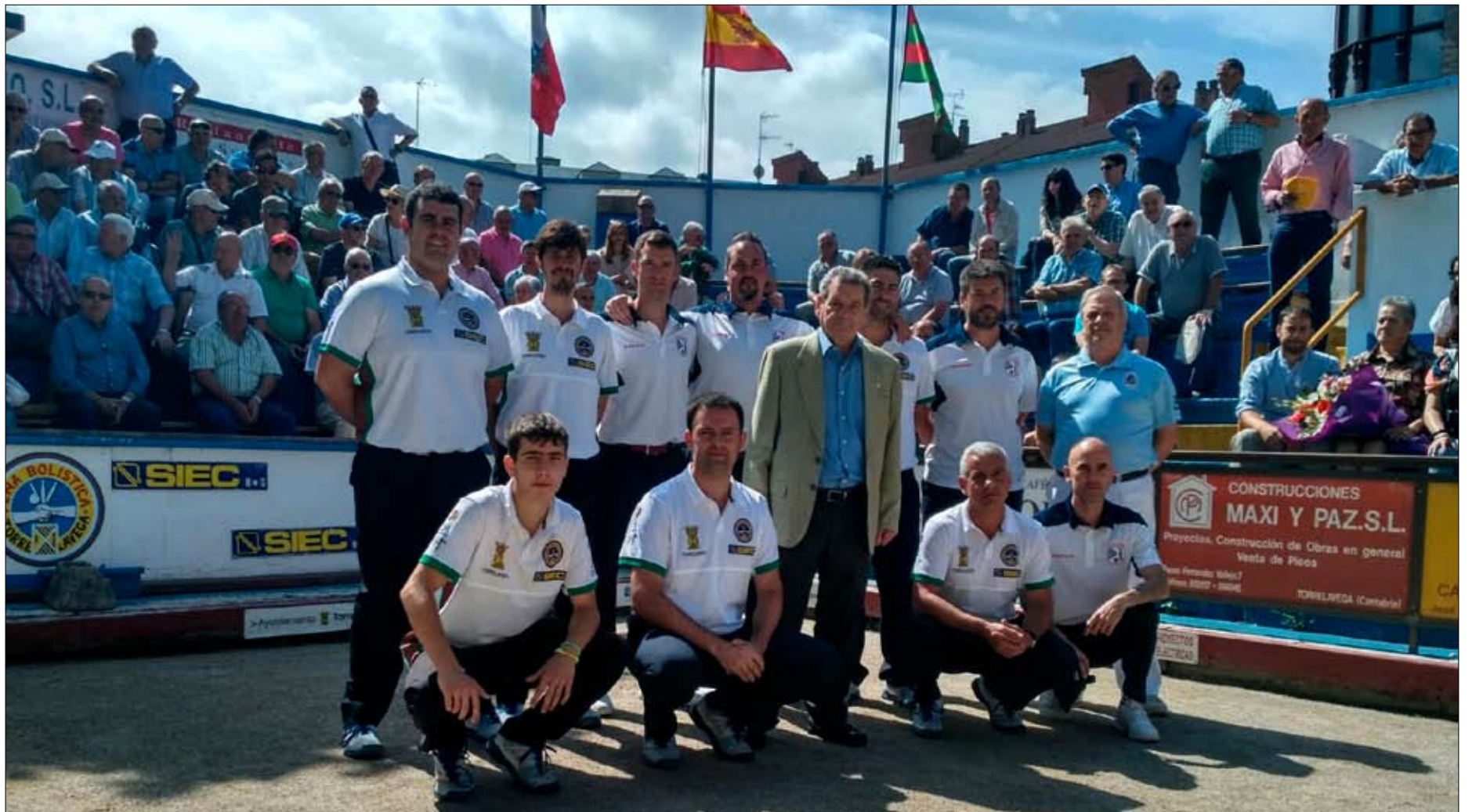
El homenajeado posa con los componentes de los equipos de las peñas Torrelavega Siec y Puertas Roper, que ayer por mañana jugaron en la Carmelo Sierra.