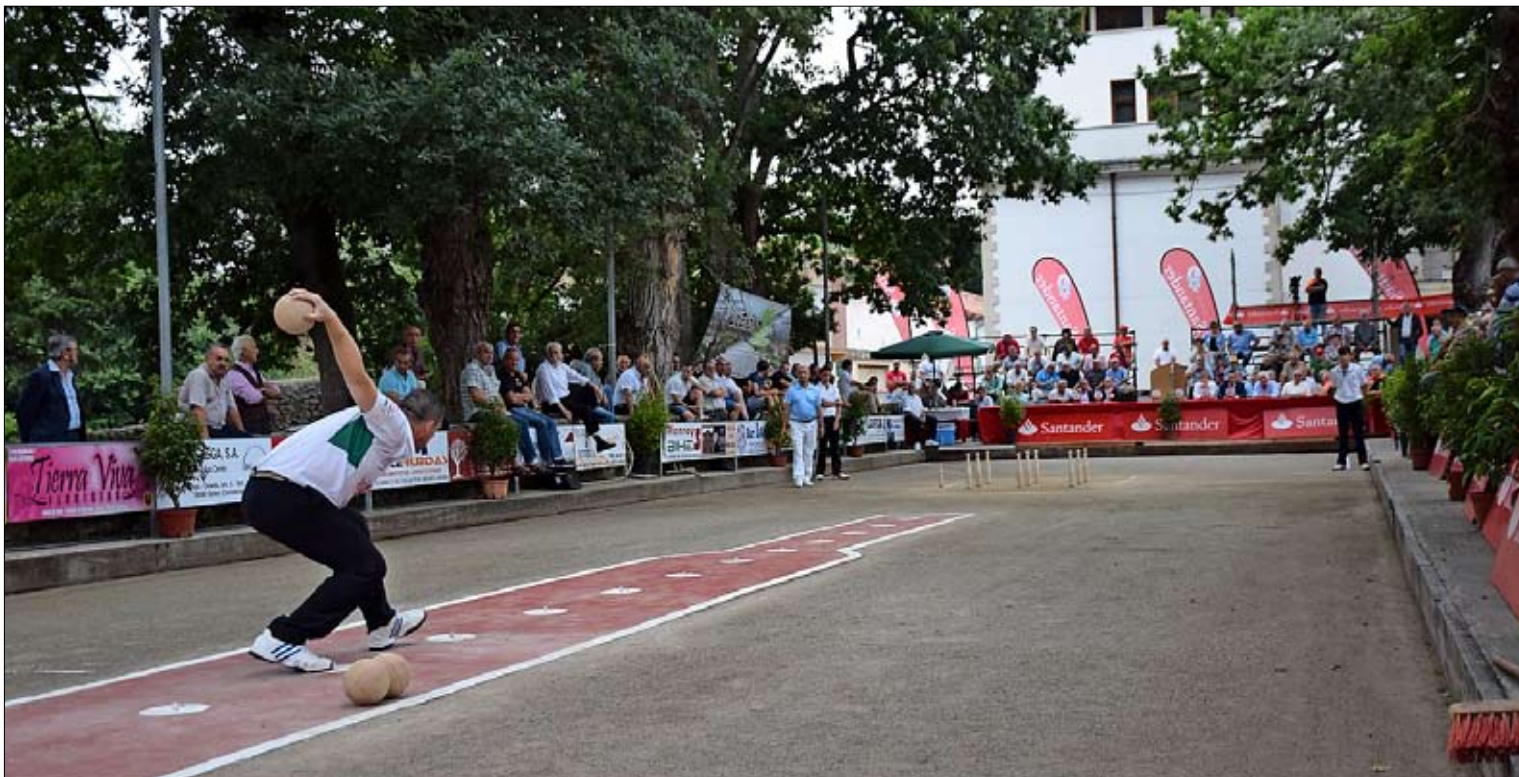
La bolera La Robleda de Puente San Miguel vuelve a vestirse de gala para acoger a los ases.