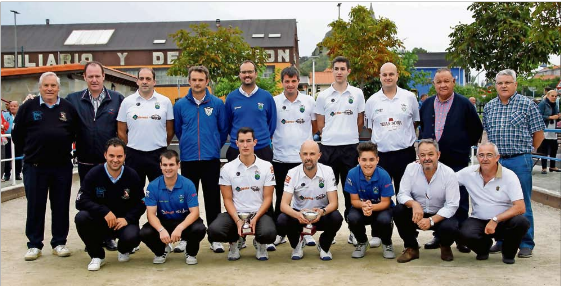
Jugadores, organizadores, árbitros y armadores tras la entrega de premios.