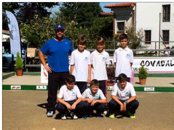
EB La Rasilla de Los Corrales de Buelna. / DAVID