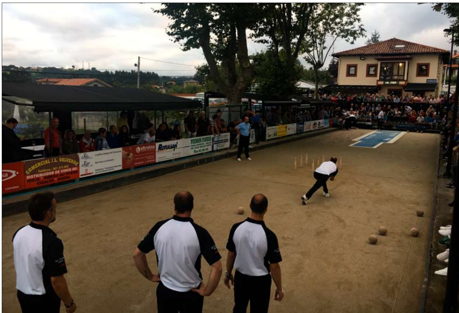
En Cerrazo, J. Cuesta dio la sorpresa al eliminar a Hermanos Borbolla de la Copa Cantabria.