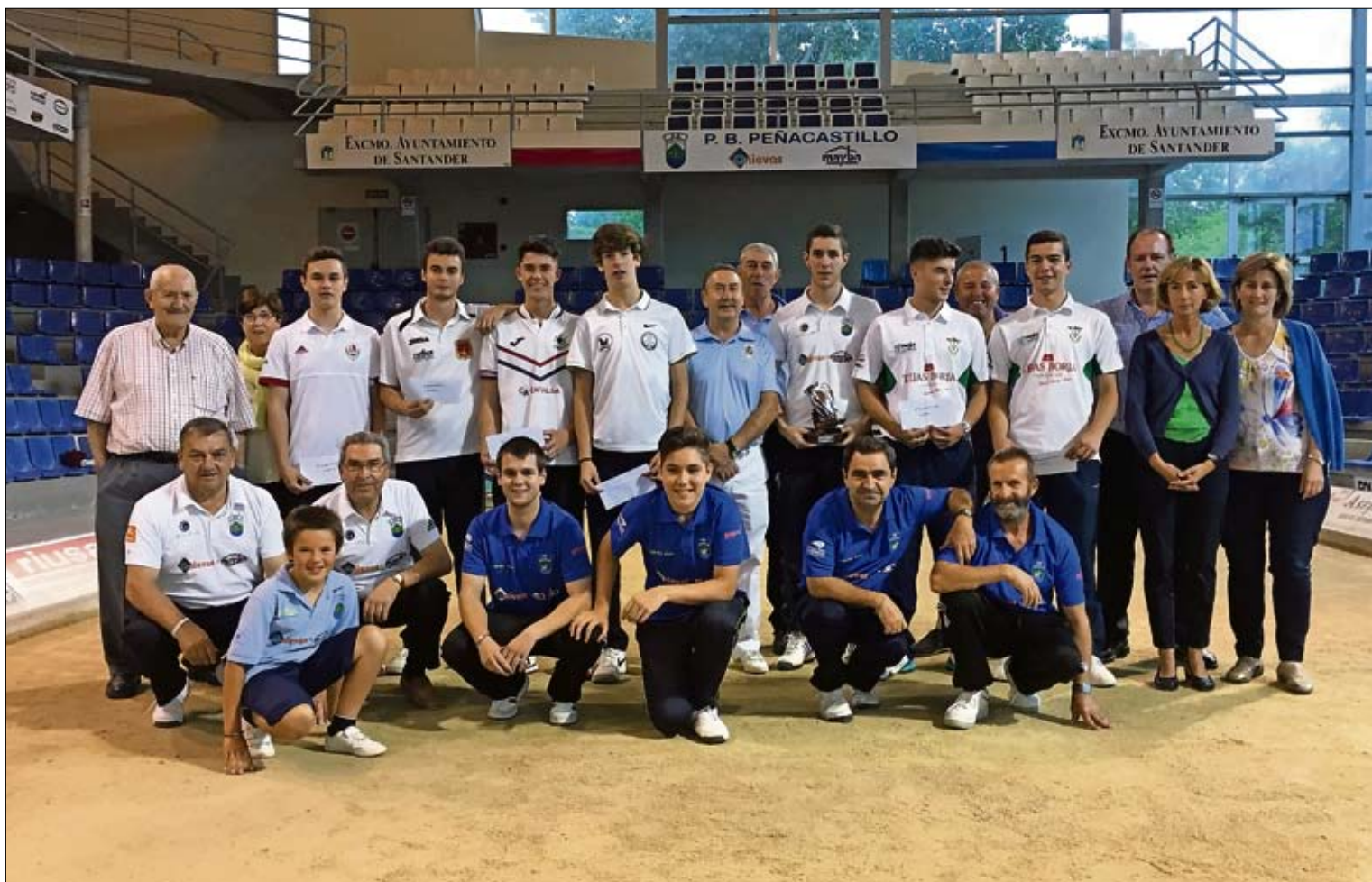
Participantes en el VIII Concurso Comercial Anievas.