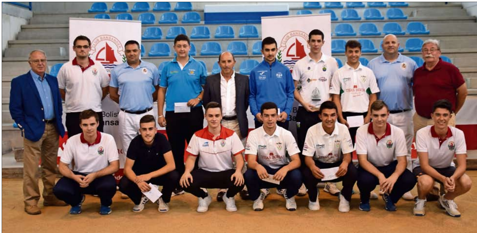
Foto de familia con los participantes, autoridades, organizadores y árbitros. / ADRIÁN