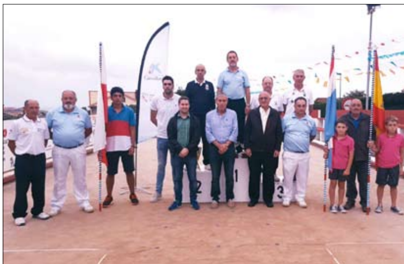
Podio del Campeonato Regional de veteranos, celebrado en Tagle.

Jardinería La Encina y Comercial Santiago Ferma-cell en las dos próximas jornadas.