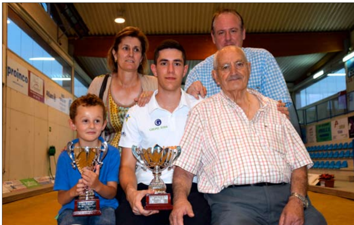
El flamante campeón, rodeado de su familia.

El campeón concluyó el torneo con 663 bolos, con parciales de 131, 132, 139, 130 y 131, con una