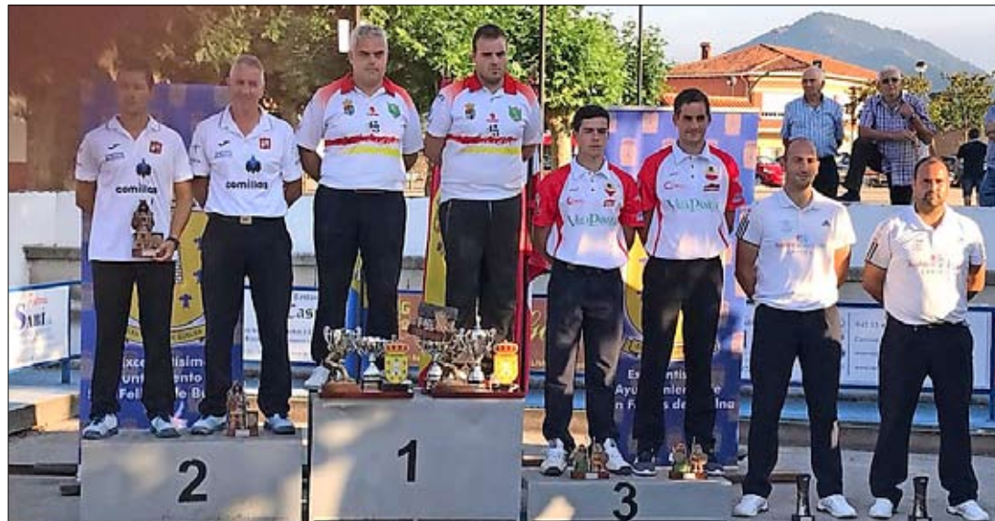
Podio del Regional de peñas por parejas de Segunda.