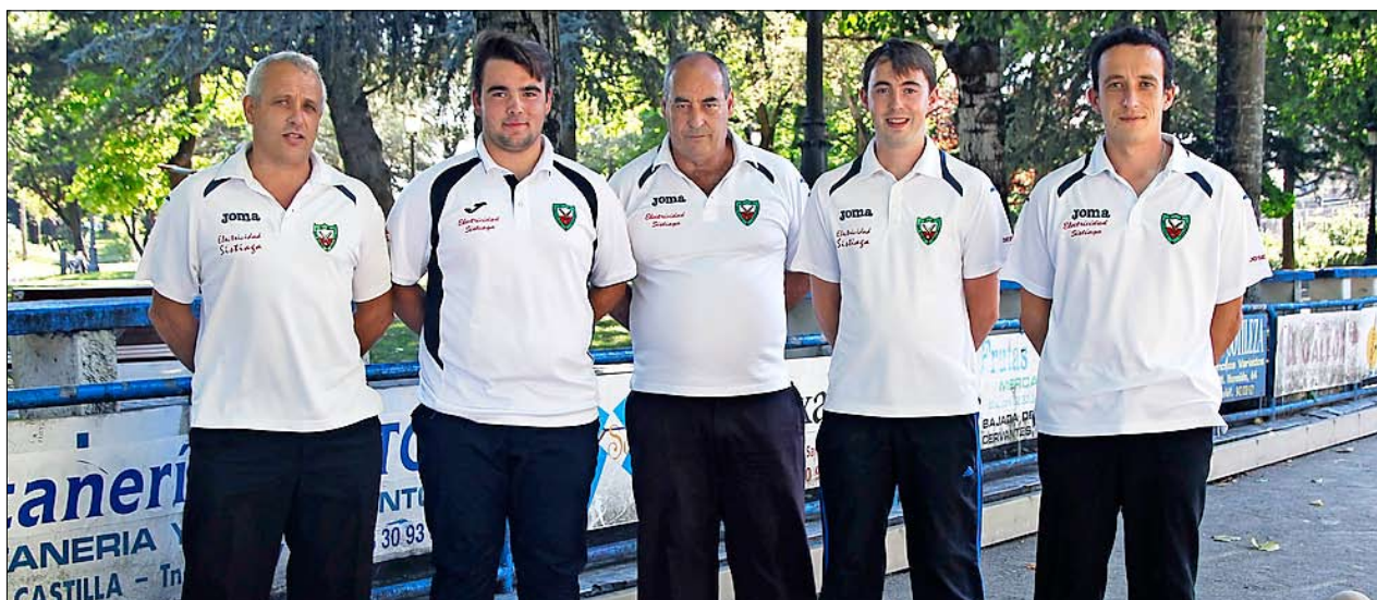
Integrantes del San Mamés de Segunda. / JOSÉ RAMÓN