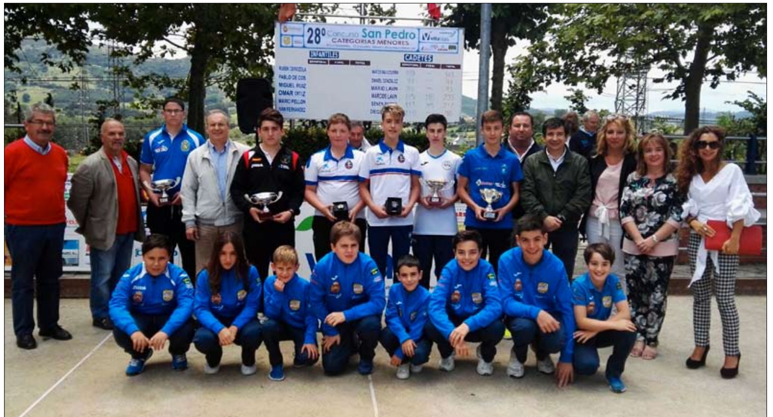
Cadetes finalistas del Concurso San Pedro, disputado en Muslera.

En cuanto al sorteo de los dos juegos de bolas, los participantes