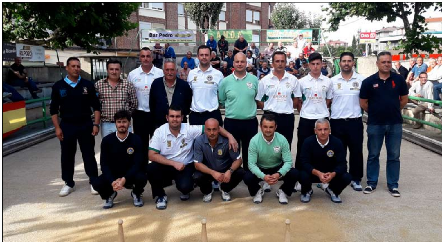
Las Peñas Hermanos Borbolla Villa de Noja y Torrelavega Siec disputaron un partido amistoso en Nueva Ciudad con motivo de las fiestas del populoso barrio de la capital del Besaya. Buen ambiente y resultado favorable a los nojeños por 2-4.

Los premios serán: 1º 200 euros; 2º 150 euros; 3º y 4º 75 euros, cada uno; y del 5º al 8º 35 euros, cada uno. Además los cuatro primeros recibirán trofeos.