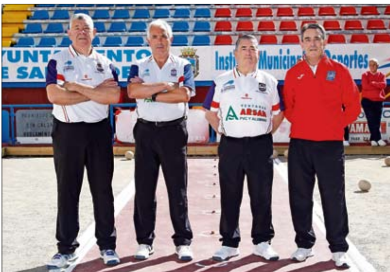
Peña La Carmencita de veteranos. / JOSÉ RAMÓN

un entrañable salto de más de cincuenta años, hacia atrás, naturalmente. Viene a mi memoria la colección de cromos de las chocolatinas de Nestlé, 'Las maravillas del mundo', una ventana abierta a tantas cosas desconocidas en aquella época en la que apenas había algo que leer, salvo las sobadas y recambiadas novelas de Marcial Lafuente Estefanía, cuando no otras más rosas de Corin Tellado. Era lo que había, y poco, y a la mayoría de los amigos y amigas lectores os sonará a prehistoria pero fue casi ayer. También me viene el recuerdo del pegado, elaborando primero el pegamento, el engrudo elaborado con harina y agua, o el cambio de los cromos repetidos. Le tengo, le tengo, no le tengo... Quería haber escrito de otro cambio de cromos, en sentido figurado, como es el tema de los fichajes para la próxima temporada, pero tendremos más espacio otro día y el tema, ni tiene pinta de enfriar, ni mis males tienen ya remedio.