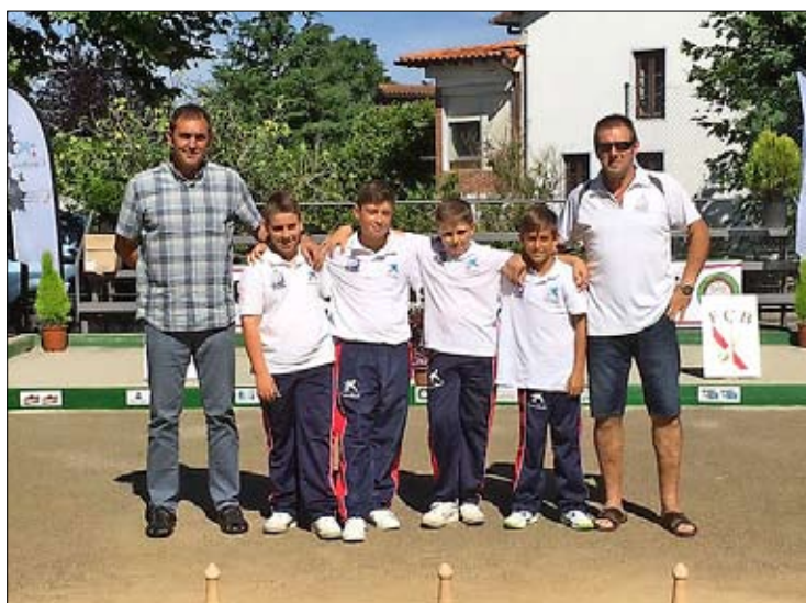
EB Borsal Textil de Cabezón de la Sal. / DAVID