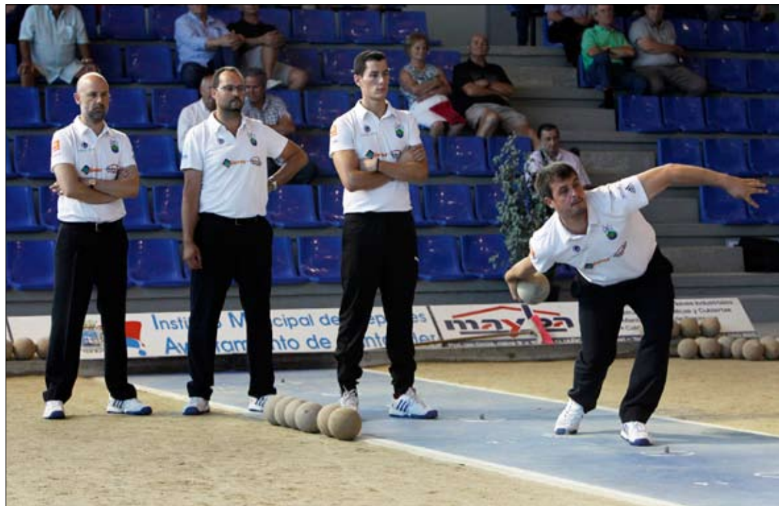
Los jugadores de Peñacastillo en el tiro.