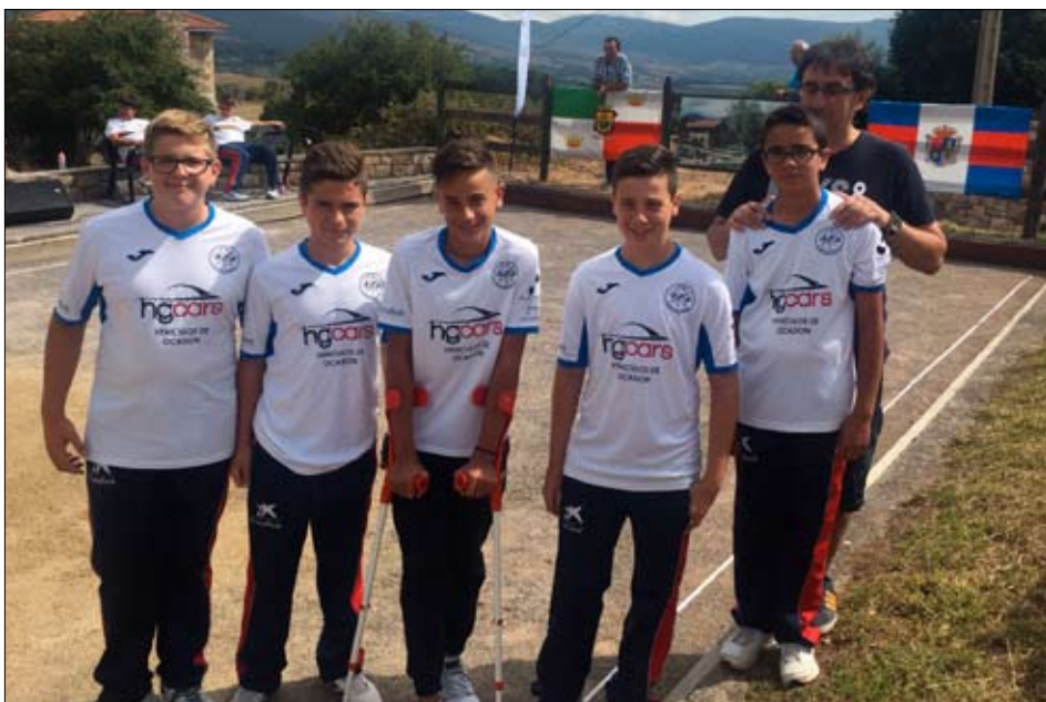
EB Casar de Periedo.