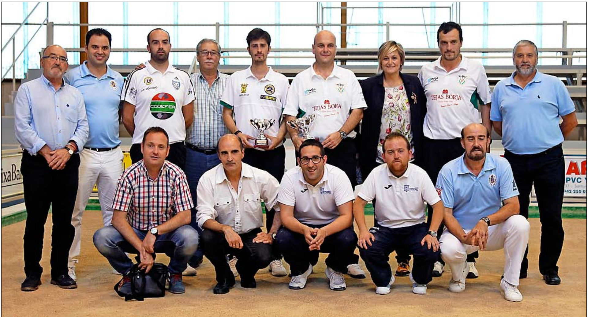
Los cuatro primeros clasificados en el Concurso El Carmen, junto a las autoridades, organizadores, armadores y árbitros. / JOSÉ RAMÓN