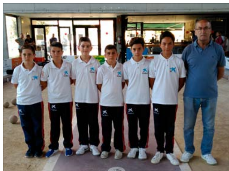
EB Piélagos. / DAVID