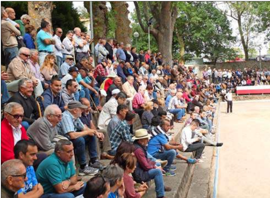
El público acudió en buen número ayer a Las Fuentes.