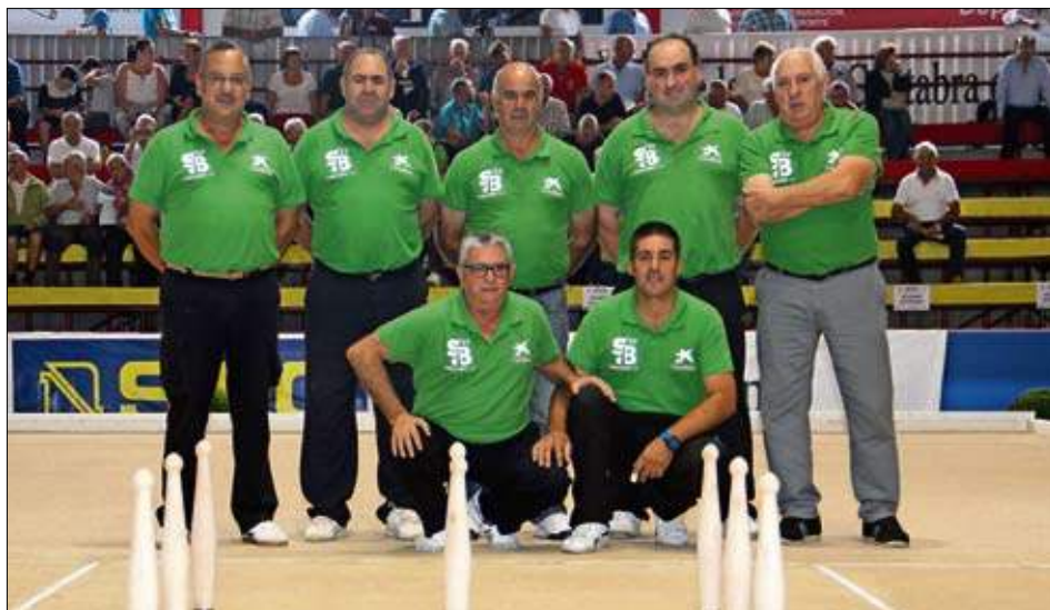
Técnicos de bolera de la Semana Bolística.