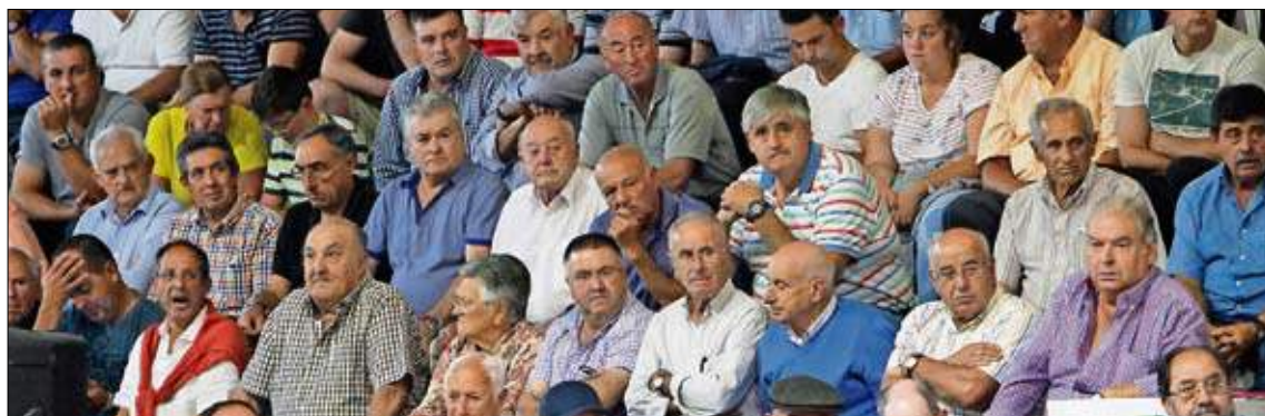
El público llenó las gradas del Pabellón Valdáliga de Treceño. / JOSÉ RAMÓN ▼