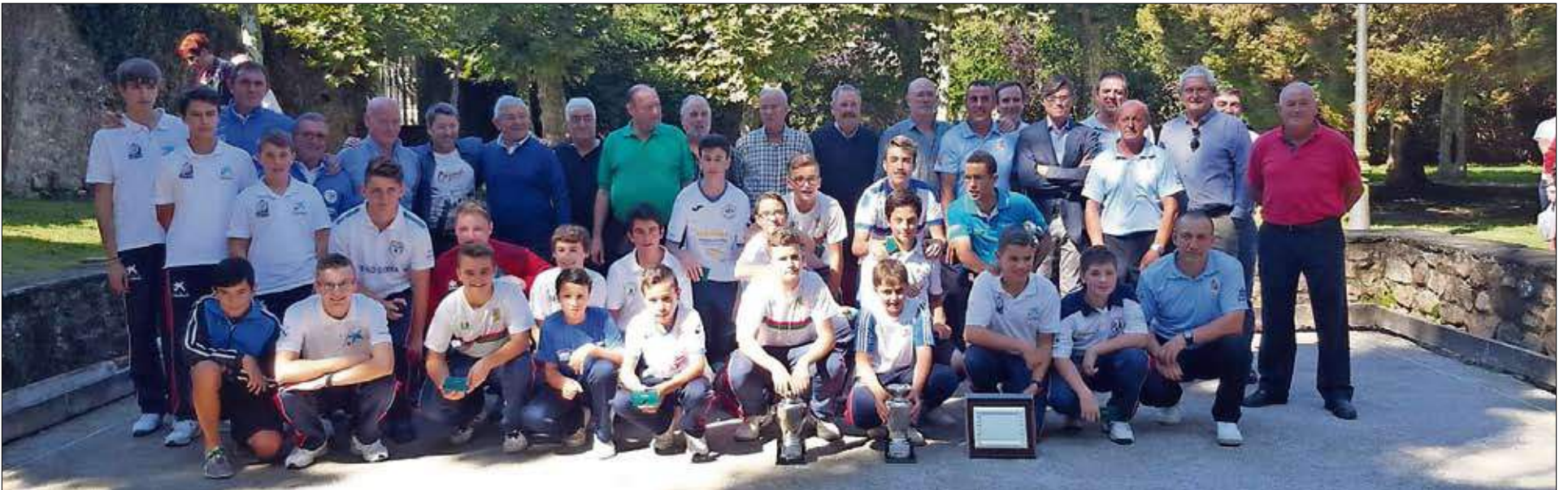
Participantes, autoridades, organizadores y árbitros tras la entrega de premios. / DARIÓ