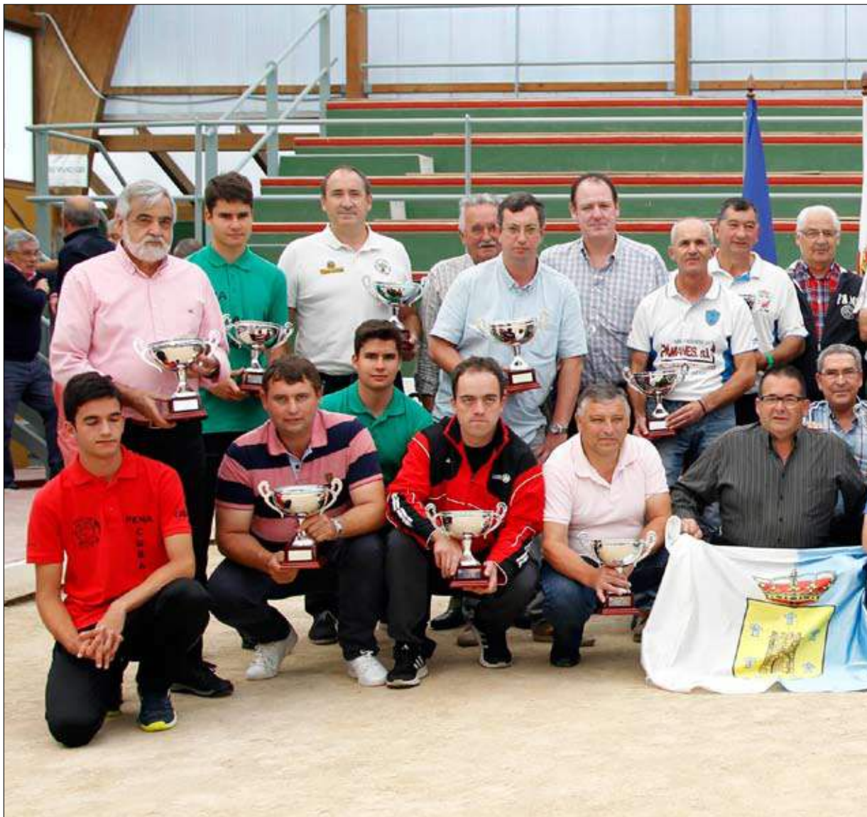
Los representantes de las peñas campeonas de Liga con sus respectivos trofeos.