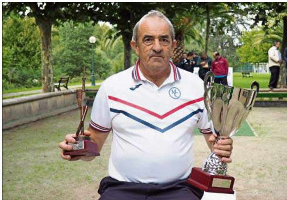
El campeón posa con los trofeos conquistados en Campuzano.