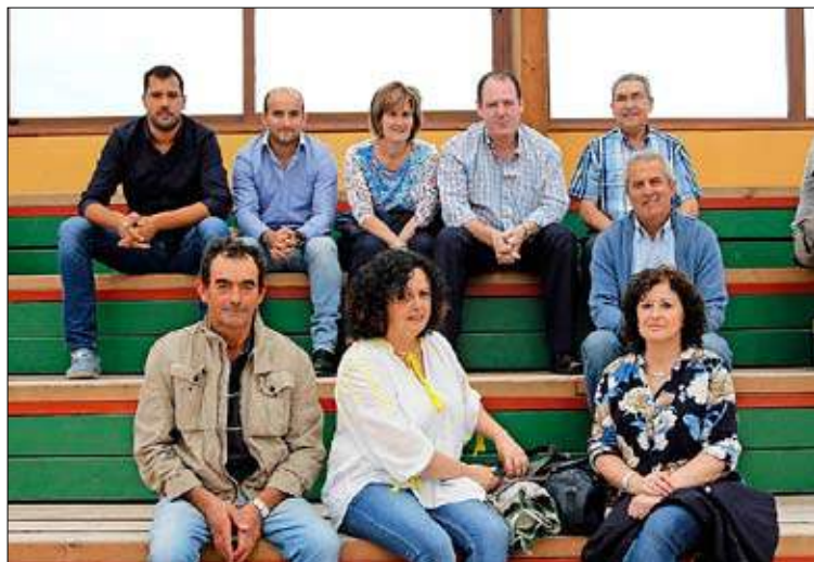
La 'familia' de la Peña Peñacastillo no faltó a la cita. / JOSÉ RAMÓN