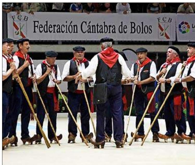
La Fuentona de Riente actuando en la bolera.