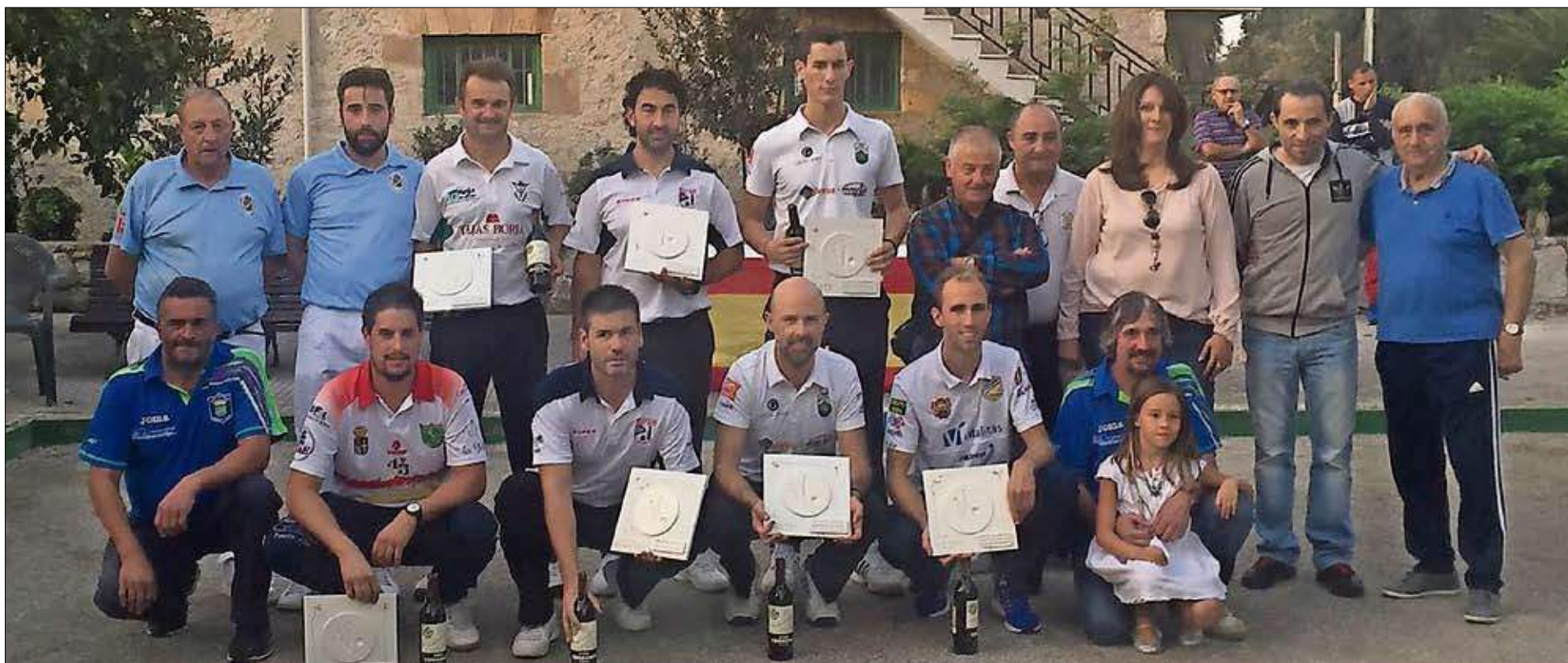
Participantes, organizadores y árbitros tras la entrega de premios en Villanueva de Villaescusa.