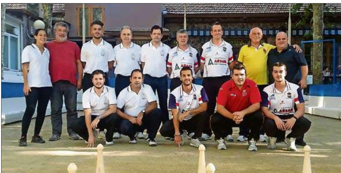
Para celebrar el 70 aniversario de la Peña Madrileña, en la capital de España se celebró un partido amistoso, que finalizó con empate, entre el equipo local y La Carmencita de Santander.

de Primera categoría individual de bolo pasiego. La competición se iniciará a las 10.00 horas con la primera vuelta de los octavos de final. La segunda será a continuación, mientras que la fase final se iniciará a las 16.30 horas en orden inverso a la clasificación anterior.