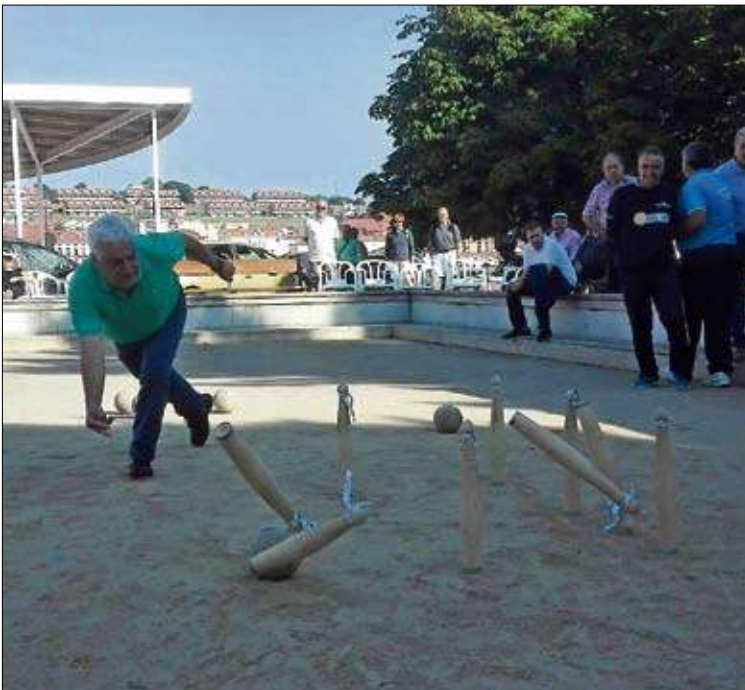
El presidente de la Federación Cántabra, Serafín Bustamante.