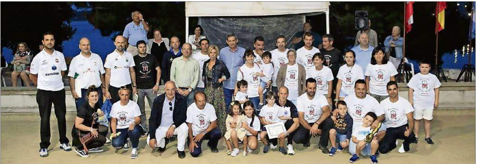
Organizadores, autoridades locales, colaboradores y jugadores de Primera categoría.