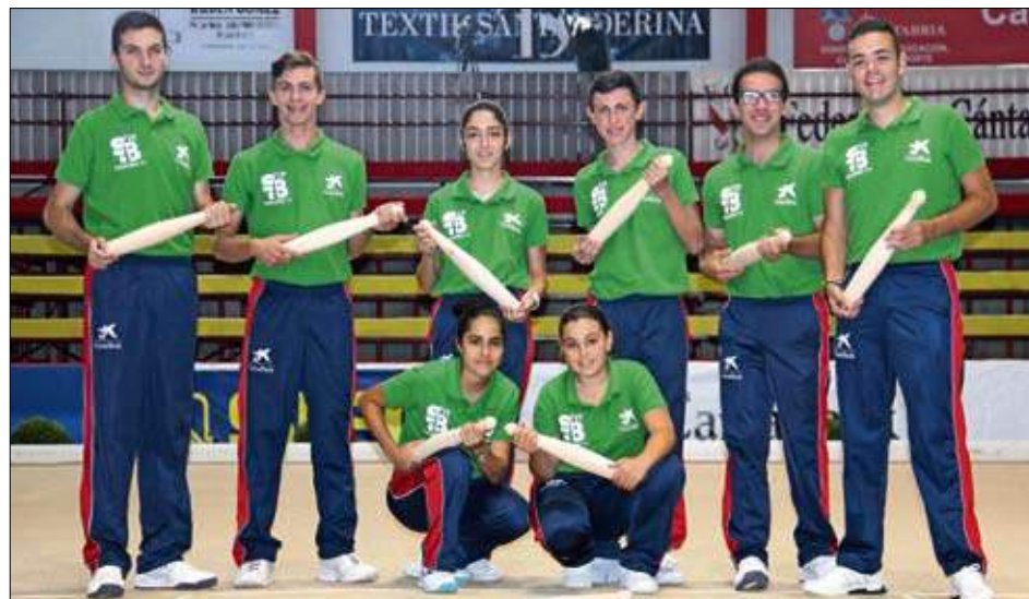
Armadores de la Semana Bolística.

Trabajo en equipo y espíritu de superación. Valores que compartimos con el deporte cántabro.