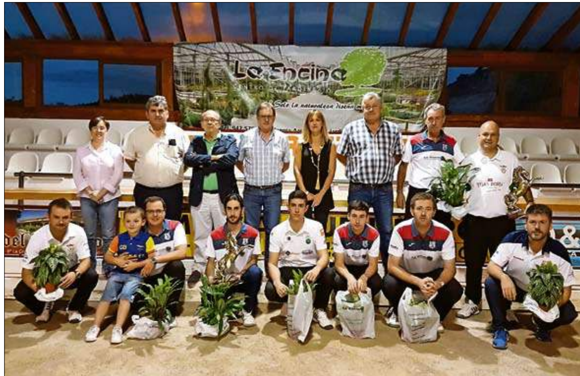
Jugadores, autoridades y organizadores posan tras la entrega de premios.

La cuantía en premios ascenderá a 12.000 euros. El campeón recibirá