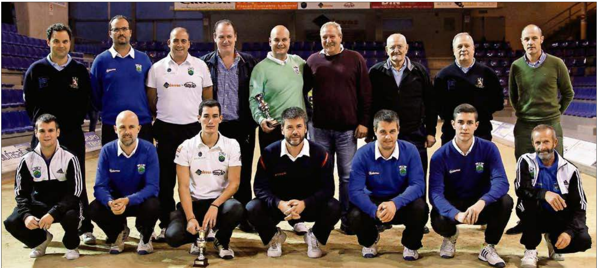
Jugadores, autoridades, organizadores, árbitros y armadores posan al final de la competición, celebrada en la bolera Mateo Grijuela.