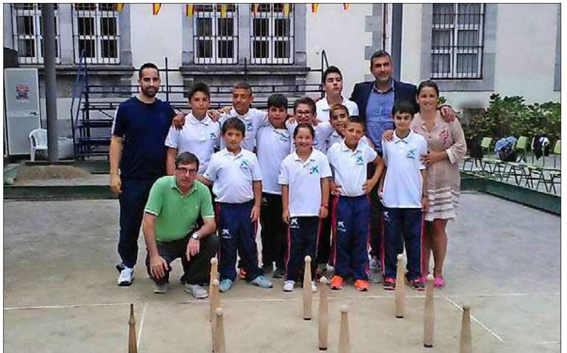
Alumnos de la Escuela Abelardo Ruiz de Santoña, que participaron en la Jornada de Convivencia.

Día de convivencia en Santoña. La Escuela Municipal Abelardo Ruiz celebró en la bolera El Parque de Santoña su tradicional Día de Convivencia con la participación de los alumnos de la Escuela, junto con los padres y los monitores. Buena tarde de bolos la que ofrecieron los