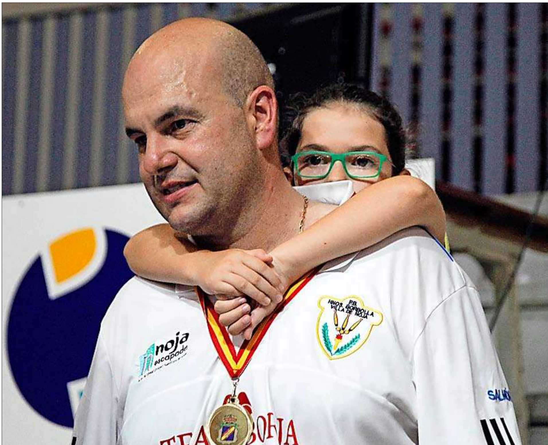
Una orgullosa Adriana abraza a su padre, que acaba de proclamarse campeón de España.