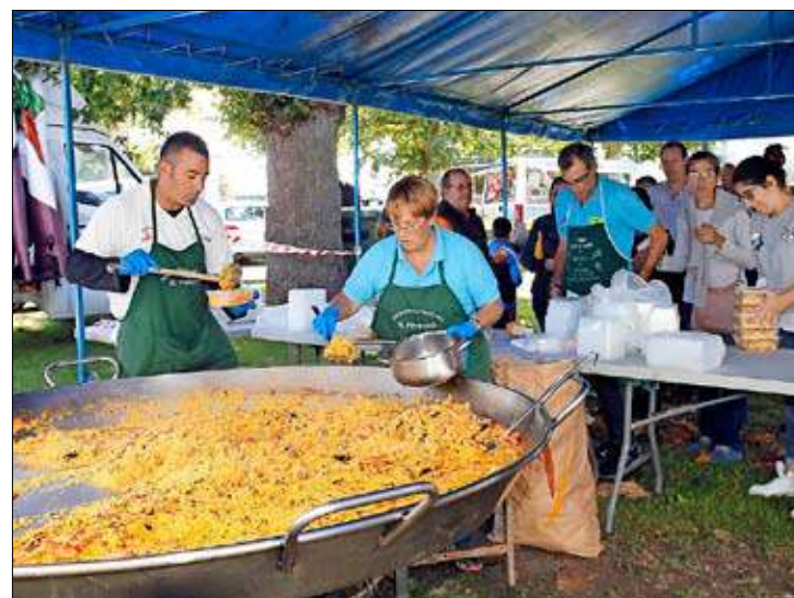
La Asociación El Pimiento realizó una sabrosa paella.