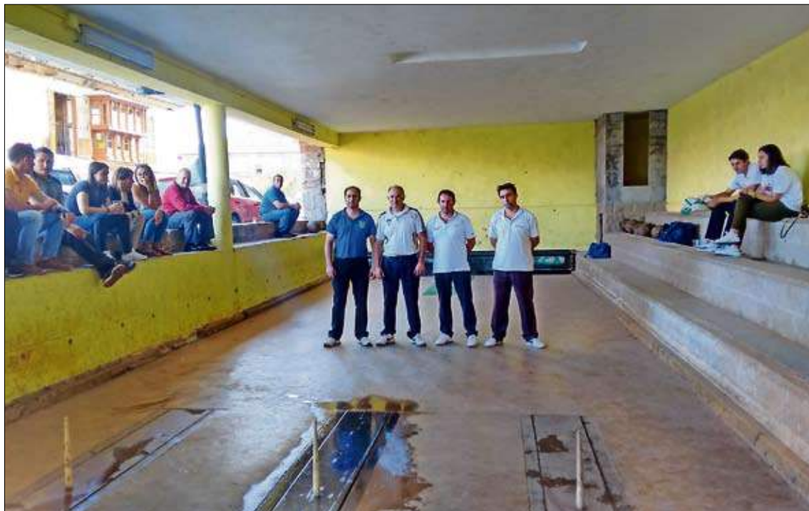
Los cuatro primeros clasificados en la bolera La Plaza de San Pedro del Romeral.