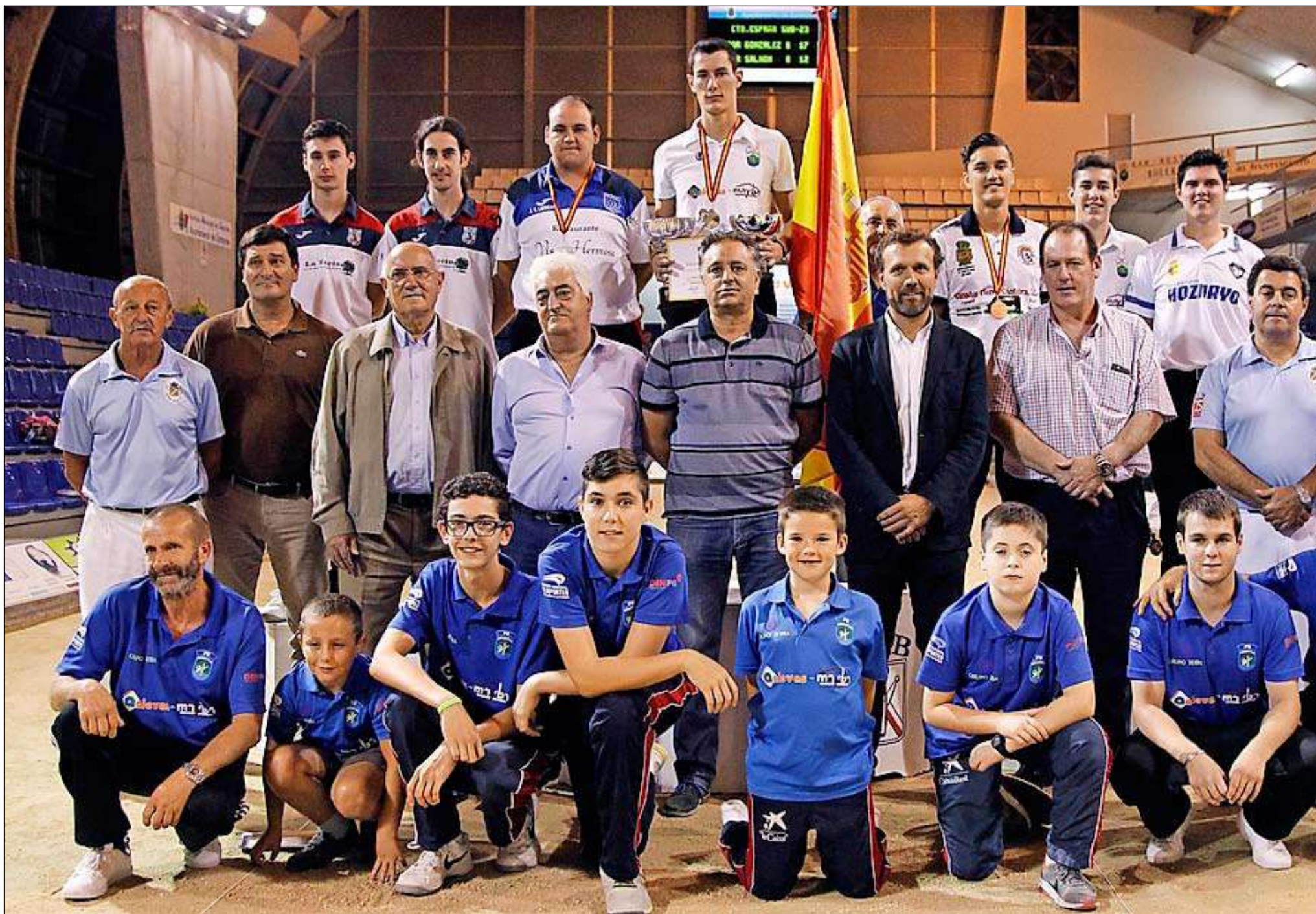
Jugadores, autoridades, árbitros y organizadores tras la entrega de premios.