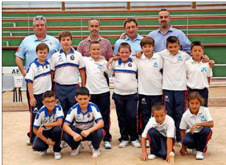
Escuelas de Peñacastillo y Manuel García alevines-benjamines.