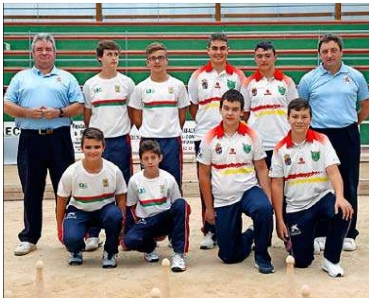
Infantiles de las Escuelas de Torrelavega y Sobarzo. / JOSÉ RAMÓN