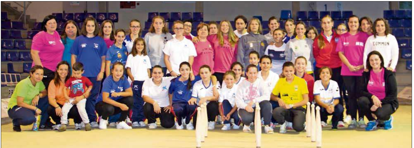
Locales y foráneas, de todas las edades, disfrutaron de una gran jornada en la bolera Mateo Grijuela, con el bolo palma como protagonista.

El jurado del VI Premio Muslera, reunido en sesión ordinaria el día 30 de septiembre de 2017, a las 12:30 horas de la tarde, tras celebrar las deliberaciones oportunas conducentes a la emisión del fallo correspondiente a esta edición, informa de que por unanimidad de todos sus miembros, ha decidido que el VI Premio Muslera recaiga en las empresas Hermanos Borbolla y Puertas Roper. Para este nombramiento se ha tenido en cuenta que, tras haber otorgado el premio en anteriores ediciones a distintos protagonistas de nuestro deporte, desde el estamento de jugadores, al de federativos, pasando por los artífices de la promoción del mismo, considera el Jurado que es de justicia distinguir, en esta VI edición, a las empresas que sustentan desde la aportación económica, el mantenimiento y crecimiento de nuestro deporte, y que en ambos casos llevan más de 30 años haciéndolo desde el patrimonio personal y familiar. La candidatura ha sido presentada por la Junta Directiva de la Peña Los Remedios Vitalitas. La ceremonia de entrega del IV Premio Muslera está prevista para el día 4 de noviembre, a las 12:00 horas, en la Sala Bretón de Astillero.