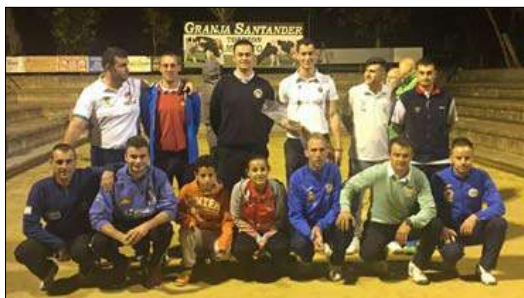
Participantes en Solórzano. / ALERTA

La tenista danesa Caroline Wozniacki se proclamó este domingo campeona de las Finales de la WTA, que se disputaron durante esta semana en Singapur, después de imponerse en la gran final a la estadounidense Venus Williams (6-4, 6-4), y se convierte así en 'maestra' por primera vez en su carrera. La europea, número seis del mundo, empleó una hora y media en doblegar a su rival, a la que vence por primera vez en los ocho enfrentamientos que han tenido en el circuito.