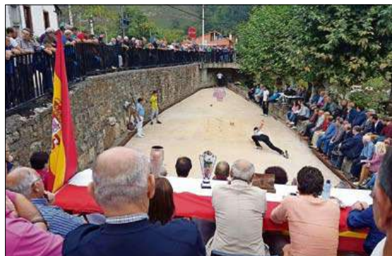
La bolera de Cosío ofreció un magnífico aspecto.