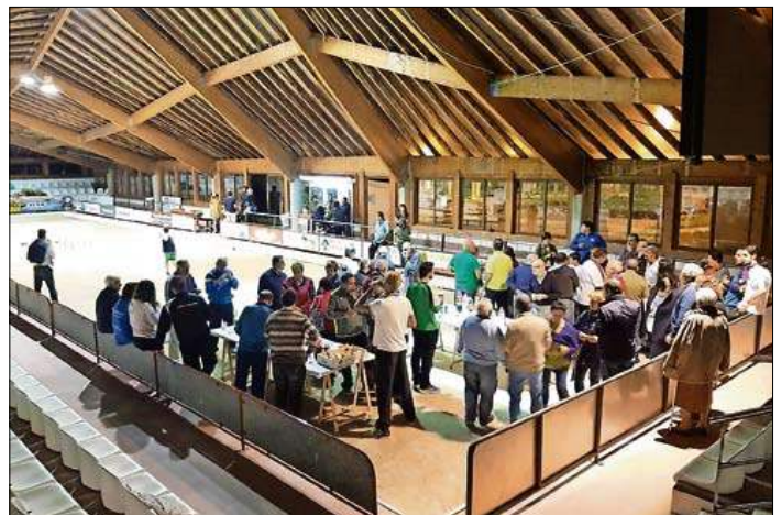
Los aficionados que se dieron cita en La Anunciación disfrutando de la barbacoa.