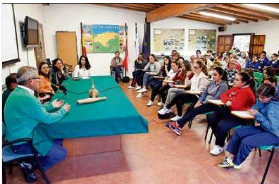
Primera mesa redonda en el Aula Madera de Ser.