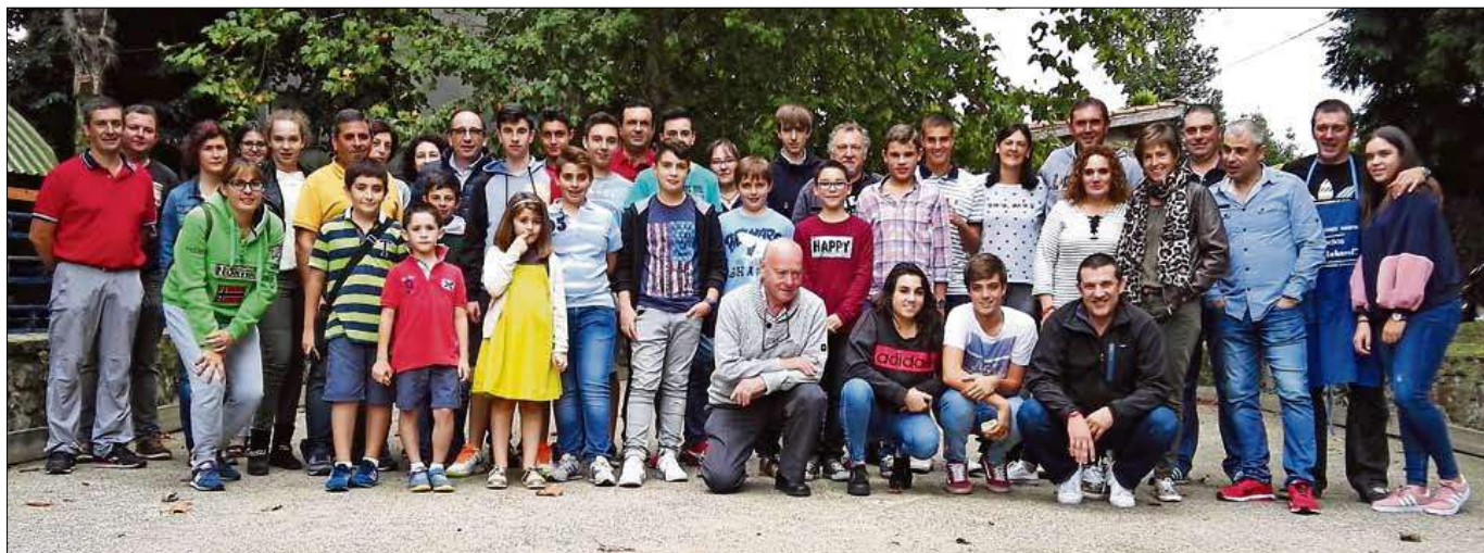
Fiesta fin de temporada de la Escuela de Bolos Borsal Textil de Cabezón de la Sal.