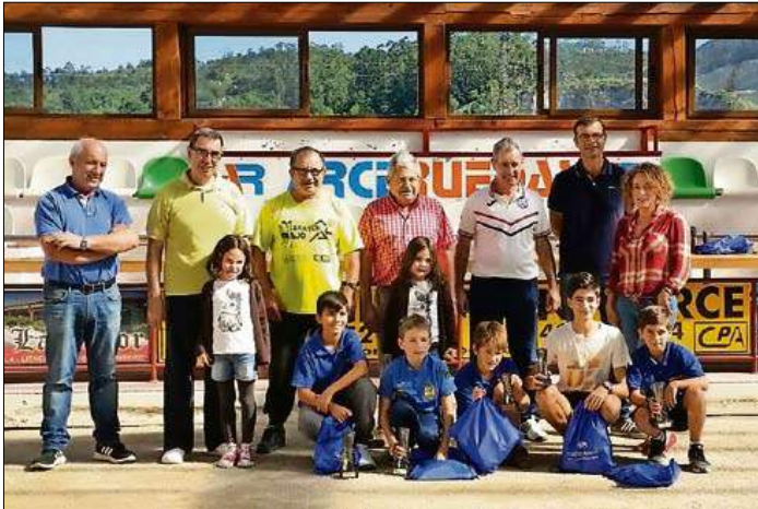
Finalistas de las categorías menores.