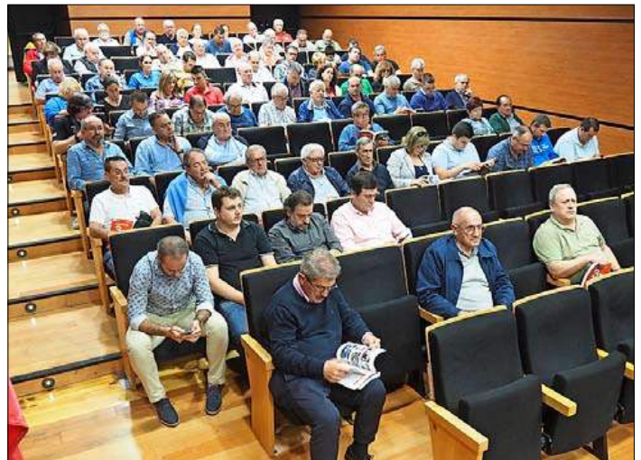
Buena asistencia de público a la presentación.