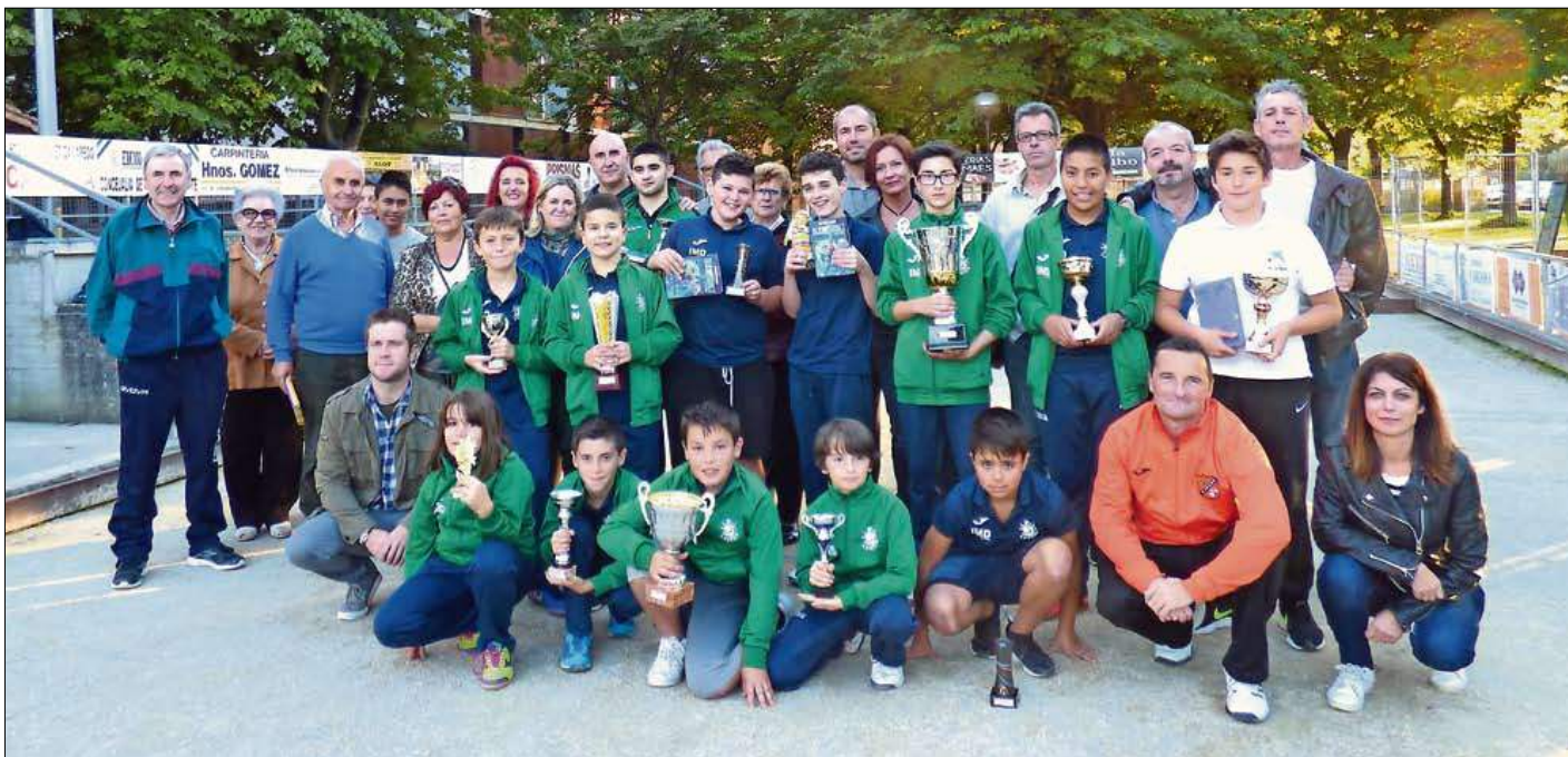
Por fin, después de varios aplazamientos por la lluvia, la Escuela de Bolos de Laredo pudo celebrar su fiesta de clausura en la bolera El Corro de la villa pejina.