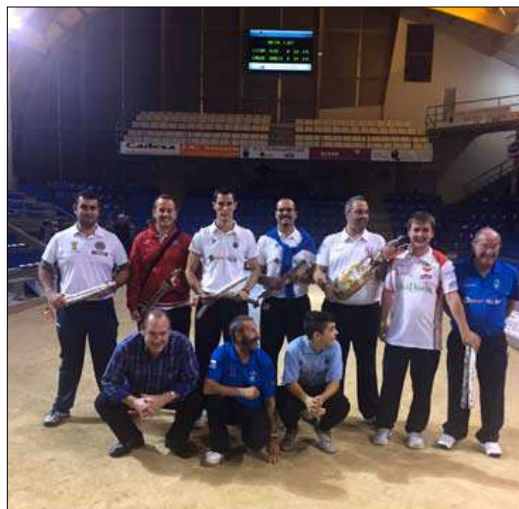
Jugadores participantes en el social de Peñacastillo.