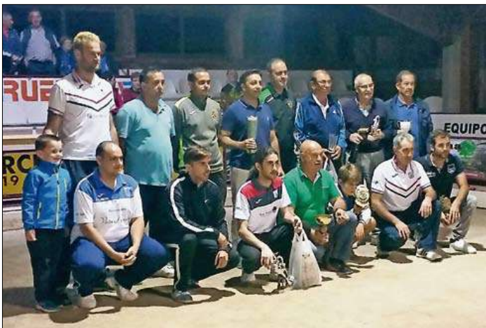
Foto de familia de los finalistas de las diferentes categorías.