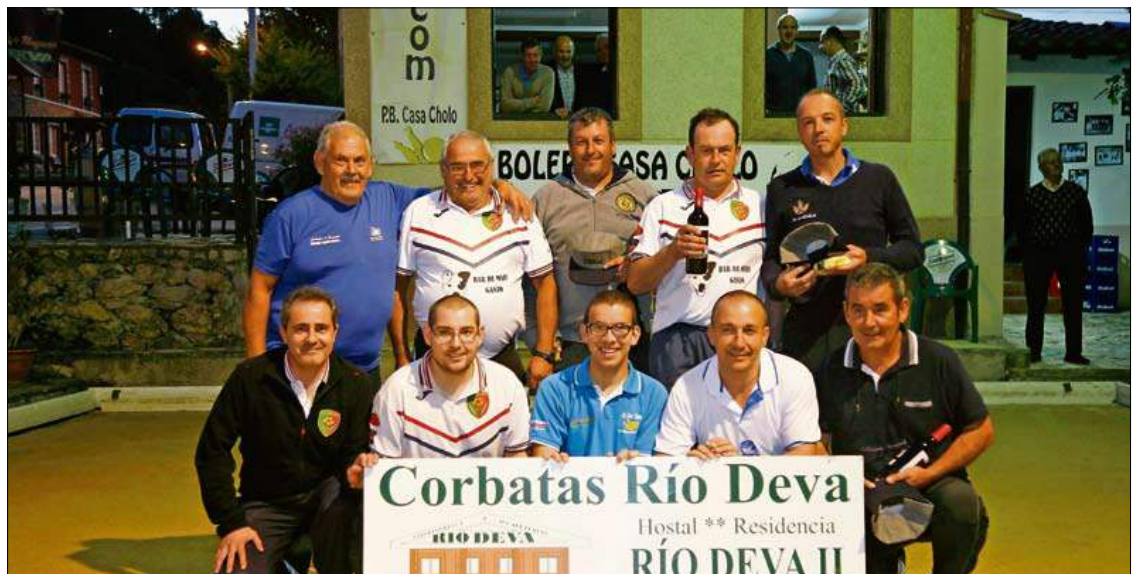
Finalistas de la categoría B.