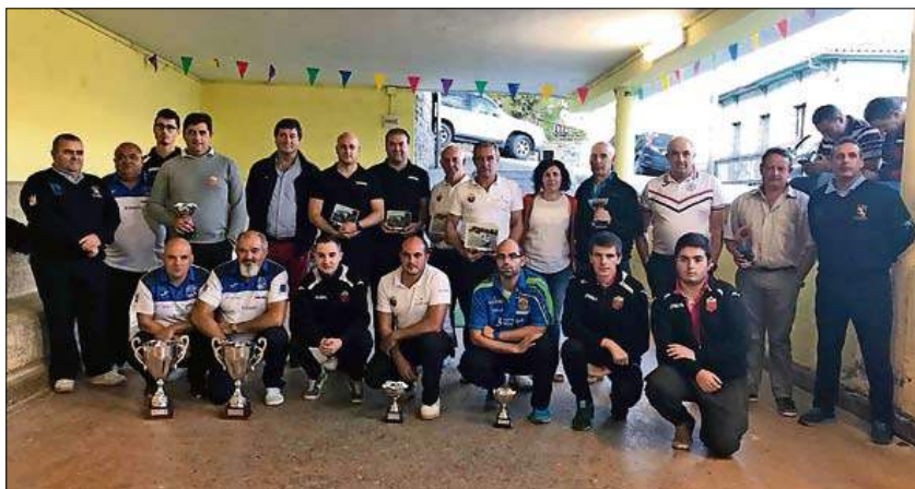
Participantes, autoridades y organizadores tras la entrega de trofeos.