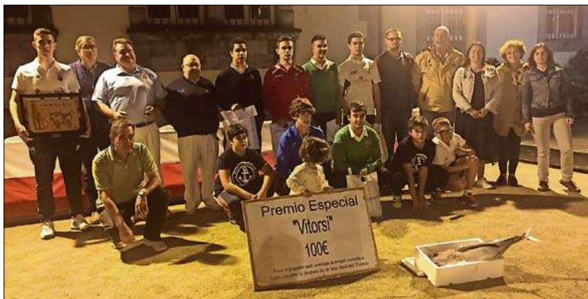
Jugadores, organizadores y autoridades tras la entrega de premios.

La normativa del torneo recoge que se jugará por equipos de cuatro jugadores, que deben tener, todos ellos, licencia de aficionados por la Federación Cántabra de Bolos; que los equipos deberán estar formados por los mismos jugadores con los que participaron en su Liga, admitiéndose, en caso de necesidad, un solo cambio de otro equipo de la misma liga; los tiros serán 11, 12 y 13 metros. Los cuartos de final se jugarán a tres chicos ganados, con cierre a 35 bolos; las semifinales, a tres chicos, con cierre a 40; y la final, a cuatro chicos con