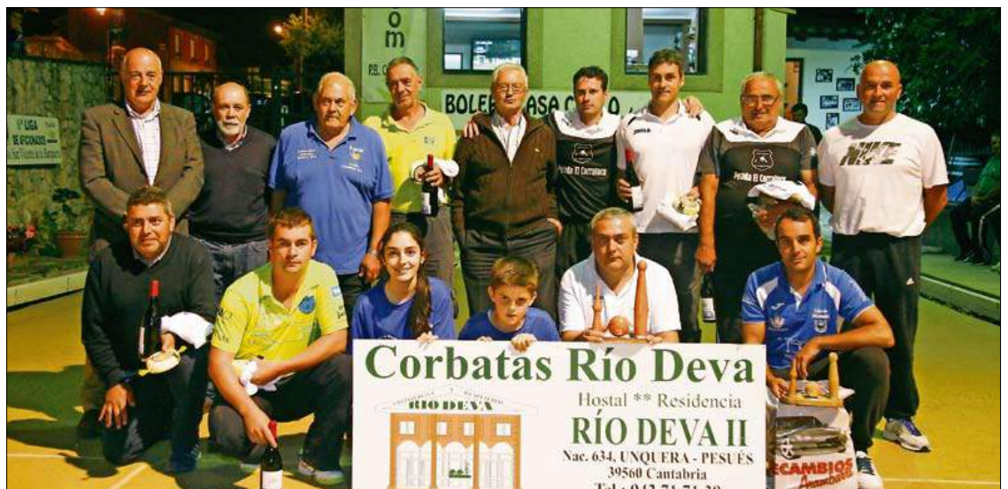
Finalistas de la categoría C. / A. FERNÁNDEZ