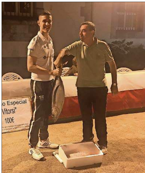
El campeón se llevó el tradicional bonito donado por Pescadería Angelachu.