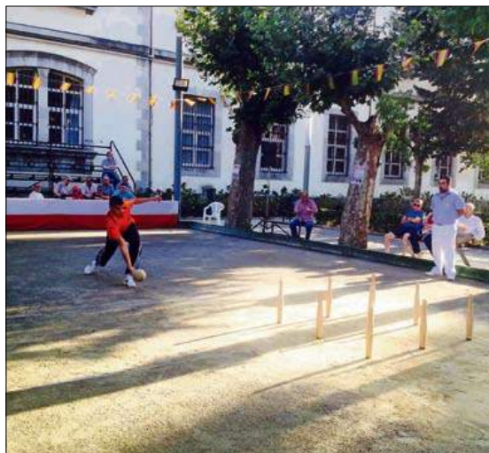
Bolera El Parque de Santoña, durante una competición.

SOCIALES DE LA PEÑA LA ENCINA. Los días 6, 9, 10, 11 y 13 de octubre, de 16.00 a 20.00 horas, se realizarán las tiradas de clasificación de los Sociales de la Peña La Encina de Santander. Podrán participar los jugadores de todas las categorías: federados, veteranos y aficionados. La inscripción es de 8 euros. El primer clasificado recibirá un jamón y una botella de vino; y el resto de finalistas, un lote de productos gastronómicos. Las finales, con los ocho jugadores que más bolos derriben están previstas para el día 14 de octubre, a partir de las cuatro de la tarde.