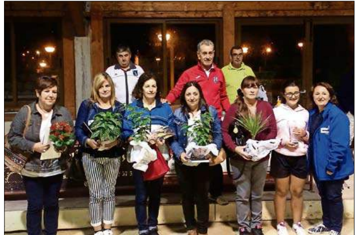
Primeras clasificadas en el Concurso del 51 femenino.