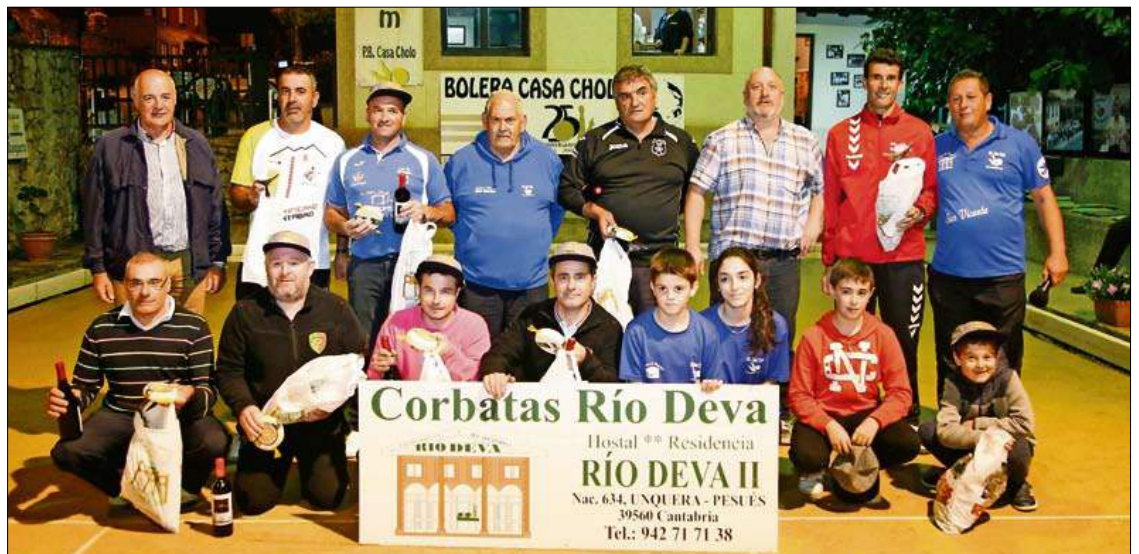
Finalistas de la categoría A.

SOCIALES PEÑA CARRIMÓN. Del 16 al 19 de este mes, de 15.30 a 19.30 horas, en la bolera Jesús Vela Jareda de Renedo de Piélagos se celebrarán los tiradas de clasificación para los Sociales de la Peña Carrimón para las categorías de veteranos, aficionados y federados.