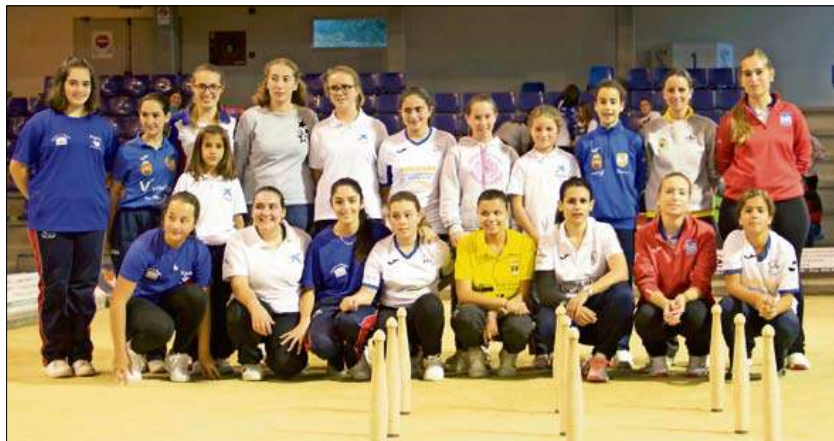
Jugadoras de bolo palma que participaron en el Encuentro.

Si el primer día, como ya recordamos, se celebró una interesante mesa redonda titulada 'La mujer en el mundo de los bolos, una historia de lentas conquistas. Caminos por recorrer', que sirvió para que las participantes