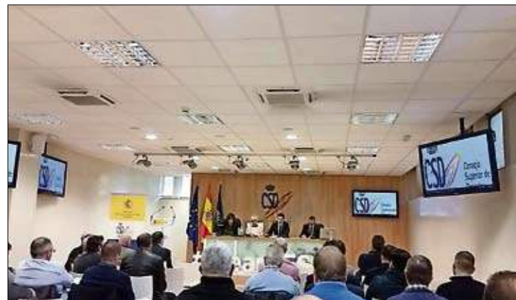
El Consejo Superior de Deportes fue escenario de la Asamblea.

La Peña Los Chopos organizará los campeonatos de veteranos y cadetes; la Peña San José, el de Segunda; La Carmencita, el de Tercera; la Peña Peñacastillo, el sub-23; la Peña Pontejos, el juvenil; y está pendiente de designación el Torneo