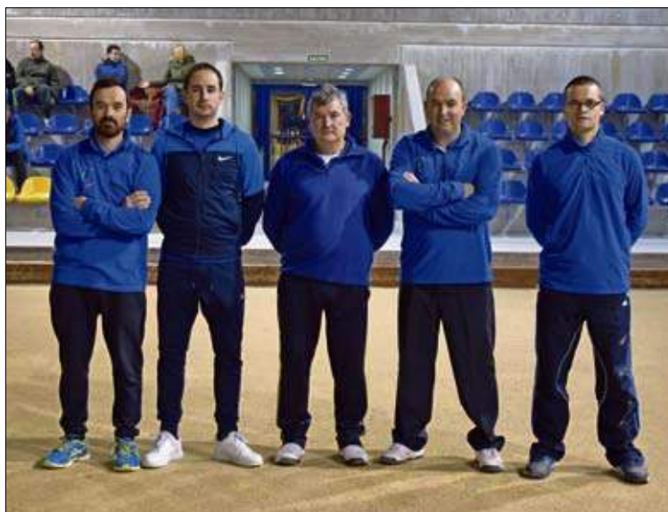
Peña Las Acacias, que juega en la Liga de Val de San Vicente.

18.30 horas; Cuera-El Picón, domingo, 11.30 horas; Sobarzo B-Beranga Transportes Iñaki, domingo, 16.00 horas; y San Cipriano (veteranos)-El Surtidor, domingo, 18.00 horas.