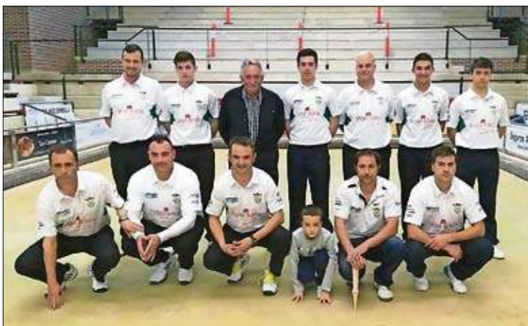
Amistoso de presentación entre los equipos Hermanos Borbolla Villa de Noja, de División de Honor, y Noja Hnos. Borbolla, de Segunda Especial.