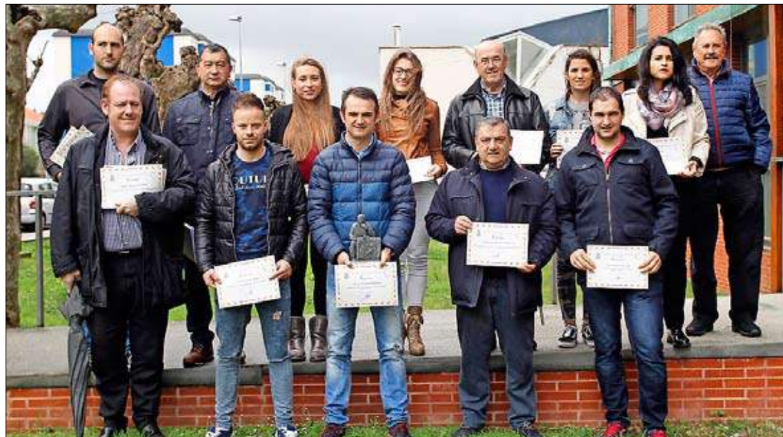
Los campeones de los Circuitos recibieron sus respectivos diplomas.

1. En la Liga de Primera categoría, si un partido se suspendiese dos veces, a la tercera convocatoria debe ser obligada su celebración (vigencia en esta