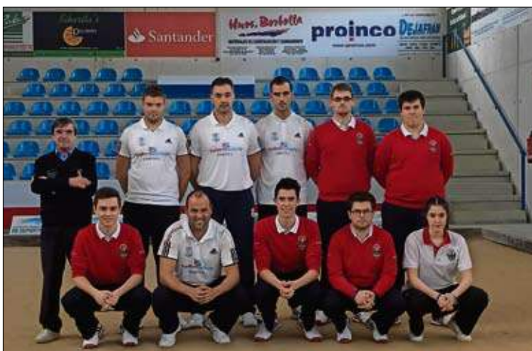
Amistoso Club Bansander-San Martín de Coos Isidoro San Justo.