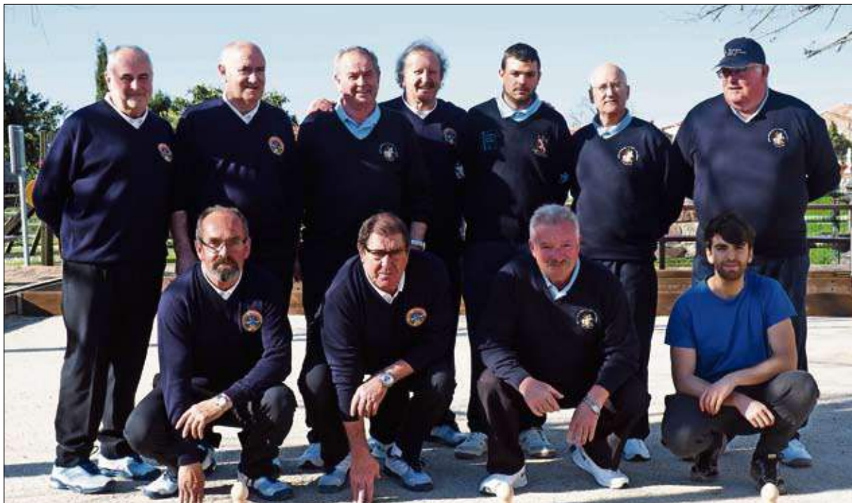
San Jorge Vila Electroquímica y Torrelavega Siec abrieron ayer la Liga con victoria para los debutantes veteranos de la Carmelo Sierra, que se impusieron por 1-5 en Viérnoles.