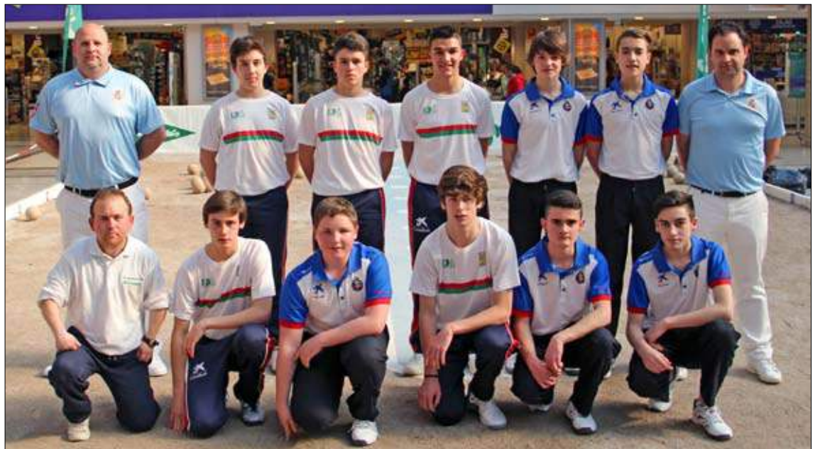
Escuelas cadetes Manuel García de La Cavada y Torrelavega. / JOSÉ RAMÓN

AMISTOSOS PARA HOY. 12.00 horas: Quijano-Puertas Roper, en El Molino de Quijano (Piélagos); 17.00 horas: Los Remedios Vitalitas-Hermanos Borbolla Villa de Noja, en Guarnizo; 17.00 horas: Comercial Santiago-Riotuerto Hotel Villa Pasiiega, en Gajano; 17.00 horas: Casar Delicatessen La Ermita-Noja Hnos. Borbolla, en Casar de Periedo; 17.00 horas: Ontoria-Torrelavega Siec, en la bolera San Roque de Ontoria; 17.30 horas: Mali Jardinería La Encina-Puertas Roper, en Puente Arce.