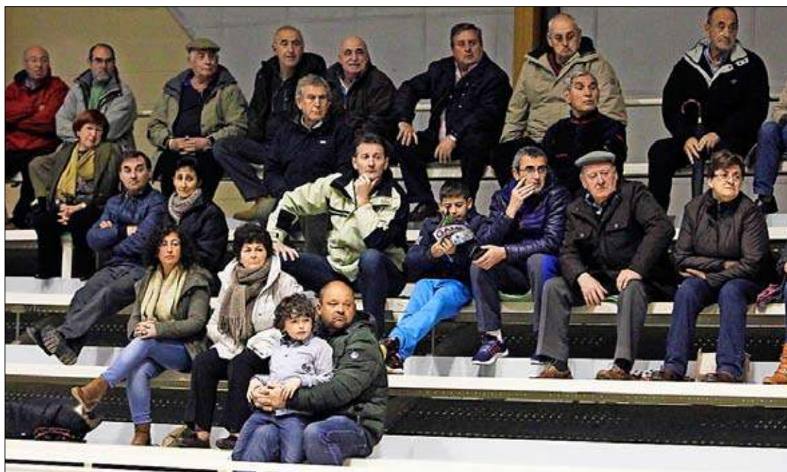
Numeroso público se dio cita en El Parque para presenciar el primer partido de Liga.