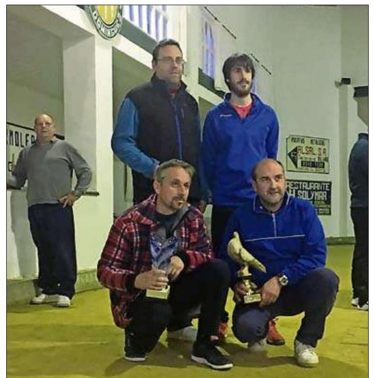
Talleres Iglesias y Liaño, equipo campeón.

Con una sabrosa merienda concluyó esta interesante competición.