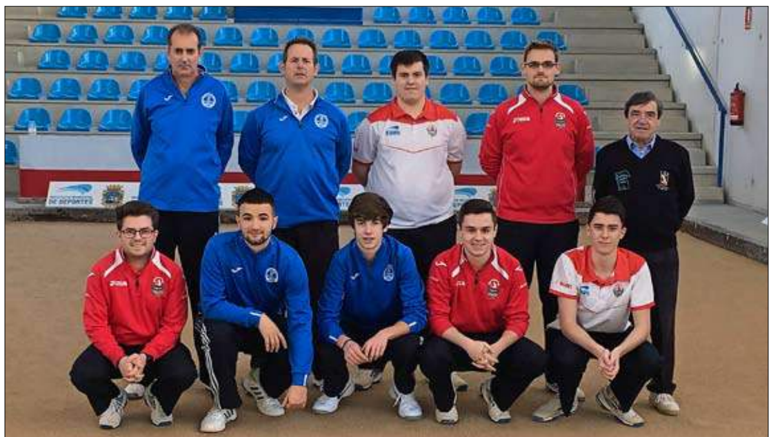
El Club Bansander y Quijano disputaron en la bolera Marcelino Ortiz de Cueto un partido de pretemporada en el que ganaron por 1-5 los de Piélagos.