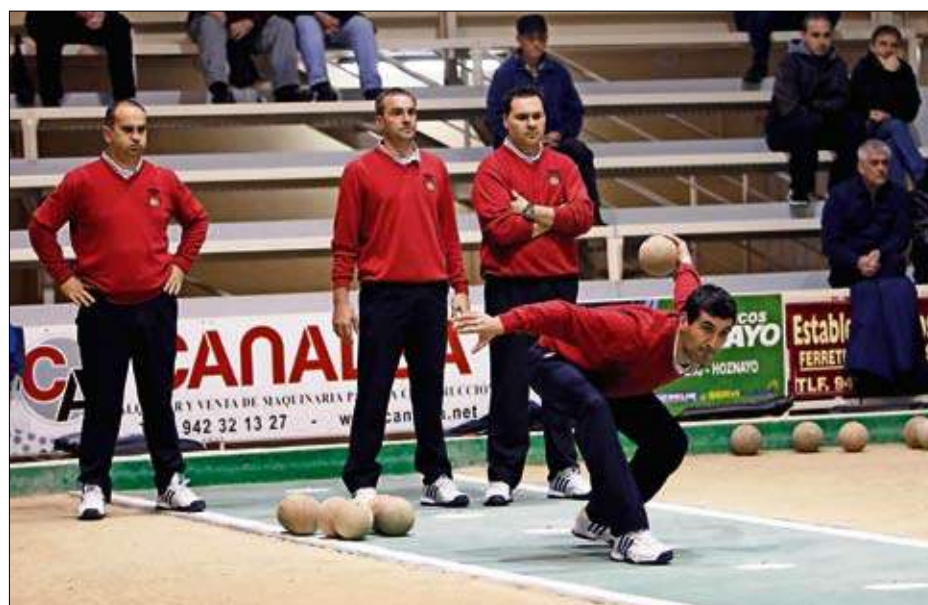
La Peña Casa Sampedro, ayer en el tiro de la bolera El Parque de Maliaño.

formaciones. Casa Sampedro es el primer semifinalista de la Copa Apebol-Trofeo Hipercor y su rival saldrá del encuentro que hoy, a las 12.00 horas, jugarán Sobarzo y Comillas, en la bolera Mateo Grijuela. Para los de Penagos será el primer contacto de la temporada con la competición oficial al haber estado exentos de la primera ronda, mientras que los comillanos llegan plenos de moral tras haber eliminado a Puertas Roper. El domingo se completará el cuarto de semifinales con los choques Rio-tuerto Hotel Villa Pasiega-Noja Hnos. Borbolla (12.00 horas en Noja) y Torrelavega Siec-J. Cuesta (18.00 horas en Torrelavega).