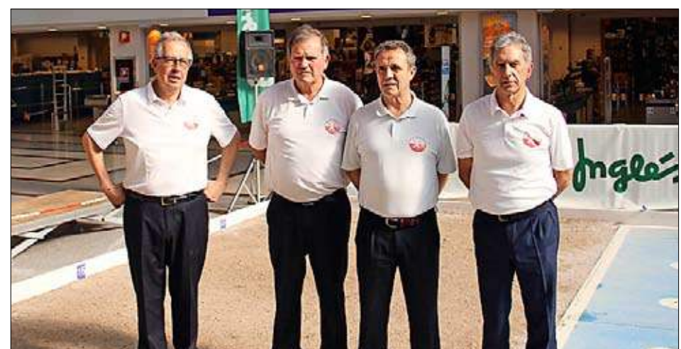
Peña San Cipriano de veteranos.