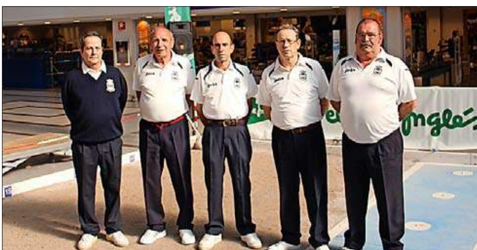
Peña Posadillo Ayuntamiento de Polanco de veteranos.