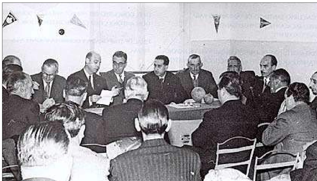
Asamblea de 1958 en la que se creó la competición de Liga.

Este último fin de semana de marzo comenzamos