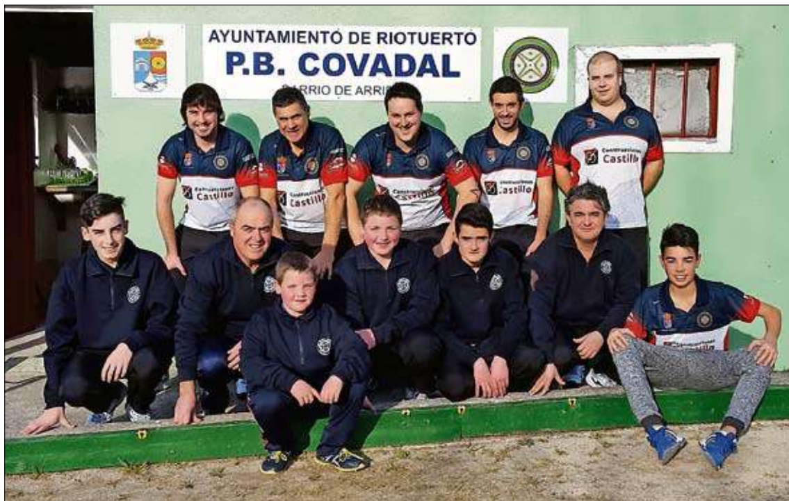
Amistoso entre los equipos de la Peña Covadal, del Barrio de Arriba de Riotuerto.