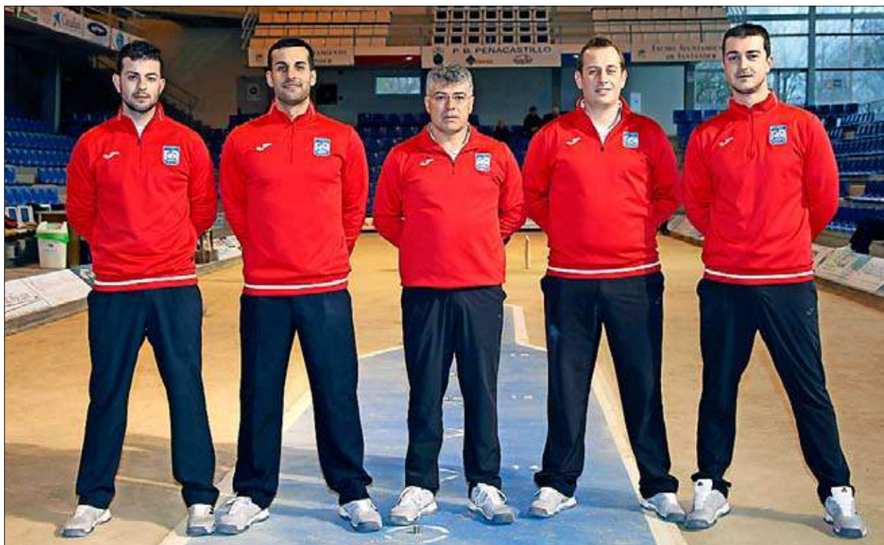
Peña La Carmencita Ventanas Arsán de Primera categoría. / JOSÉ RAMÓN