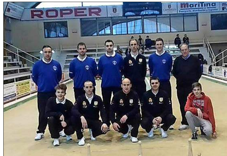
Los Remedios Vitalitas-Pámanes Distribución de Gasóleos.