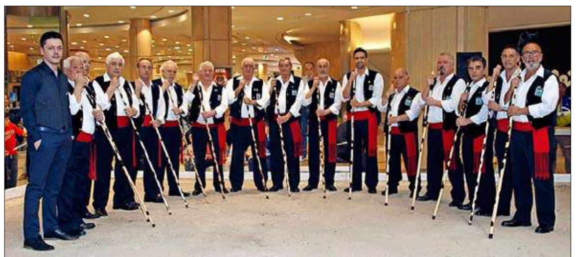
El Coro Ronda Altamira interpretó la canción de los hermanos Cianca 'Arriba los Gananciosos'. / JOSÉ RAMÓN

PROGRAMA PARA HOY. Hoy, la bolera de El Corte Inglés estará a pleno rendimiento. A las 10.15 horas se darán cita en el cutío portátil los alumnos de infantil del CEIP Cisneros de Santander que participarán en el Proyecto Educativo Madera de Ser. Desde las 16.00 horas intervendrán las peñas de veteranos Carrimón, de Renedo de Piélagos, y Abanillas; a partir de las 18.00 horas jugarán las peñas de Segunda, San Roque Chade de Colindres y Luey Construcciones Cintu; y cerrarán el día las peñas de Primera, San José Rocacero de Sierrapando y La Carmencita Ventanas Arsán.