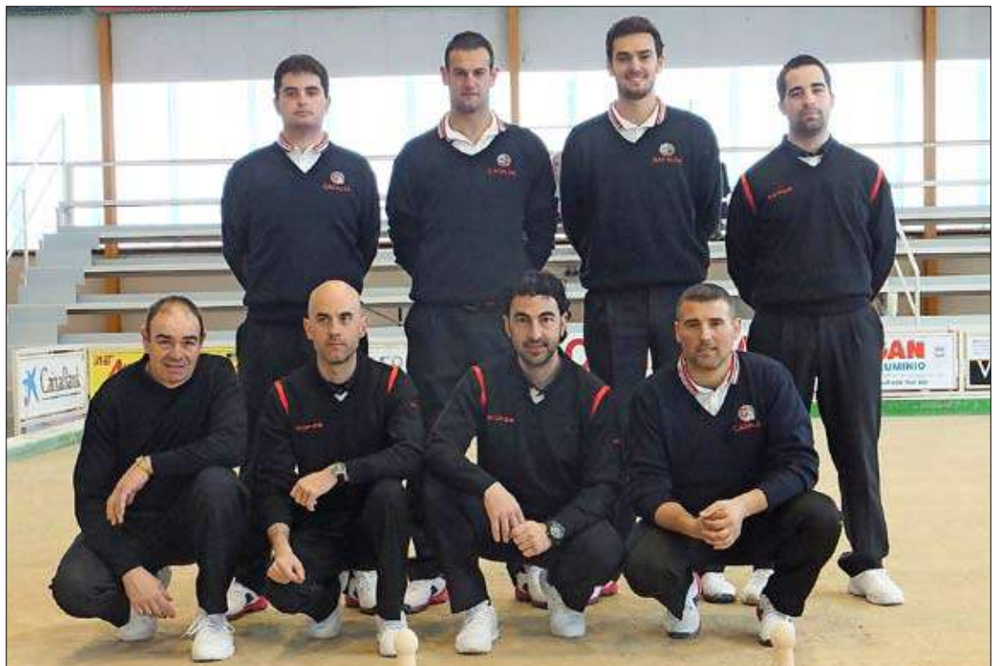
Laredo Canalsa y Puertas Roper jugaron en El Parque de Maliaño un partido amistoso, que concluyó con el triunfo de los de Maliaño por 6-0.

Marcador: 1-0 (V16 metros, raya alta a la mano. D20): 46-41; 1-1 (L16 metros, raya alta al pulgar. D20): 26-58; 2-1 (V15 metros, raya alta a la mano. D20): 76 (36/40)-72 (31/41); 3-1 (L16 metros, raya alta al pulgar. D20): 82 (40/42)-78 (40/38).