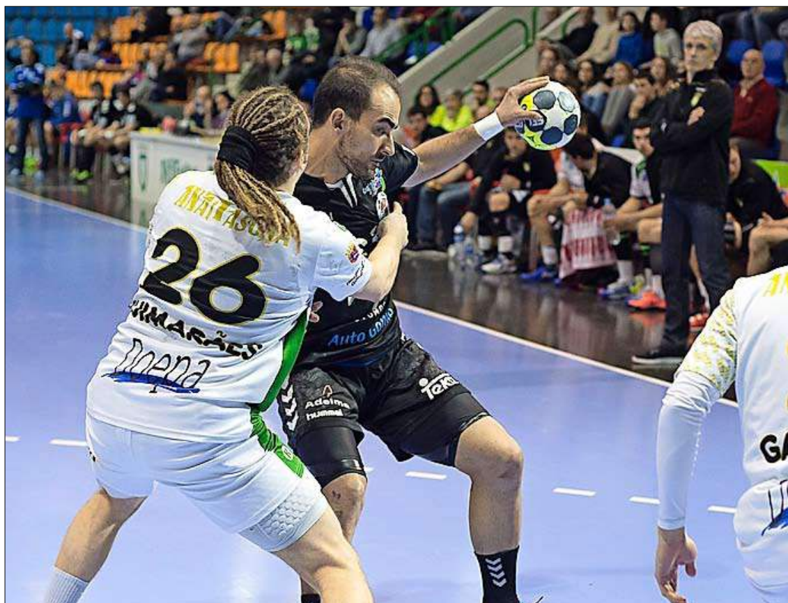
A los cántabros les costó mucho superar la defensa navarra.

Lo cierto es que el cuadro navarro comenzó llevando el peso del encuentro y consiguió llevar la iniciativa en el tanteador durante todo el enfrentamiento. Intensidad en ataque, pero también en defensa y es que el conjunto santanderino se topó una y otra vez contra un muro y los jugadores visitantes no encontraron nunca posiciones cómodas de lanzamiento. A los pupilos de Rodrigo Reñones se les puso cuesta arriba la situación con un parcial de 3-0 de inicio. Los visitantes habían salido muy tensos, revolucionados, perdiendo muchos balones y precipitándose en ataque. En el Anaitasuna destacaban Chocarro y Etxeberria, poniendo en continuos aprietos a la zaga rival desde los extremos.