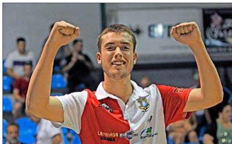
El flamante campeón, celebrando el título. / JOSÉ RAMÓN