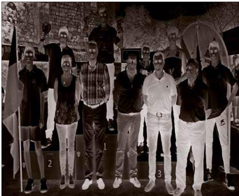
Los primeros clasificados con autoridades y organizadores.

Se clasifican las cuatro mejores parejas de cada categoría para las finales que están previstas para los días cinco (alevín e infantil) y siete de agosto (cadetes), a partir de las 16.00 horas. Teléfono de contacto: 656 744 533.