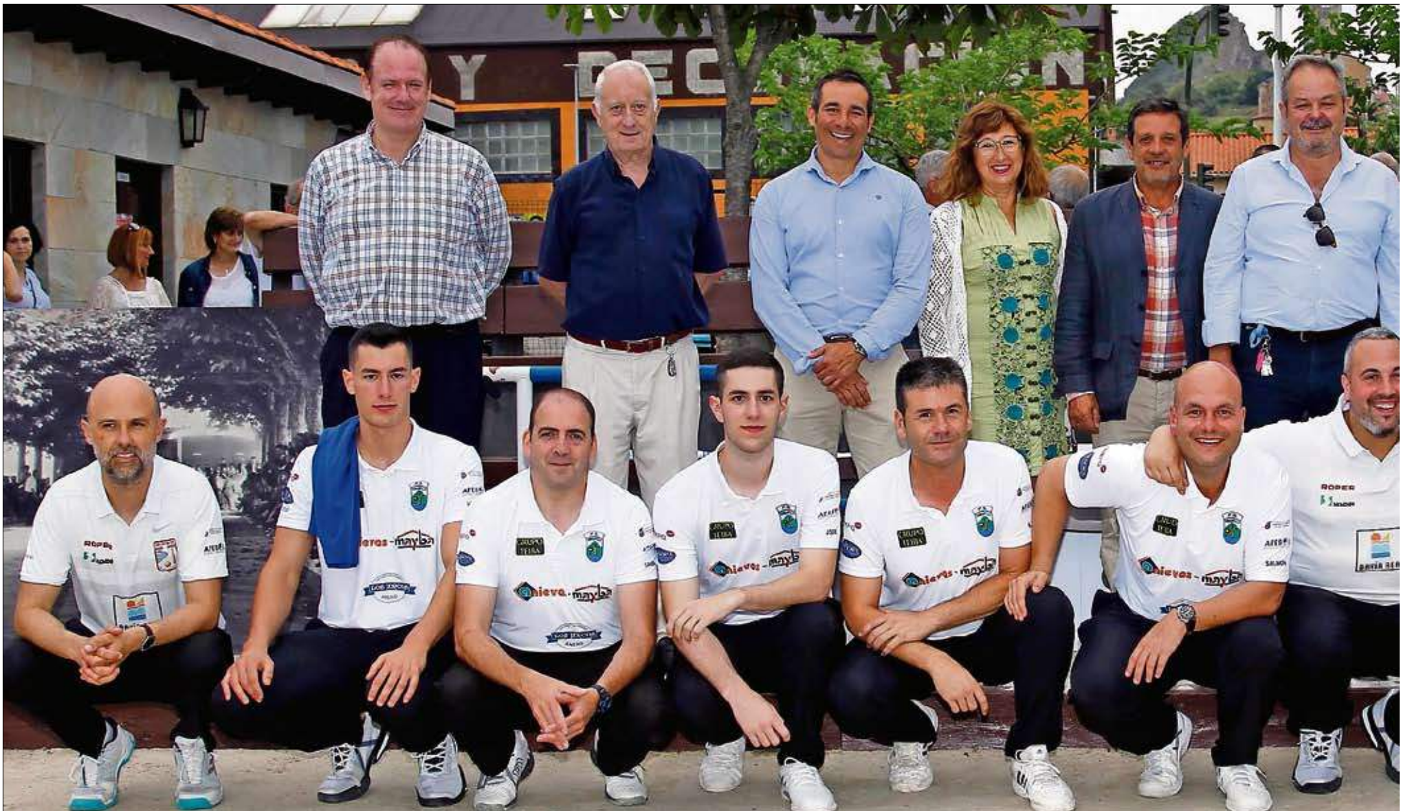
Jugadores, autoridades y organizadores tras la entrega de premios.