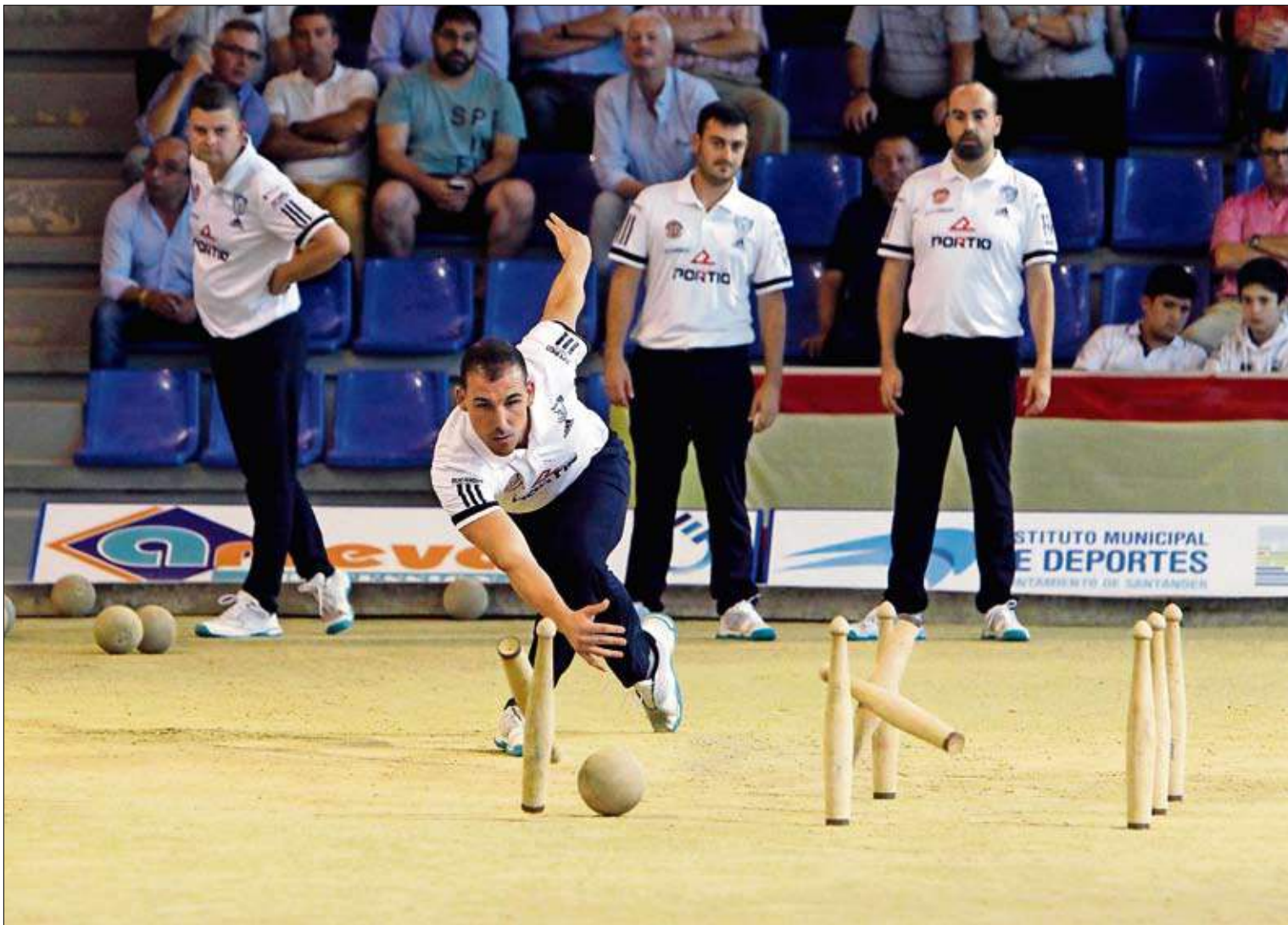
Los jugadores de Ribamontán al Mar Construcciones Portio durante un encuentro.