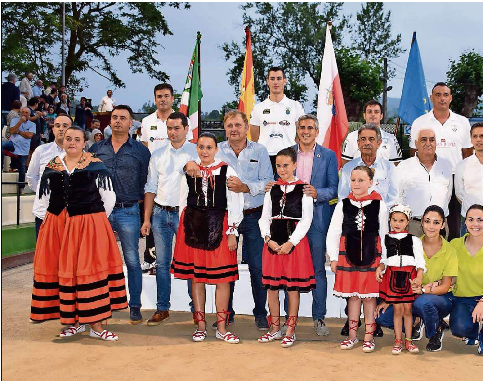
Podio final del campeonato junto a autoridades y organizadores.