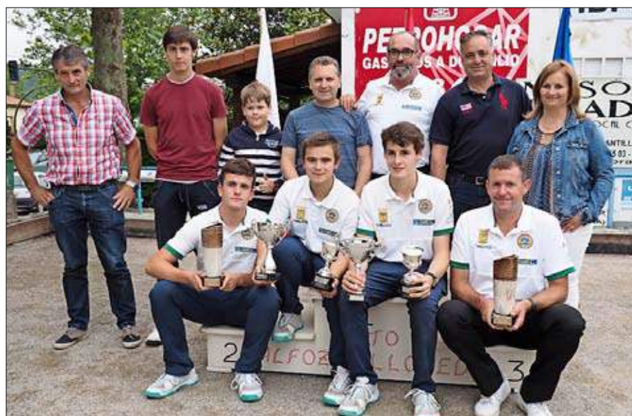
La 'familia' de la Peña Torrelavega Siec celebrando los éxitos de sus pupilos.