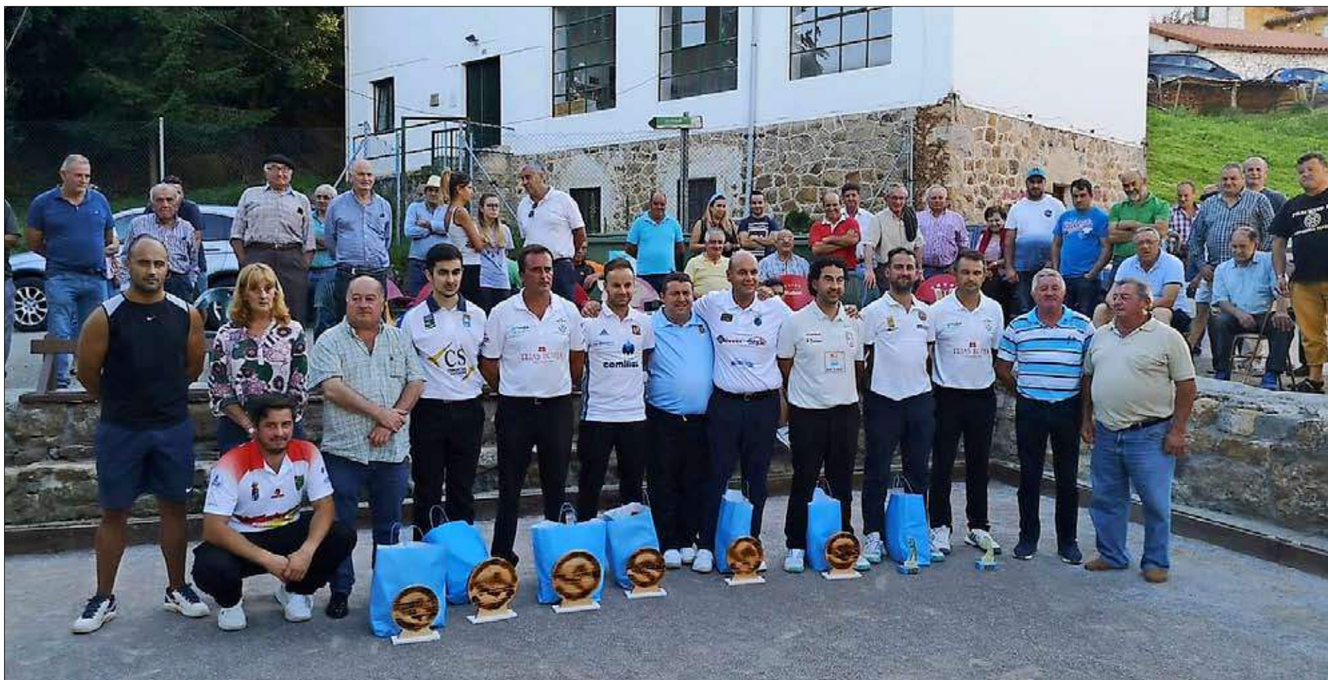
Jugadores, autoridades y árbitro posan tras la entrega de premios.