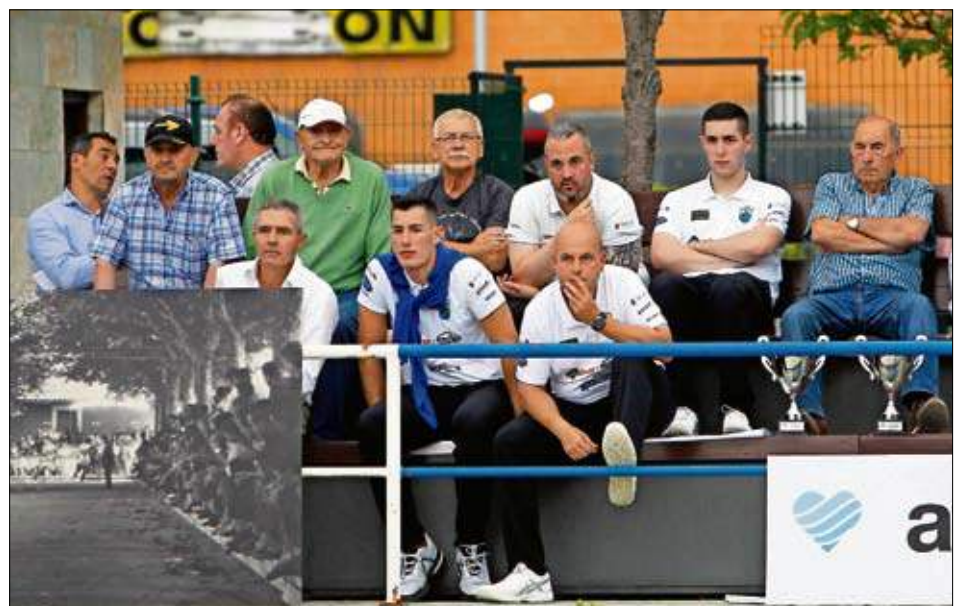
Público y jugadores eliminados observan la final. Delante de ellos una de las fotografías que recuerdan la antigua bolera de Camarreal.