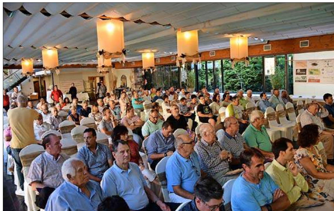
En la fotografía superior autoridades y campeones de ayer y de hoy en la foto familia durante la presentación. En la foto inferior parte del numeroso público que acudió al acto.

viernes, día 19, con las dos vueltas de octavos de final, con el siguiente orden de tiradas: