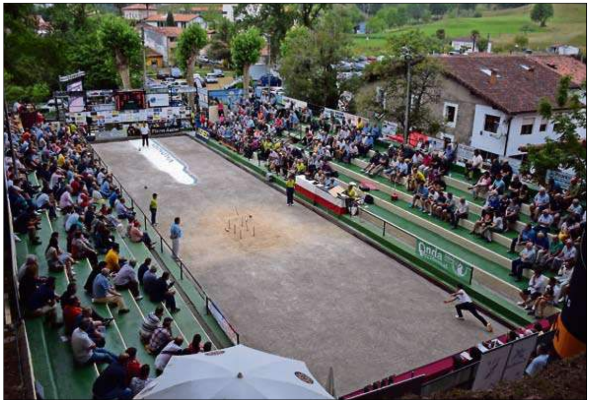
La Cocina de Roiz será escenario de nuevo de hoy de una de las grandes citas de temporada.