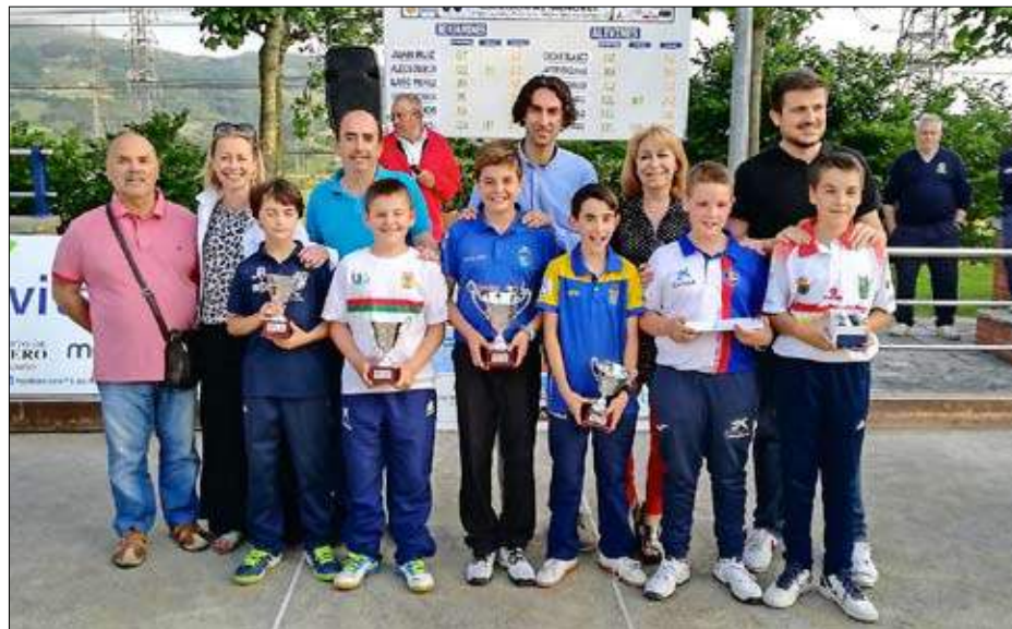
Los mejores alevines en el Concurso San Pedro de Muslera.