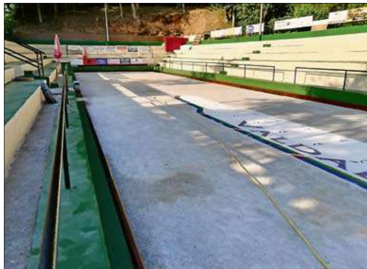
Bolera de La Cocina donde se disputará el Regional.

Con este magnífico cartel ahora solo queda que los aficionados también respondan con su presencia, porque qué mejor manera de