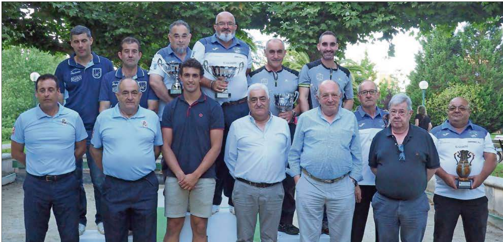
Las cuatro primeras parejas clasificadas, junto a las autoridades y árbitros. / JUAN