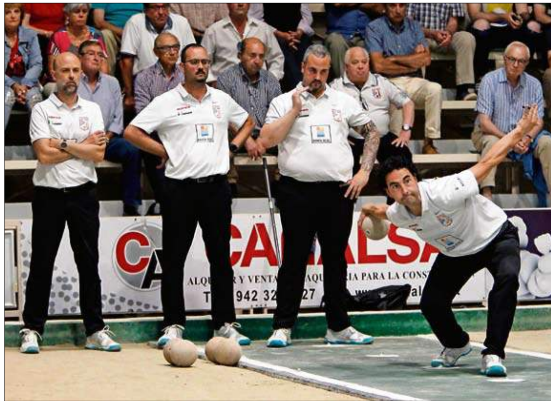
Los jugadores de Roper Bahía Real, en el tiro de El Parque de Maliaño.