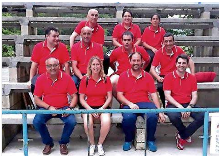
Equipo organizador del Campeonato Regional de peñas por parejas de Primera categoría.

Mereció la pena recuperar una preciosa bolera. Mereció la pena acercarse hasta Oruña para presenciar otro campeonato. Mereció la pena jugarlo y no te digo ganarlo. Mereció la pena el gran esfuerzo del amplio equipo organizador. Y si todo esto fuera tomado como un castigo, que es uno de los significados de la palabra 'pena' según la RAE... ¡Mereció la pena! Seguro.