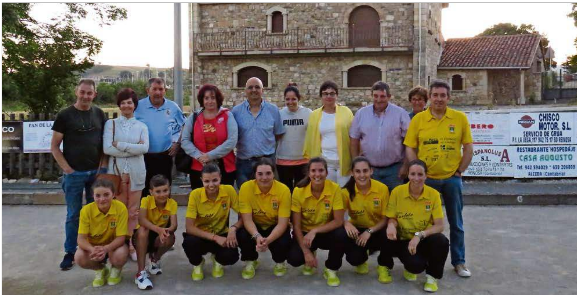
La 'gran familia' de la Peña Campo de Yuso en la bolera de La Población.