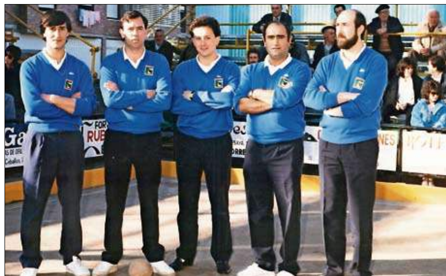
Peña Bolística Construcciones Rotella 1988.