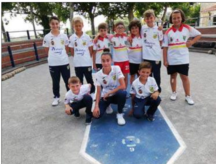
EB Astillero-Guarnizo y EB Sobarzo de la Liga alevín-benjamín.