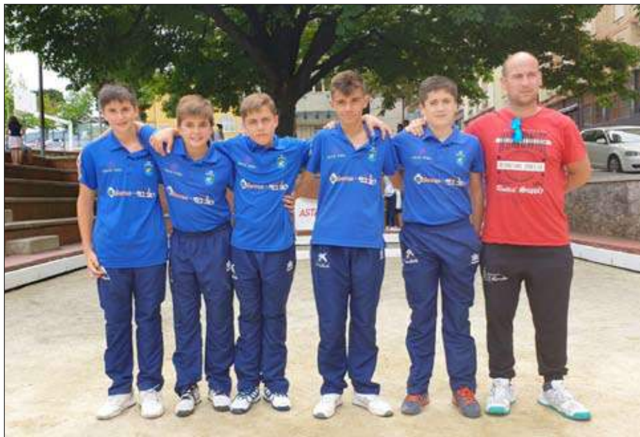
EB Peñacastillo, campeona.