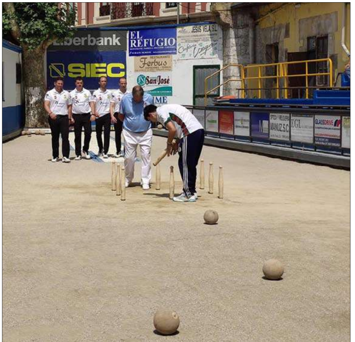
Los jugadores de Los Remedios Vitalitas se dirigen al birle de la Carmelo Sierra.