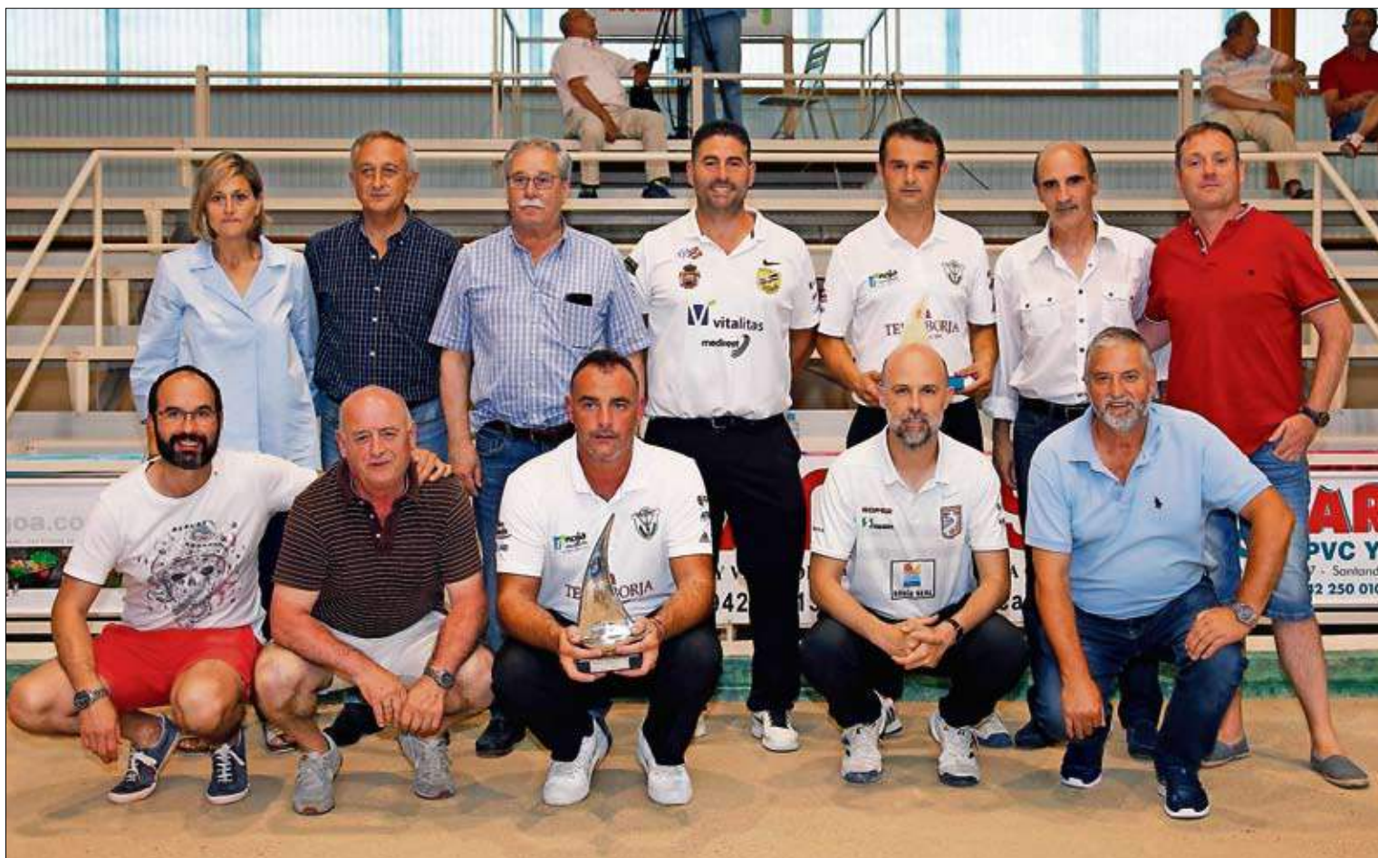
Autoridades, organizadores y jugadores posan para la foto de familia a la finalización del torneo. / JOSÉ RAMÓN