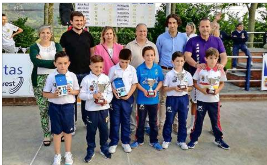
Los mejores benjamines en el Concurso San Pedro de Muslera.