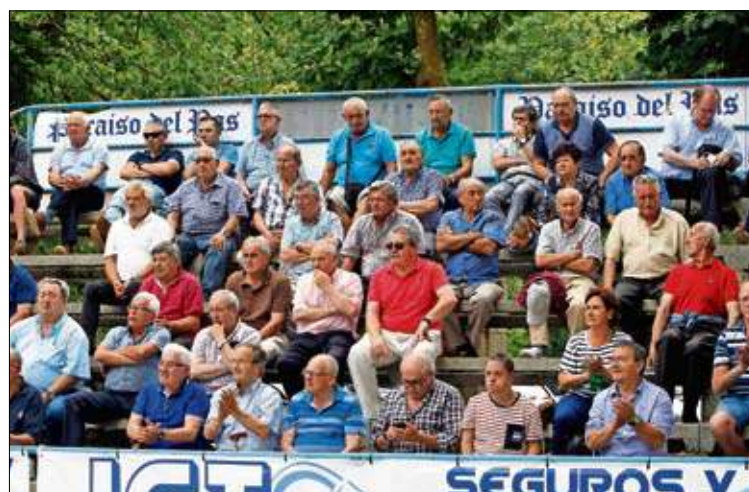
Buena presencia de público en el Paraíso del Pas.