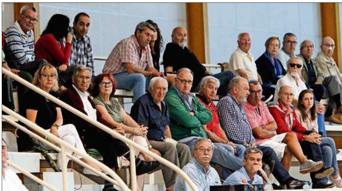
Buena presencia de público en la bolera camarguesa.