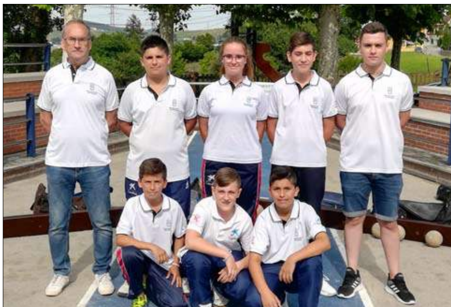
EB Piélagos. / JOSÉ RAMÓN