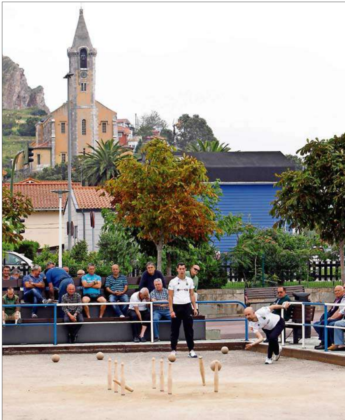
La coqueta bolera El Bosque de Camarreal será escenario hoy de una bonita competición.

AYUNTAMIENTO DE RIOTUERTO. Los días 3, 4 y 5 de julio, de 16.00 a 21.00 horas, se realizarán las tiradas de clasificación para el Concurso Ayuntamiento de Riotuerto, puntuable para el Circuito femenino, que organiza la Peña Riotuerto Hotel Villa Pasiega en la bolera La Encina de La Cavada. La final (sin semifinales) está prevista para el 1 de septiembre. Cuantía en premios: 550 euros. Teléfono: 942 522 439.