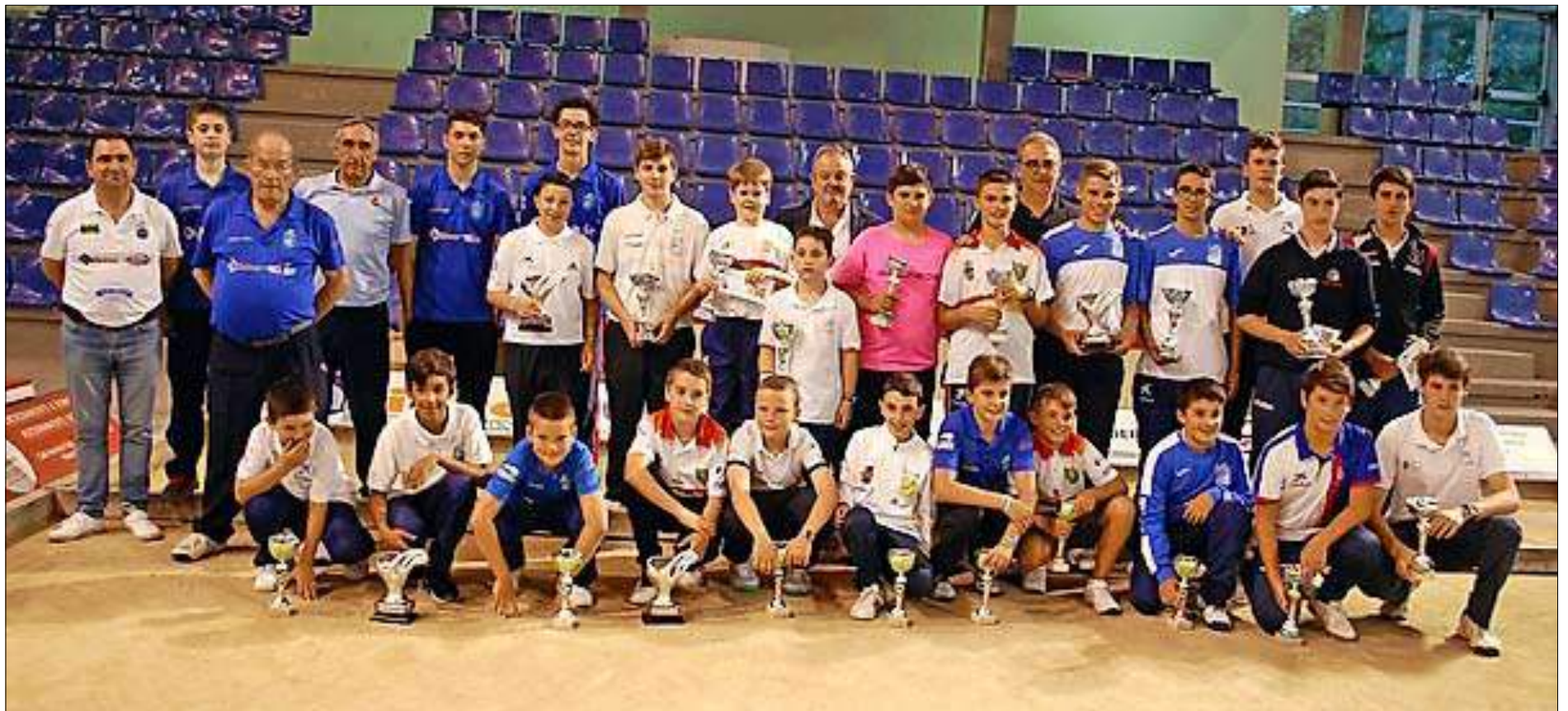
Participantes, organizadores, árbitro y autoridades tras la entrega de premios del Concurso Comercial Anievas.