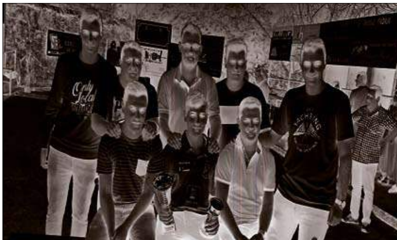
El ganador con los integrantes de la Peña Club Bansander.