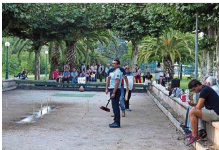
Buen ambiente en la bolera La Barquera de Campuzano.