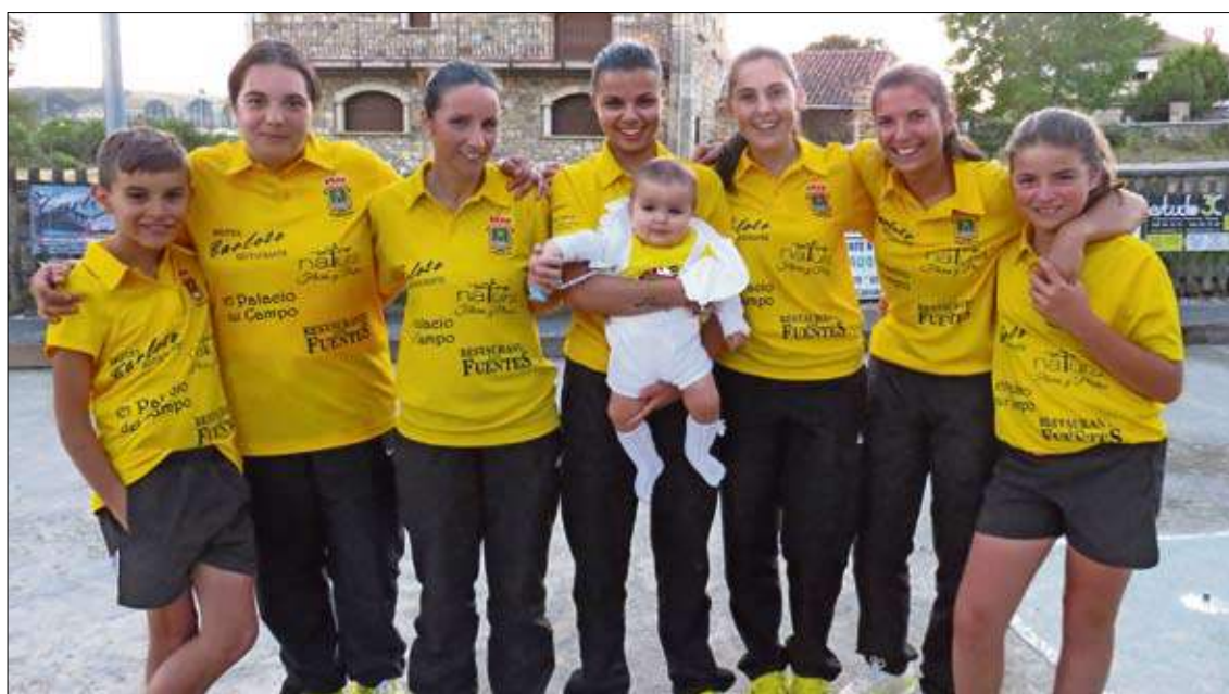
Las flamantes campeonas, junto a sus armadores.