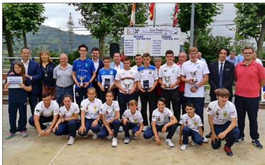
Los mejores cadetes en el Concurso San Pedro de Muslera.

en un concurso y de Eusebio Iturbe, con 294 bolos, sumando la semifinal y final.