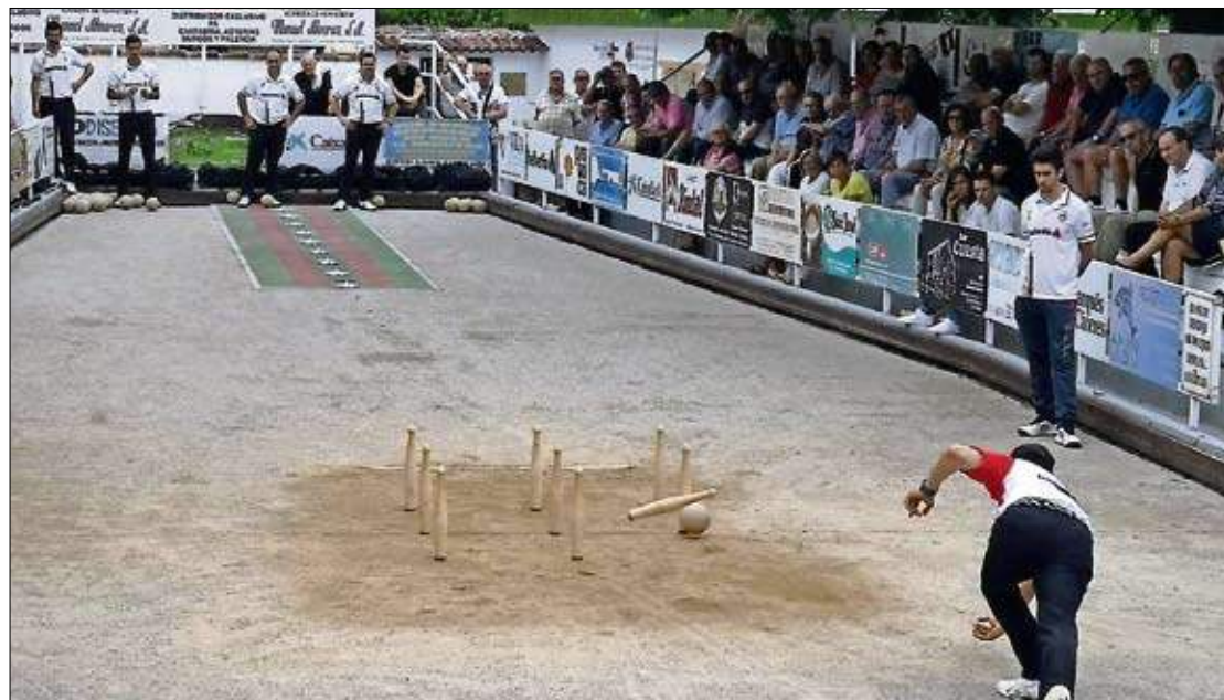
Riotuerto birlando en la Agustín Sampedro de Torres.