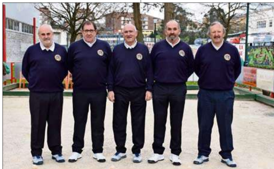
Peña Bolística Torrelavega Siec de veteranos 2018.