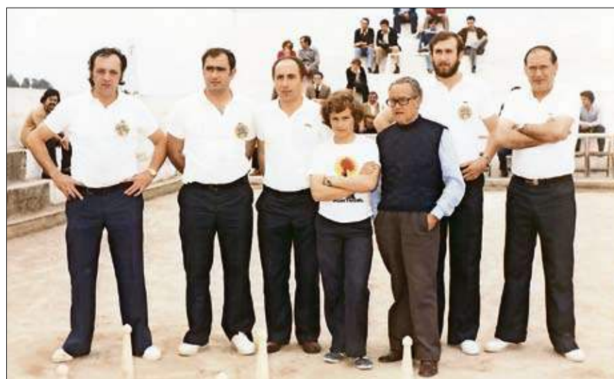
Peña Bolística Torrelavega 1980.

Yo, con el debido respeto a los que esto lean, porque sé a que a ti te gustaría, también quiero terminar cantando, la canción del concejo de Parres... cuando tus padres me riñaaaaaaaan- y así alargando las notas musicales durante casi treinta interminables segundos y cambiando un poco la letra... aaaaaaaaan, no dejaremos de quererte.