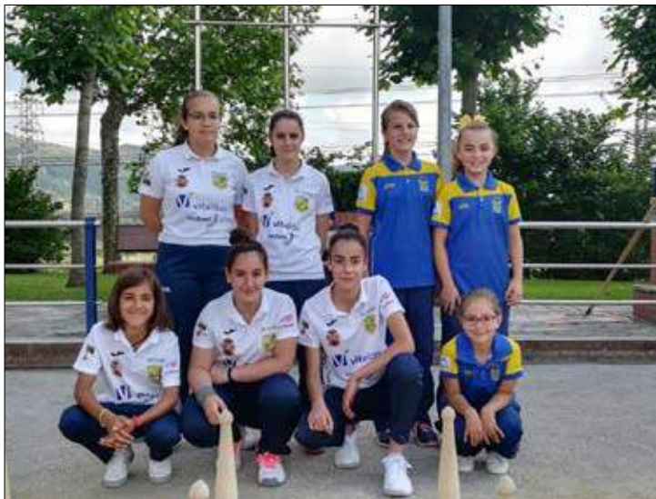
Féminas de las Escuelas Astillero-Guarnizo y Entrambasaguas.

«Si estás deseando que los más pequeños de la casa aprendan a jugar a los bolos, estás de suerte», dice el comunicado del Ayuntamiento de Suances. Y es que la bolera La Quintana de Cortiguera (ubicada junto a la Posada Santa Ana) acoge, durante toda la semana, un Taller Infantil de Bolos. Así, de lunes a jueves, en horario de 11.00 a 13.00 horas, todos los y las chavalas que lo deseen, a partir de los 6 años de edad, podrán aprender a jugar a este tradicional deporte cántabro de la mano de los jugadores de la Peña Bolística de Cortiguera. La actividad es totalmente gratuita y abierta a la participación de todo el que lo desee, sin necesidad de inscribirse previamente. «Solo es necesario tener ganas de disfrutar y pasar una mañana divertida». Cabe recordar que la iniciativa está organizada por la Junta Vecinal de Cortiguera y cuenta con la colaboración de la Peña Bolística de Cortiguera y la Concejalía de Deportes del Ayuntamiento de Suances.