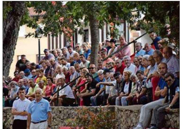
Lleno en La Robleada de Puente San Miguel.