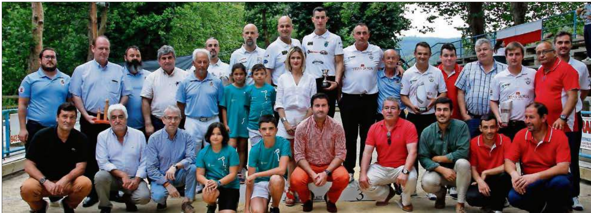
Jugadores, autoridades, organizadores y árbitros tras la entrega de premios.

es difícil pensar que al de Villanueva de la Peña se le había olvidado jugar a los bolos. Ayer era otro día y bien que lo demostró, tanto él como el santanderino realizaron una gran semifinal consiguiendo hasta ese momento el mejor registro del campeonato con 277 bolos, que sumados a los 506 anteriores totalizaban 783 para meter presión a los dos que venían por detrás.