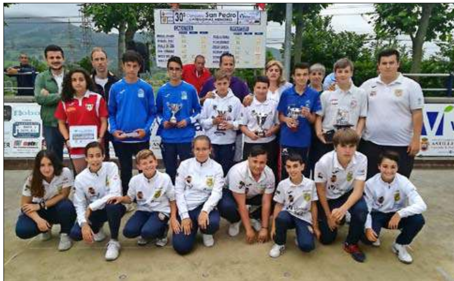
Los mejores infantiles en el Concurso San Pedro de Muslera.