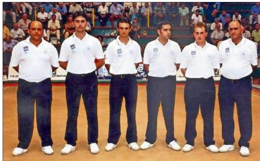
Peña Bolística Renedo 1999.