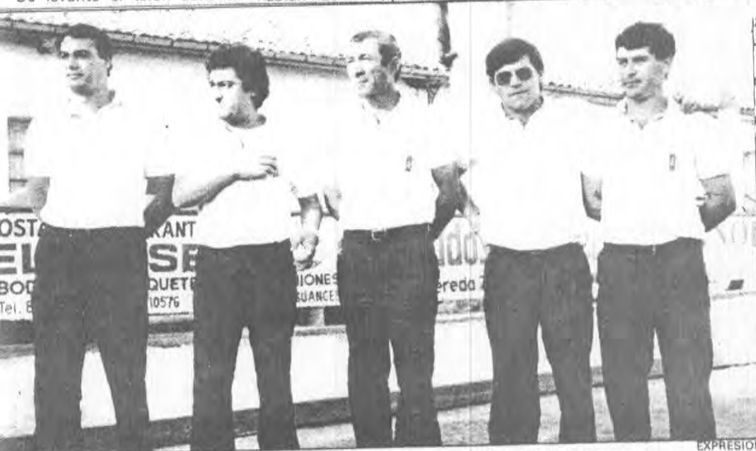
Equipo U. D. Barreda, que recibe esta tarde La Carmencita en el Verdoso.

Se levantó el telón bolístico habian hecho 45, y el tercero, por