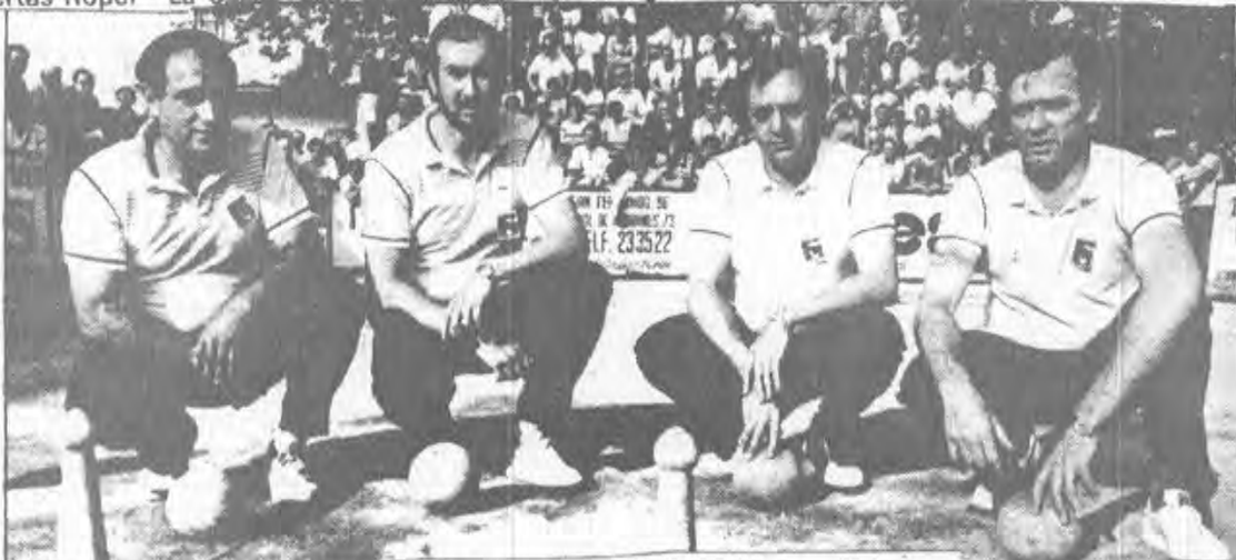
El campeonato en Potes

que pueden estar implicados los jugadores que pertenecen a los citados clubs, determinando que dado que las competiciones de la Federación Española adquiere carácter individual y competitivo a nivel de club, la personalidad de ambas competiciones separa la propia responsabilidad del jugador y en el caso del expediente que nos referimos, tan sólo a éste como persona jurídica. En las competiciones de clubs, si en ningún caso exista responsabilidad subsidiaria por parte del jugador como persona física individual.