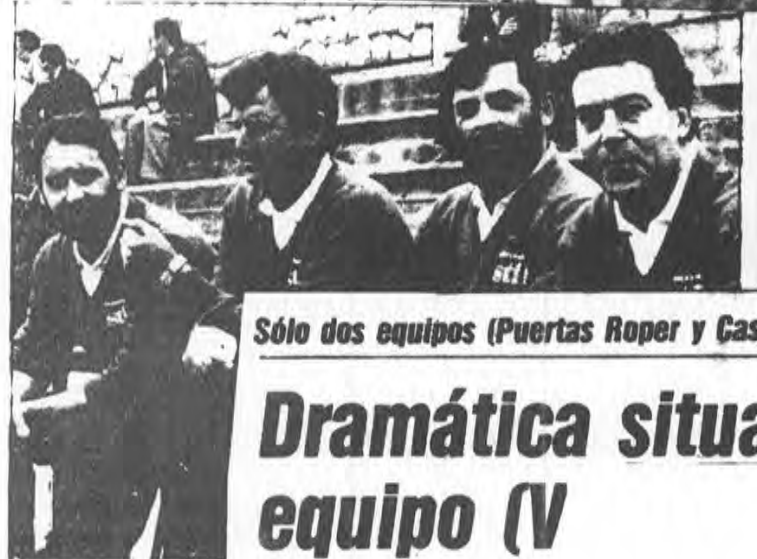
La formación de Peñacas está a su favor