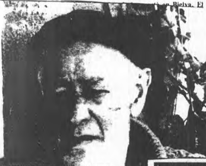
En Bielva. El Ayunta- Bielva. genda- na co- como de, en ARIO va el y, aun a infor su inte niciarán siéndose