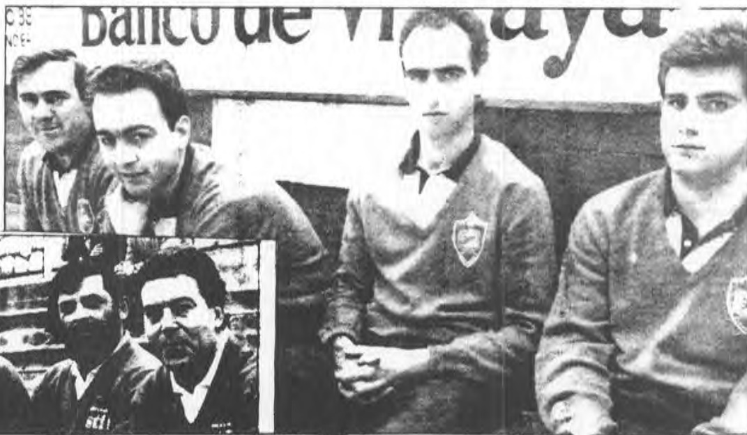
Sólo dos equipos (Puertas Roper y Casa Sampedro), clasificados en el A-1

Los peñacastillenses habían logrado adelantarse en el marcador con un esperanzador 3-2 mandando a ganar en el último