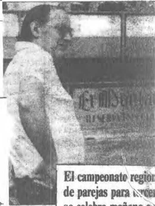
El campeonato regional de parejas para cadetes se celebra mañana en Langre

en su particular lucha frente al «ro- tella» Agustín, dominándole por sólo dos bolos. «Chuchi» hizo 114 «Chuchi», con 115, en esta vuelta sumaba 344 bolos.