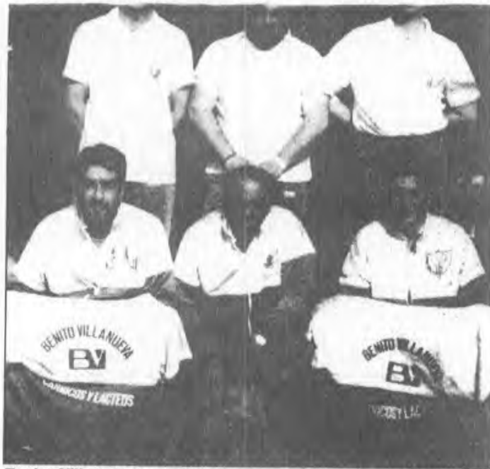
Equipo Villaverde de pasabolo.