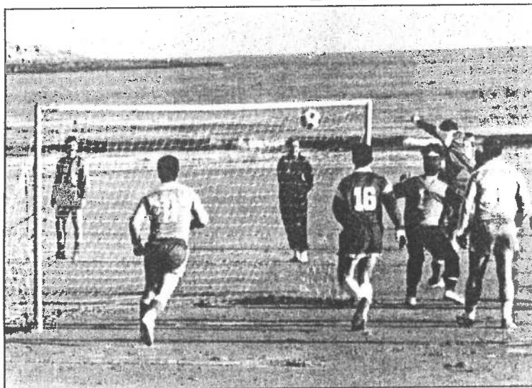
El mar sirve de fondo a los deportistas del fútbol playero.

El Trofeo Ciudad de Santander se juega por un sistema de liga a una sola vuelta, por lo que el