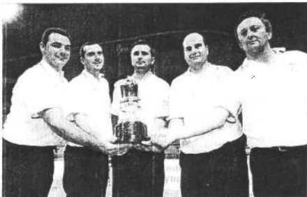
Peña Bolística Hermanos Borbolla.