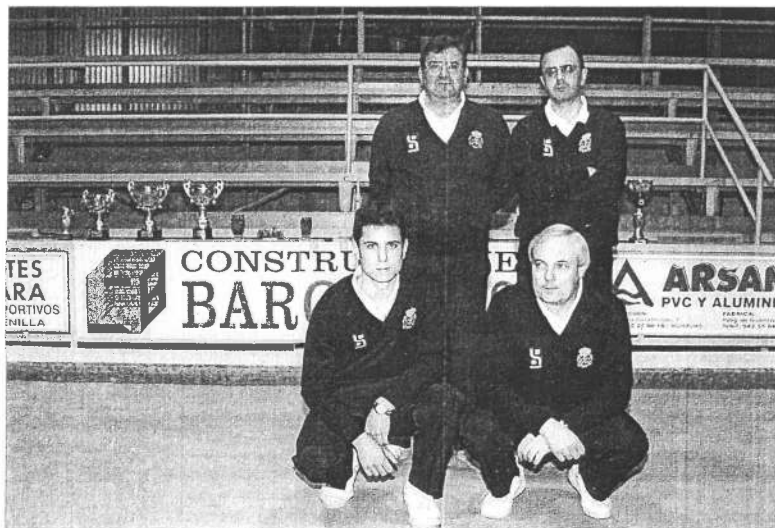
Equipo Gajano, ganador de la Liga del Ayuntamiento de Camargo.

clasifican dos parejas y cuatro individuales, será el martes, día 21, a las 17.30 horas.