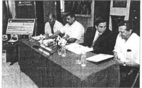
Presentación del Torneo Banco Santander de bolos.