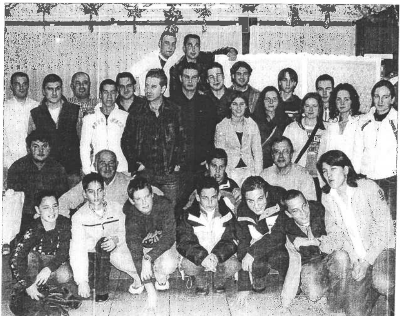
Jugadores y directivos de la Peña Bolística Sobarzo, en la cena fin de temporada.