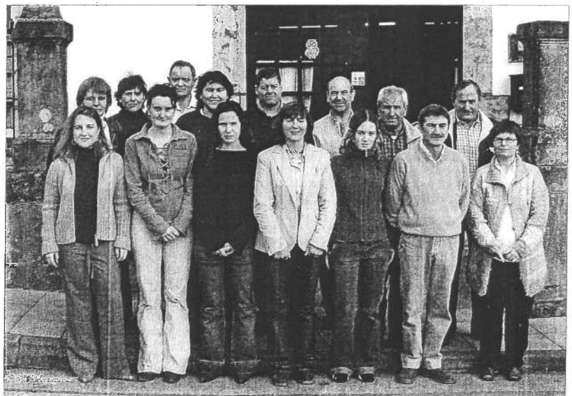
Jugadores y miembros de la directiva de la Asociación Zurdo de Bielva en una reunión celebrada este mismo año 2004. TOPI

ron su voluntad y compromiso firmes de mantener la trayectoria deportiva, el espíritu de convivencia y la proyección social que tradicionalmente ha caracterizado a la Peña Bolística Zurdo de Bielva Funditubo. Por último, hubo un recuerdo especial para