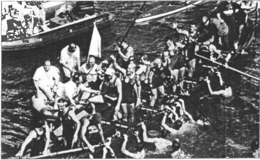
Tripulación de la 'San José XIII' de Astillero.