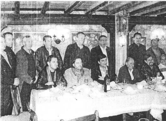
Directivos y jugadores de la Peña La Rasilla de Los Corrales de Buelna.

Antes de la final, Alemania y Nueva Zelanda se medirán por evitar el sexto y último puesto del torneo, que relega a jugar una competición de menor categoría ( Champions Challenge ), y después Pakistán e India harán llenarse las gradas del estadio nacional de Lahore (70.000 espectadores) en la pugna por el tercer puesto. El colofón será la final en la que Holanda, subcampeón olímpico, intentará revalidar el título logrado hace un año.