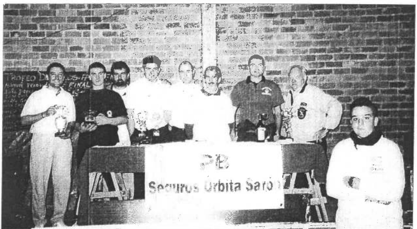
Finalistas y organizadores del Trofeo Seguros Orbita del ramo del transporte para federados.

Como novedad de este torneo, la organización decidió premiar con tabletas de turrón las bolas