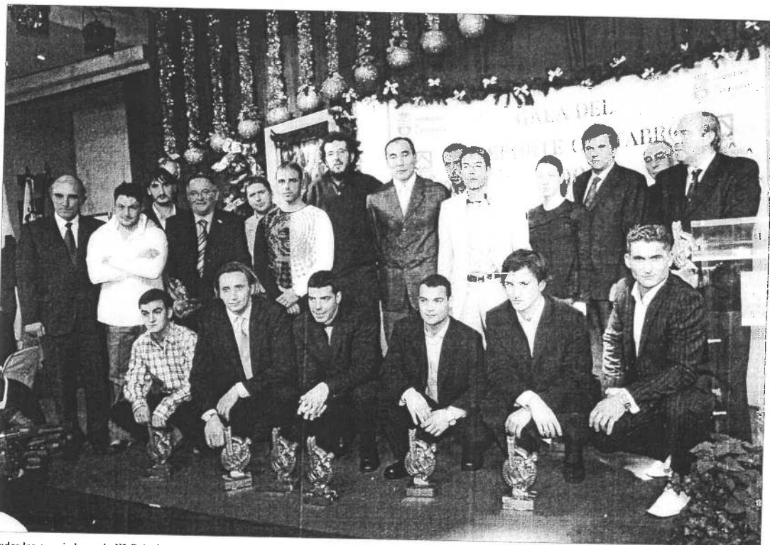
Todos los premiados en la XI Gala del Deporte Cántabro 2004, con sus respectivos trofeos.

Otra de las novedades y sorpresas de la noche fue la presentación de los galardonados, que hicieron su aparición a través del pasillo formado por la Ban-