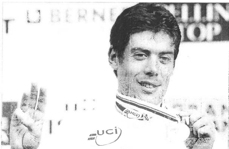
El tricampeón del mundo de ciclismo, Oscar Freire, recibirá hoy el premio al Mejor Deportista Internacional de 2004.