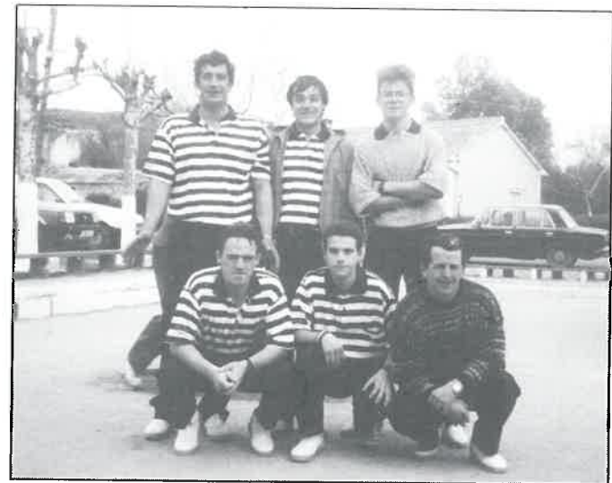
PEÑA BOLISTICA STOS. MARTIRES