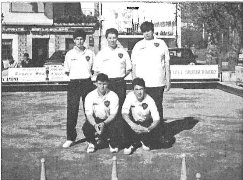
Campeón Liga Regional - Ascenso a Segunda Especial