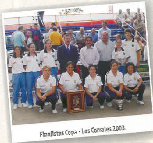
Finalistas Copa - Los Corrales 2003.