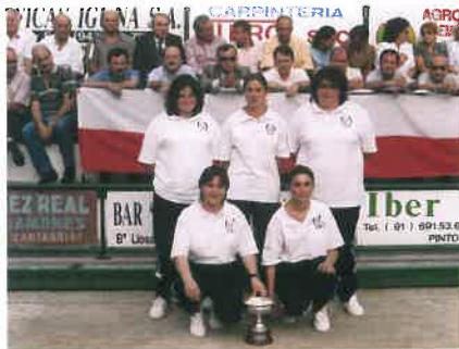
P.B. Mazcuerras 1998.

La competición de Copa, torneo del K.O., se puso en marcha en 1998 siendo esa primera edición ganada por Mazcuerras, que ese año hizo doblete, al ganar a Seguros Órbita en la vieja bolera de Renedo.