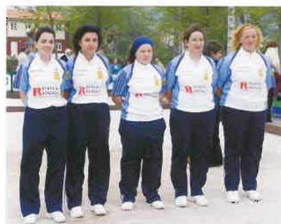
P.B. El Caserío Renero Glez. 2006.