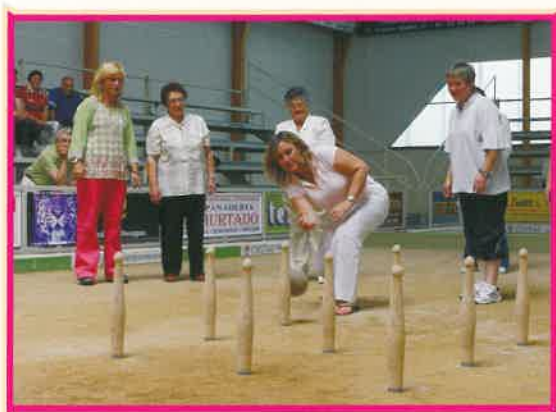
I Jornada "El Parque" Maliaño 2005

Jornadas de fomento de la práctica de los bolos entre las niñas de Cantabria