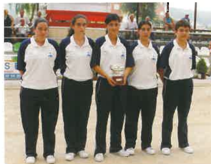
P.B. Calixto García.

En esta competición parece más vulnerable el equipo de El Caserío ya que ha ganado 4 de las 9 ediciones, perdiendo las dos últimas finales, en Suances y Renedo, frente al joven equipo de Roiz, que completó una excelente temporada con el subcampeonato de liga.