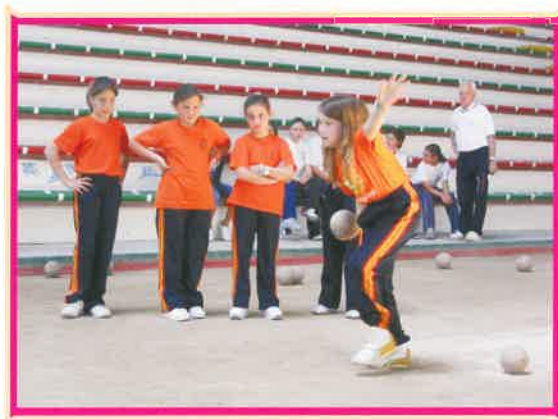
II Jornada "Severino Prieto" Torrelavega 2006