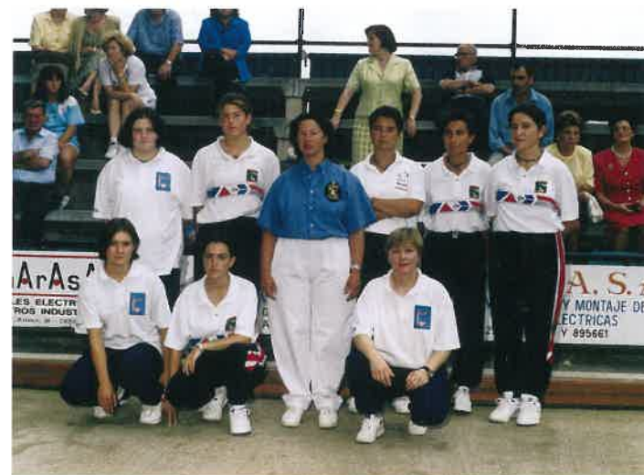
Finalistas y árbitro del Primer Campeonato Regional. Torrelavega 1997.

La categoría femenina goza de buena salud pero debemos seguir cuidándola. Se mantiene el número de equipos y mejora el de competiciones, pero preocupa la escasa incorporación de niñas a las Escuelas de Bolos. Afortunadamente tenemos un grupo de chicas muy jóvenes que año tras año vienen pegando fuerte y buena prueba de ello es que este año el Campeonato Regional y el Circuito Regional han sido ganados por dos chicas muy jóvenes. También aquí está en marcha el relevo generacional. En las páginas siguiente encontrarás, a modo de resumen, la actividad generada en estos primeros diez años de competición.