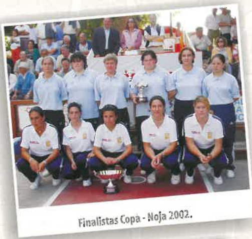
Finalistas Copa - Noja 2002.