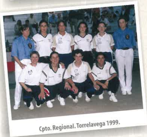
Cpto. Regional. Torrelavega 1999.