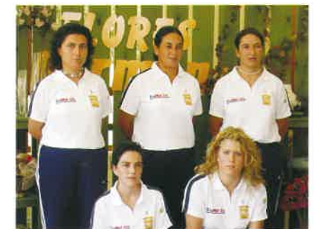
P.B. El Caserío 2003