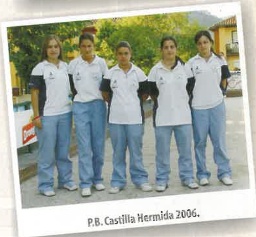
P.B. Castilla Hermida 2006.