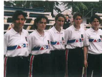
P.B. Construcciones Rotella 1997