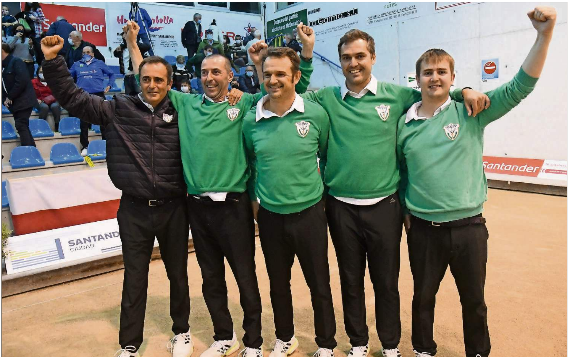
Los jugadores de Hermanos Borbolla Villa de Noja celebrando la victoria.