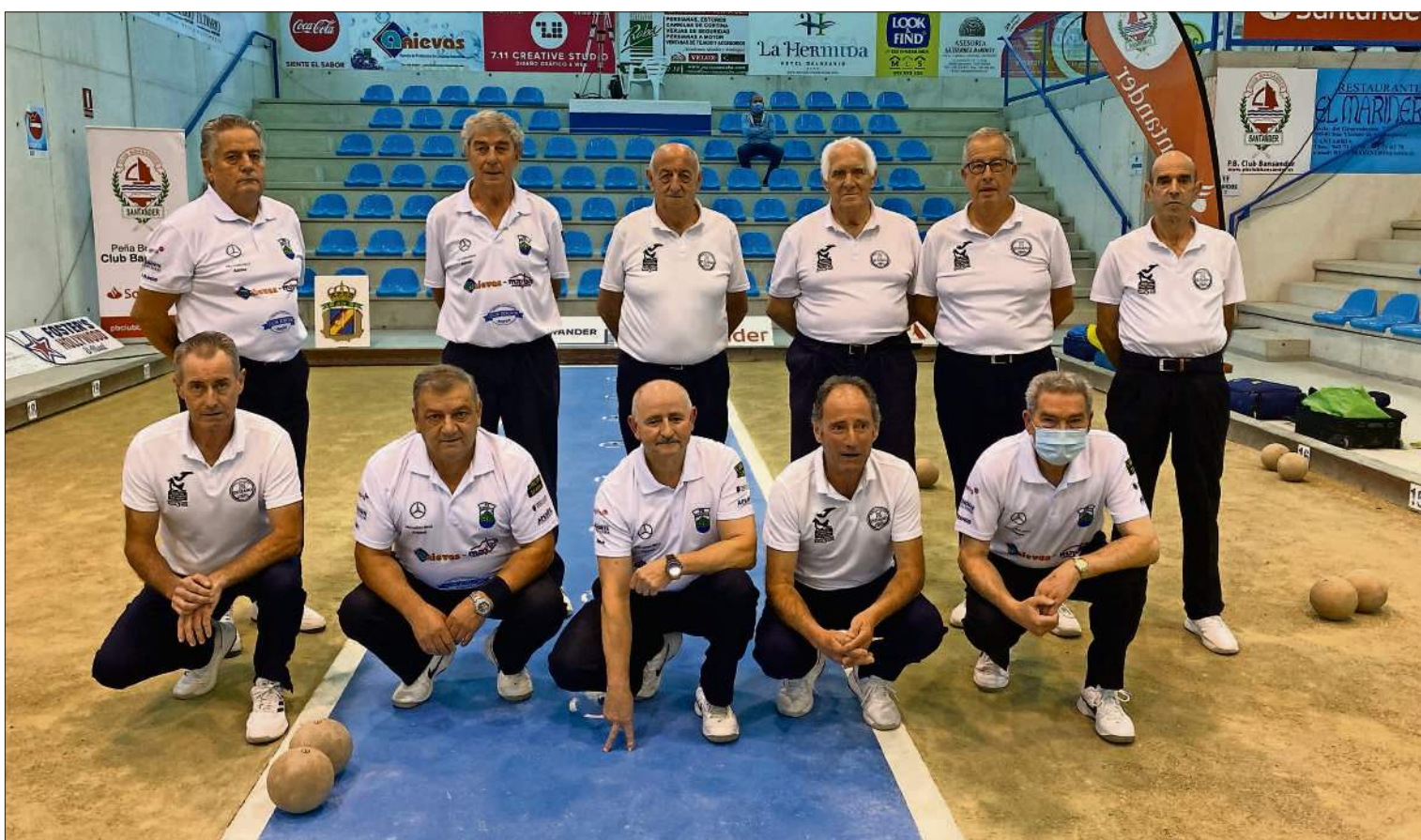
Los jugadores de Quijano y Peñacastillo posan antes del inicio de la final ayer en Cueto.