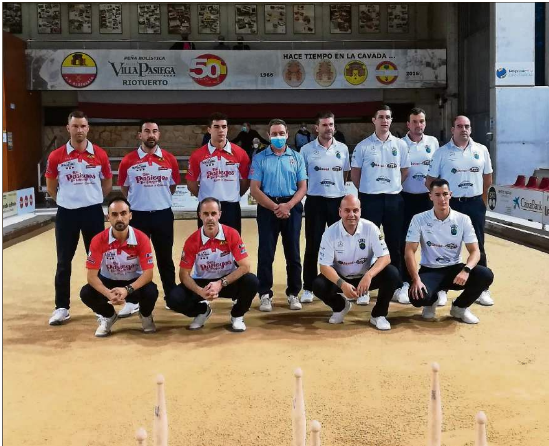
Los jugadores de Riouerto y Peñacastillo posan antes del inicio del encuentro en La Cavada.