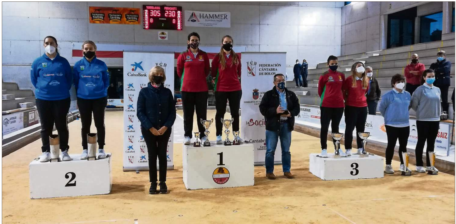
Podio del Campeonato Regional Femenino de peñas por parejas.