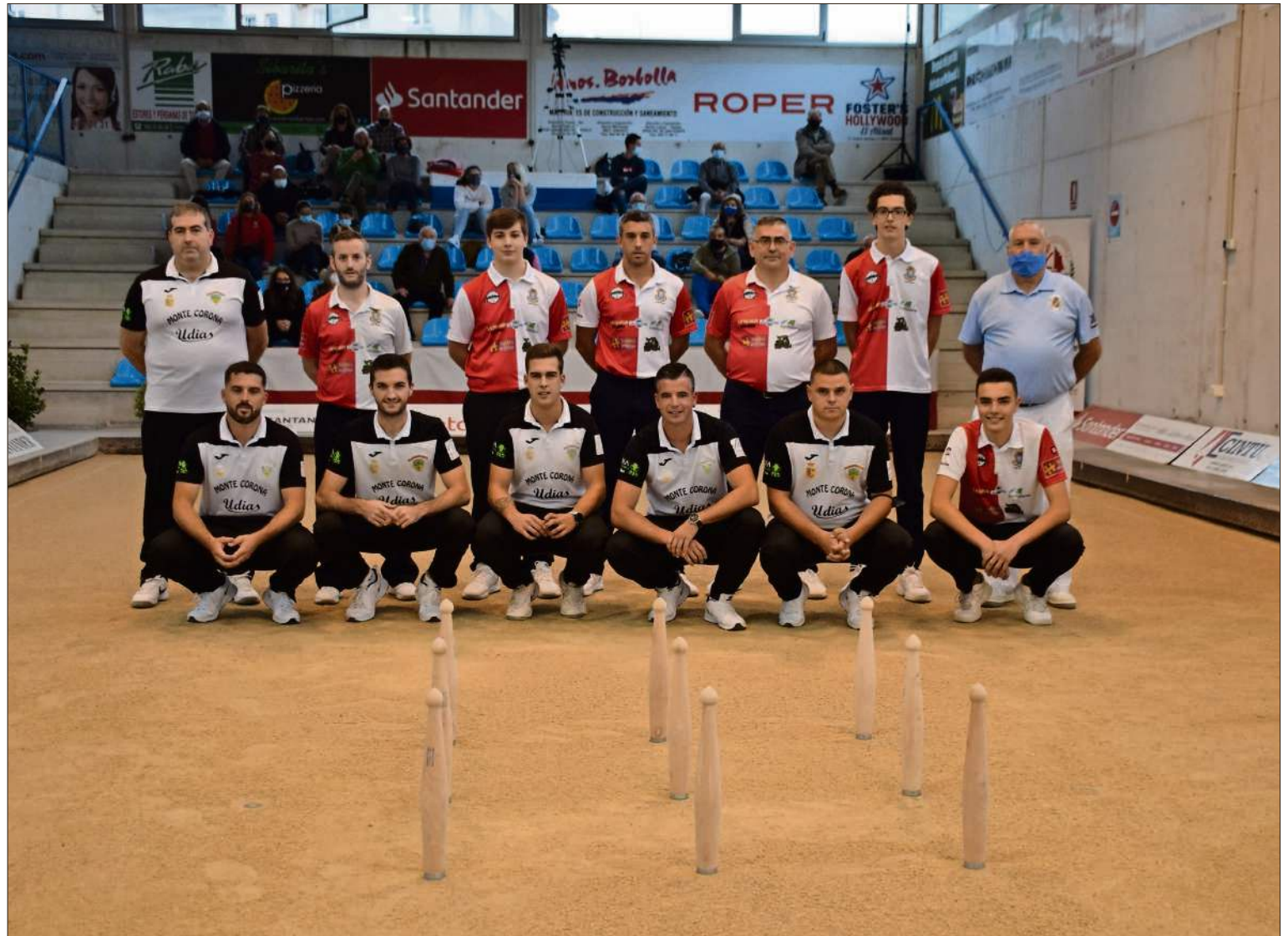
Los dos equipos posaron al inicio del partido.

de Noja, también en el chico extra, superó a Comillas y en cuarto venció por 4-0 a La Rasilla. Curiosamente, los dos equipos que estaban exentos de la primera ronda de esta Copa Apebol-Trofeo Hipercor al ser los dos primeros clasificados en la Liga 2019, son los que hoy lucharán por el título.