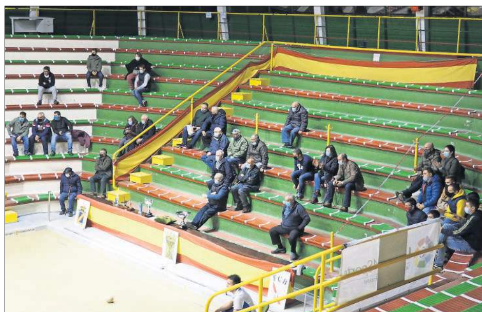
Buen ambiente en la Severino Prieto de Torrelavega. / JUAN