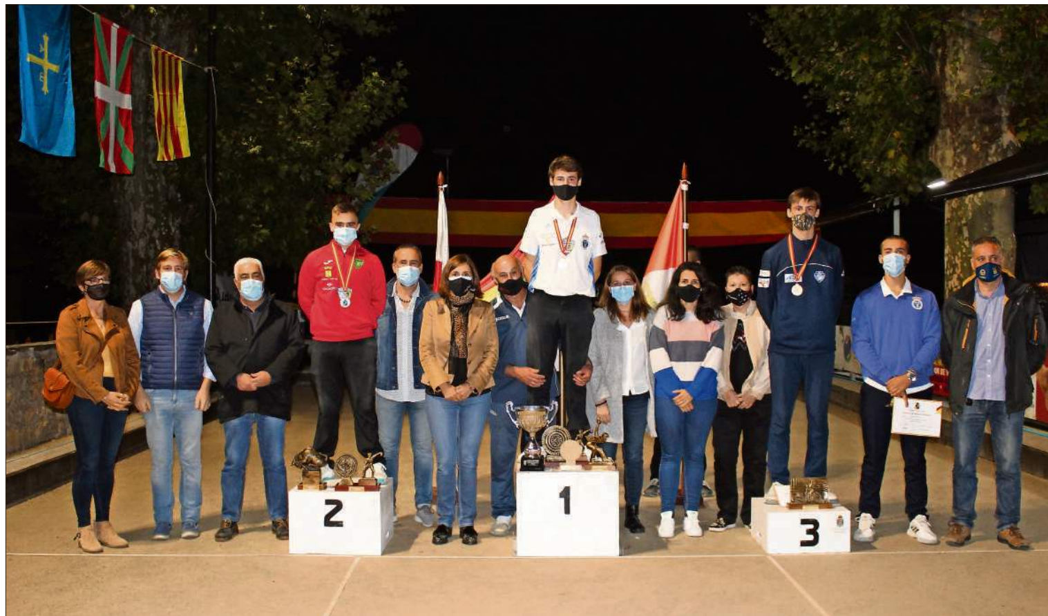
Organizadores y autoridades posan con el podio del Campeonato de España Juvenil de bolo palma.