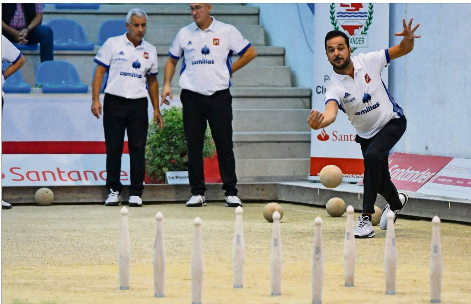
Los jugadores de Comillas durante un encuentro esta temporada.