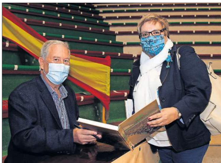
El autor tras dedicar el libro a Merche Viota.