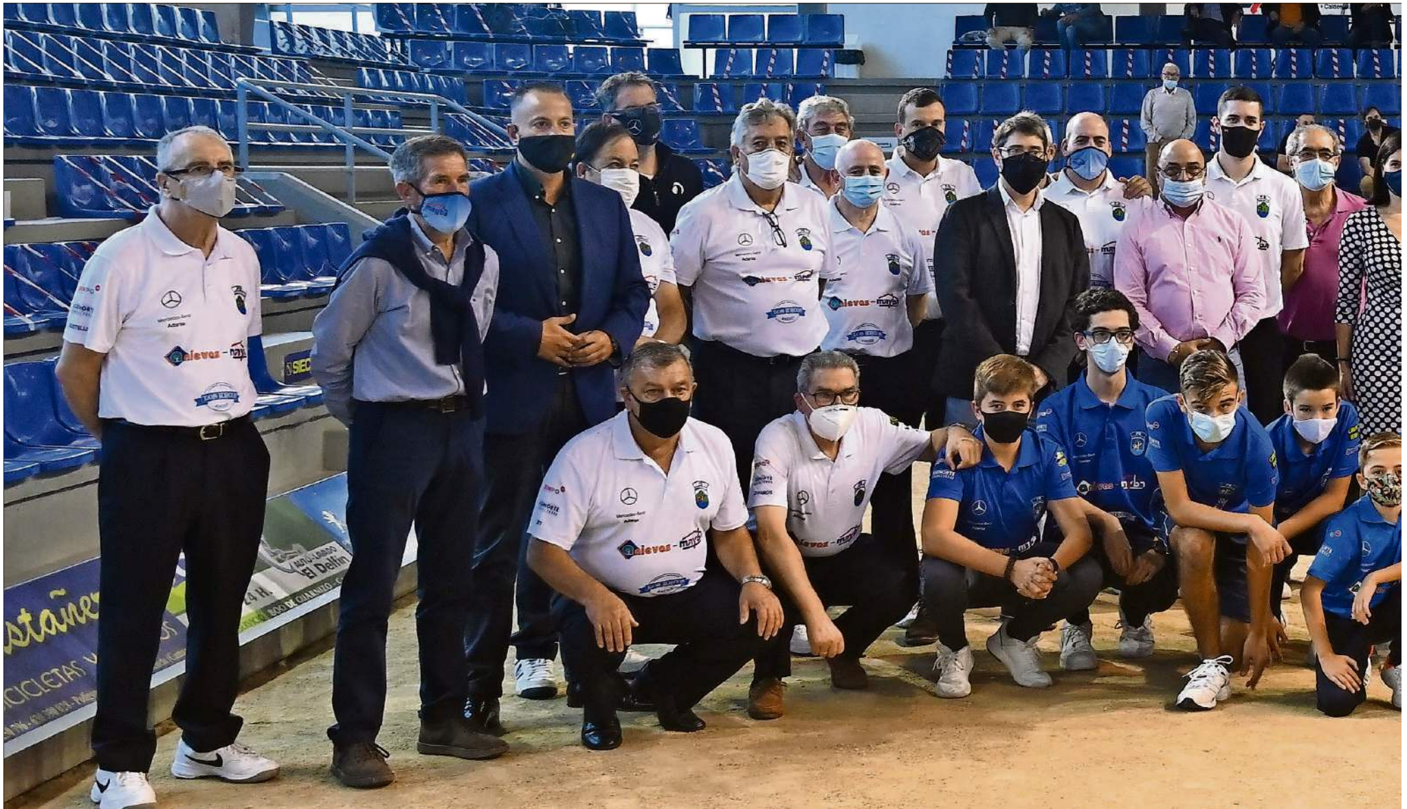
Foto de familia de los dirigentes de Peñacastillo, jugadores y técnicos junto a la alcaldesa de Santander, Gema Igual.