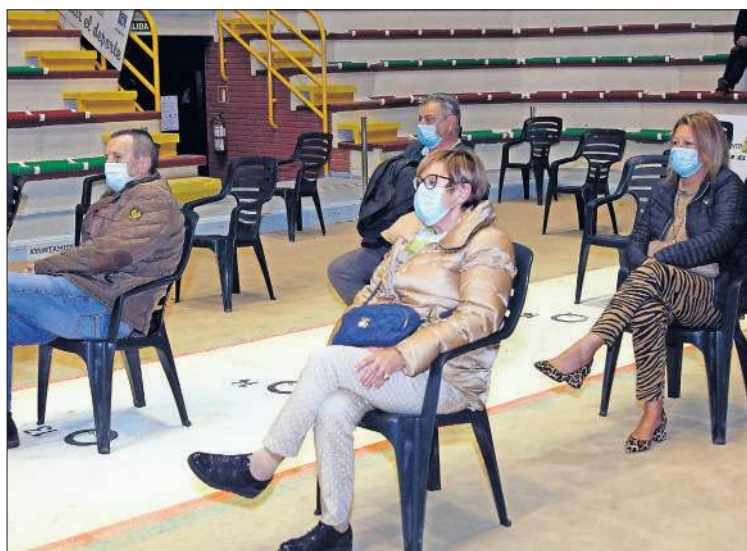
Los hijos de Marcorre también acudieron al acto. / VÍCTOR