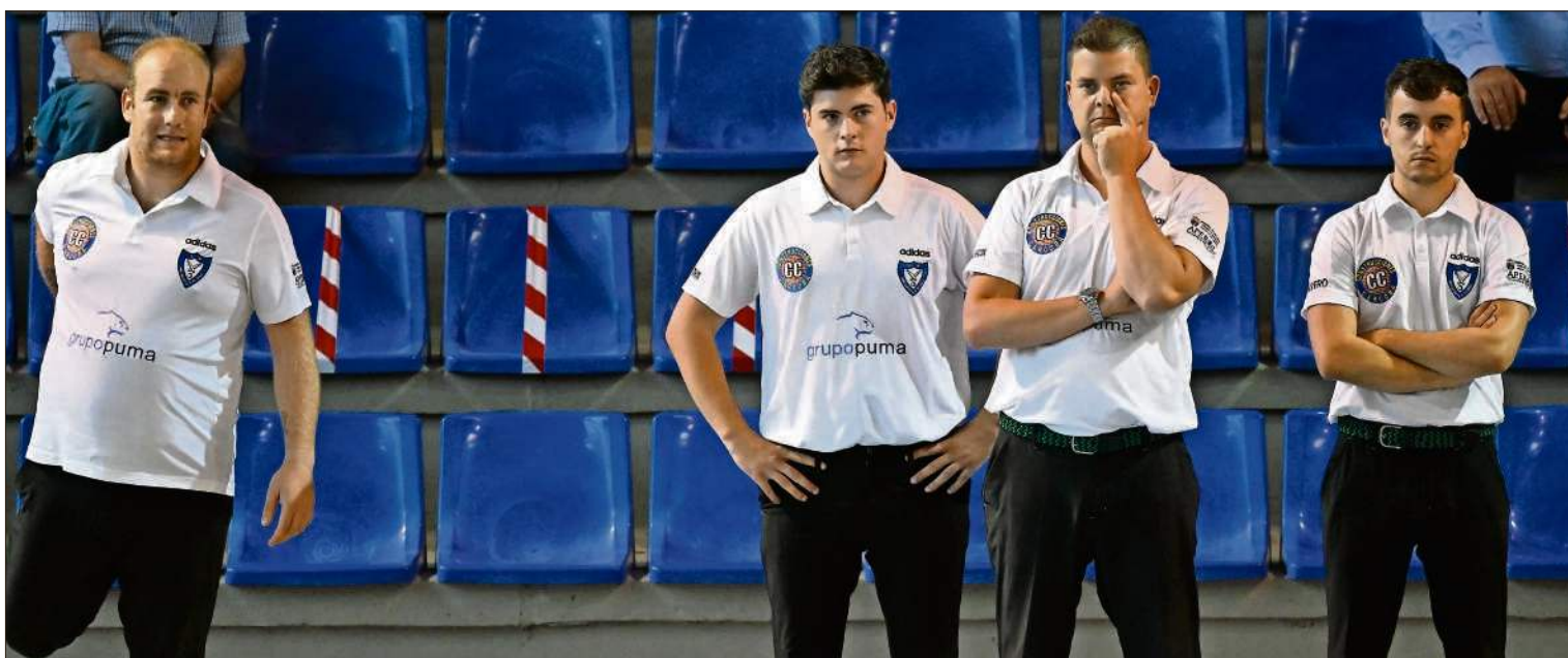
Los jugadores de Ribamontán al Mar empataron con los de Peñacastillo.