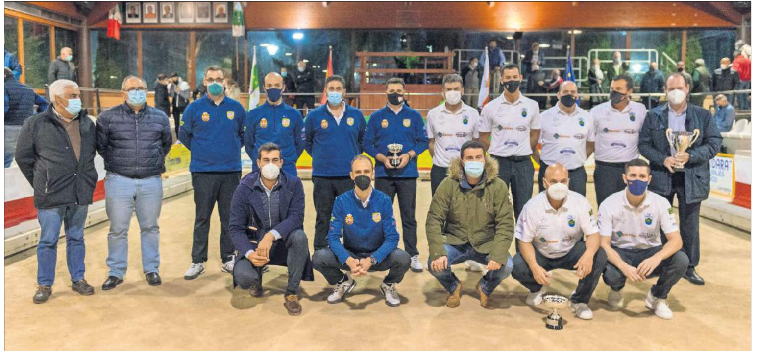
Los dos equipos, junto a sus presidentes y autoridades tras la entrega de premios.