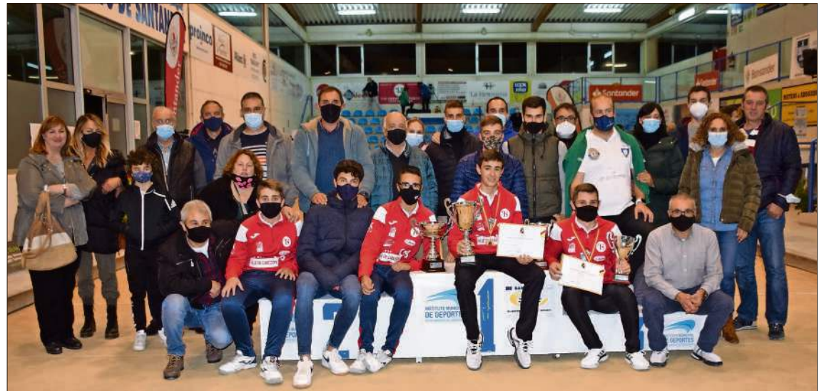
Jugadores y aficionados de Cabezón de la Sal.

ELECCIONES A LA ASAMBLEA DE LA FEDERACIÓN ESPAÑOLA. Cantabria contará con 18 votos en la Asamblea General de la Federación Española, que elegirá presidente en su primera reunión el sábado 31 de octubre en Madrid. Mañana martes 6 de octubre se abre el plazo de presentación de candidatos a presidente, hasta el día 14.