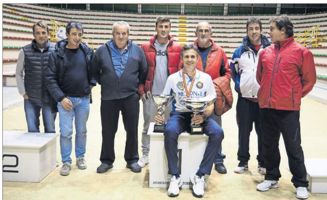
El flamante campeón estuvo acompañado de sus compañeros y directivos de la Peña Calderón.