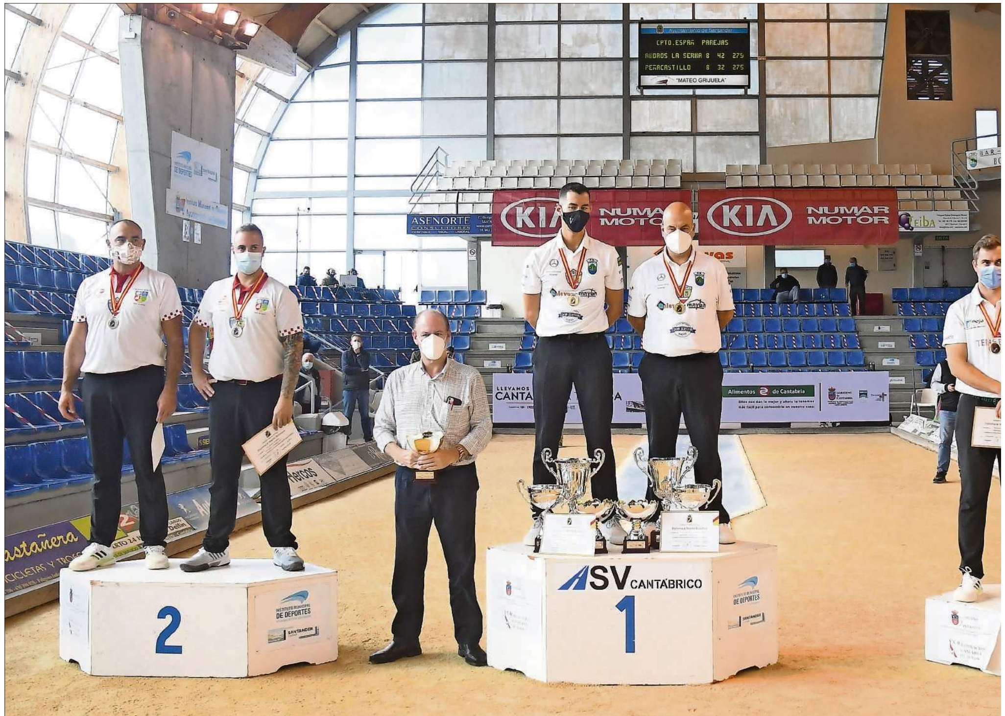
Podio final del Campeonato de España de peñas por parejas. / HARDY