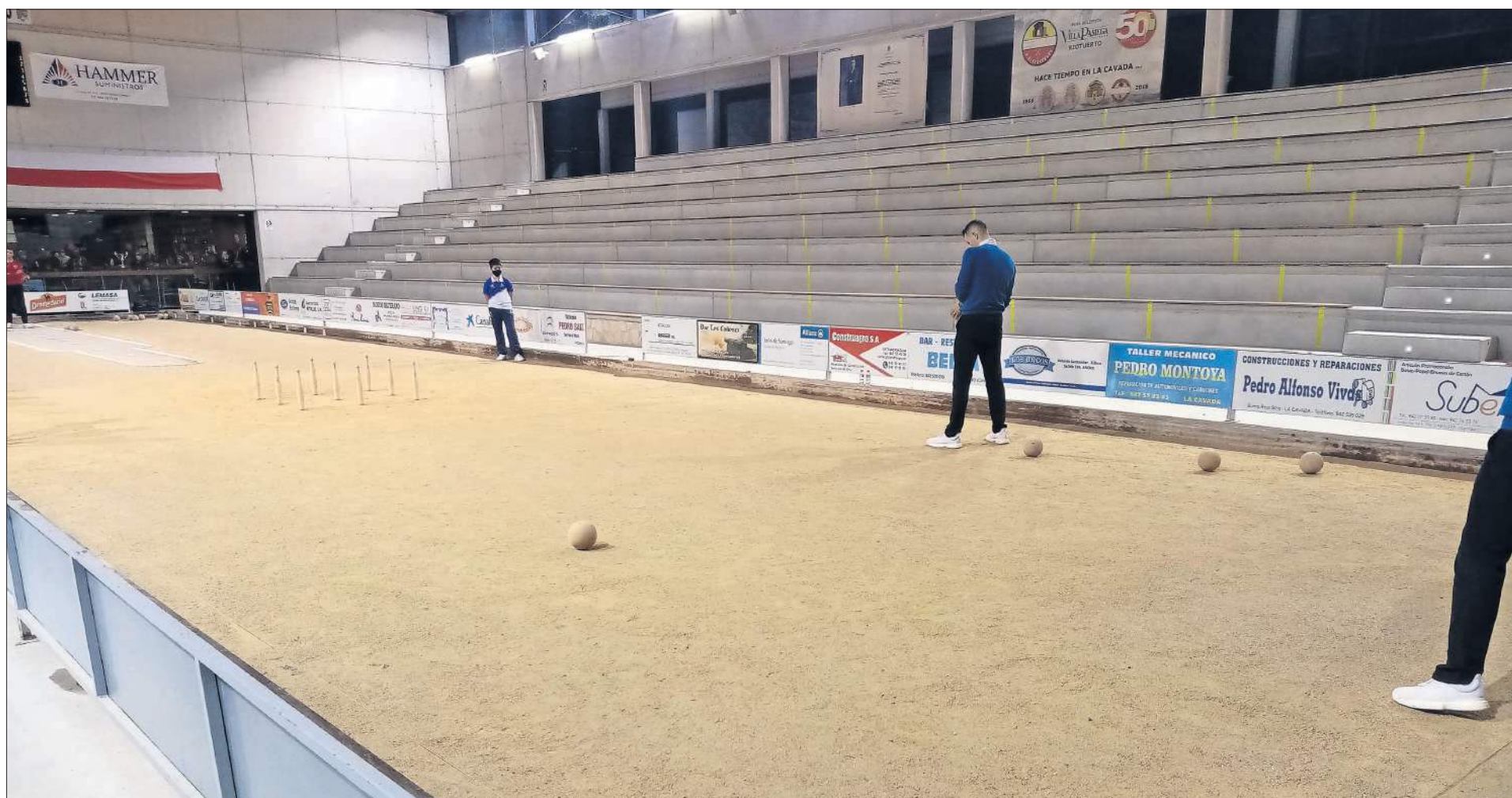
Las gradas de la bolera La Encina de La Cavada, ayer completamente vacías durante el partido entre Riotuerto y Peñacastillo.