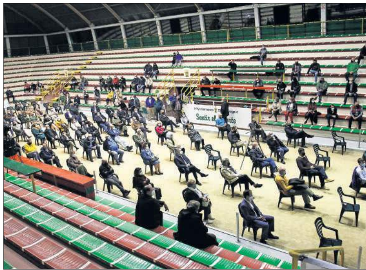
La bolera Severino Prieto acogió la presentación.