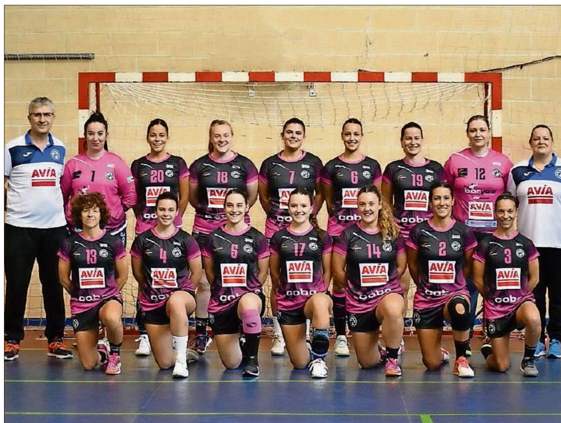
Miembros del club camargués.