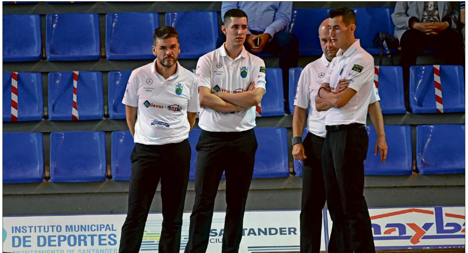
Los jugadores de Peñacastillo durante un encuentro esta temporada.

Riotuerto Sobaos Los Pasiegos cayó derrotado en su bolera de La Encina de La Cavada a manos de Sobarzo que se llevó el triunfo por 2-4 tras un intenso duelo que duró dos horas. Como nota curiosa, el partido de La Cavada entre Riotuerto Sobaos Los Pasiegos y Sobarzo ha empezado con 17 minutos de regreso por un contratiempo del árbitro principal. El encuentro comenzó con el arbitro auxiliar, Alfredo Riancho sobre el cutío, pero tras la jugada de tiro, Santos Muriedas tomó la posición para la que estaba designado.