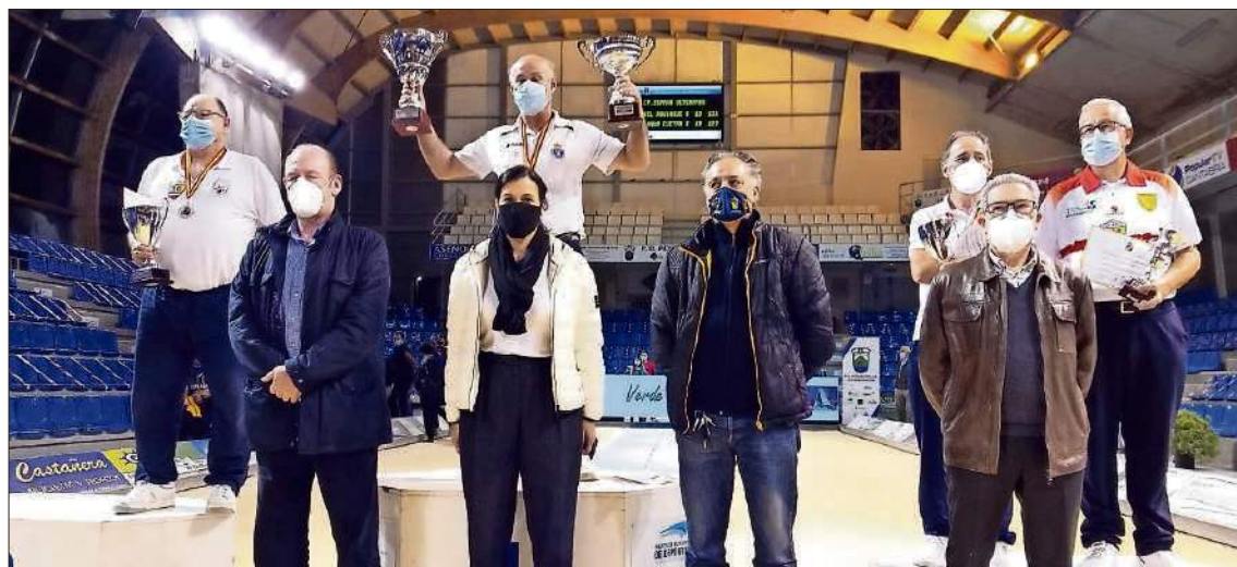
Podio del Campeonato de España de Veteranos junto a autoridades y organizadores.