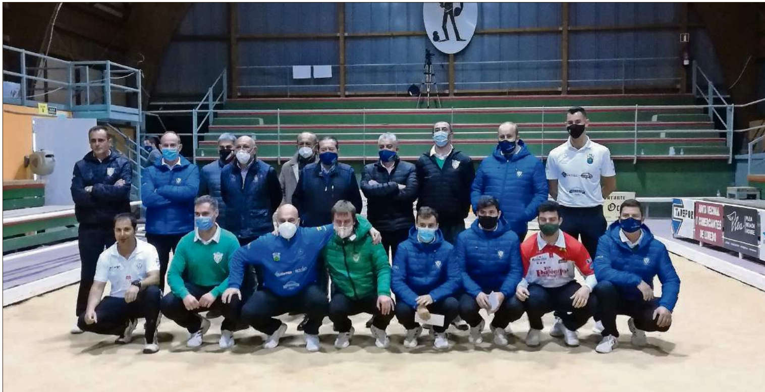
Los jugadores participantes en el torneo posan junto a los organizadores.