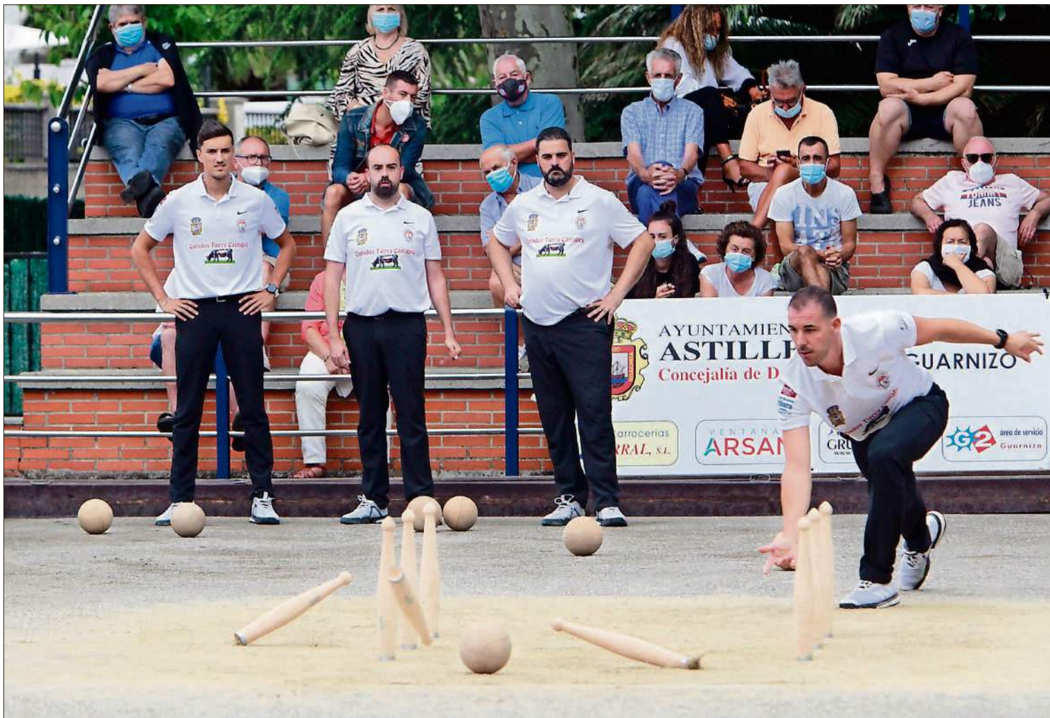
San Jorge juega hoy ante Hermanos Borbolla.