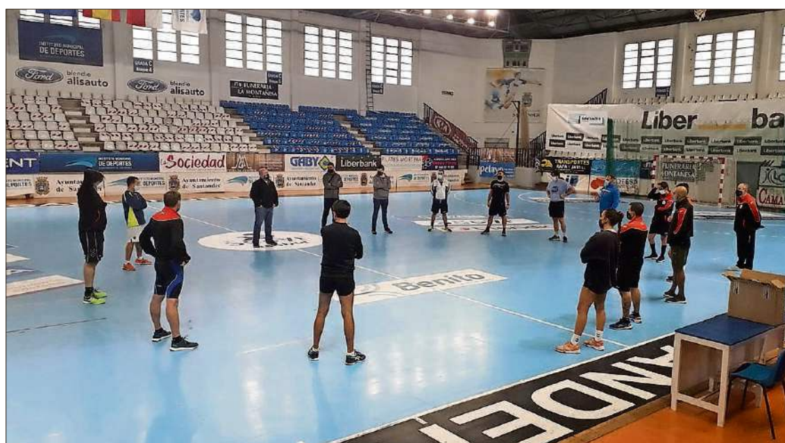
Los colegiados de balonmano durante las pruebas.

La plantilla arbitral que participará en las competiciones territoriales de balonmano durante el nuevo curso 2020/2021 apura su puesta a punto antes del estreno oficial con la realización de las pruebas físicas y los test de reglamento. El pasado domingo se dieron cita en el Pabellón Exterior de La Albericia los colegiados que iniciarán su actividad con el comienzo de los campeonatos territoriales para pasar revisión a las últimas directrices y repartir el material sanitario requerido esta temporada. A pesar de la situación excepcional debido a la pandemia del COVID-19, el Comité Técnico de Árbitros de Cantabria no ha cesado su actividad. El pasado jueves se reunió vía telemática para hacer repaso a la normativa y los protocolos previstos en la actual situación, así como para definir las pautas de