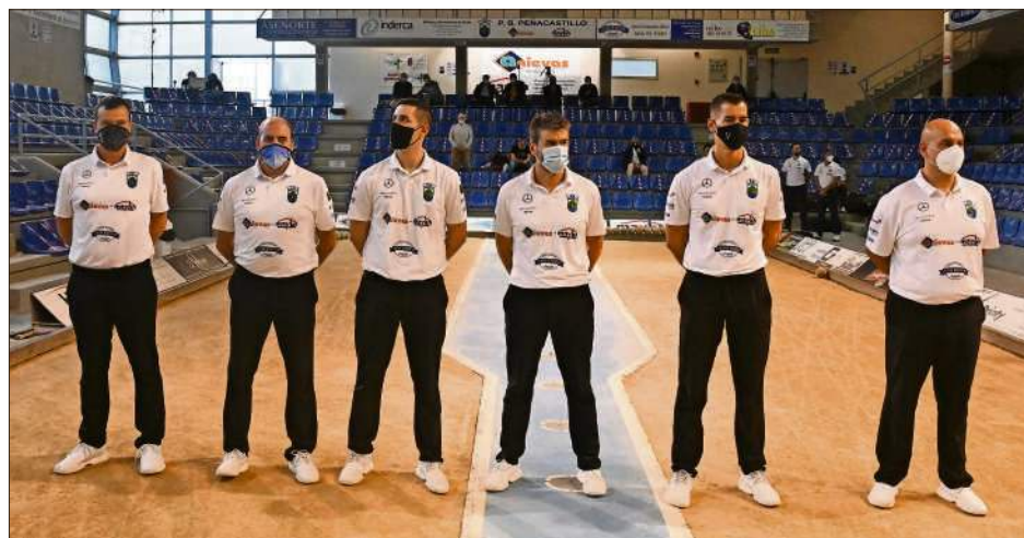
Integrantes del equipo de División de Honor.