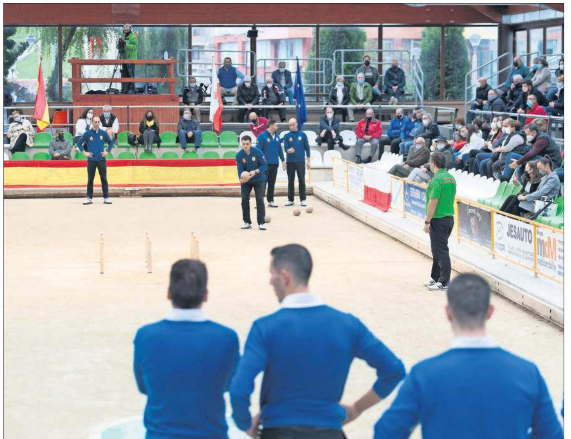
Muy buen ambiente en la bolera Jesús Vela Jareda de Renedo de Piélagos.

Marcador: 1-0 (V14 metros, raya al medio al pulgar. S10): 56-41; 1-1 (L20 metros, raya alta a la mano. A10): 30-40. Nula de José Manuel González; 2-1 (V14 metros, raya al medio al pulgar. S10): 53-47; 3-1 (L20 metros, raya alta a la mano. A10): 50-44. Emboques de Rubén Haya y Mario Ríos; 3-2 (V17 metros, raya al medio al pulgar. S10): 43-47 4-2 (L20 metros, raya alta a la mano. A10): 53-47. Emboques de Jesús Salmón, José Manuel González, Federico Díaz e Isaac Navarro. Nulas de Mario Ríos (2).