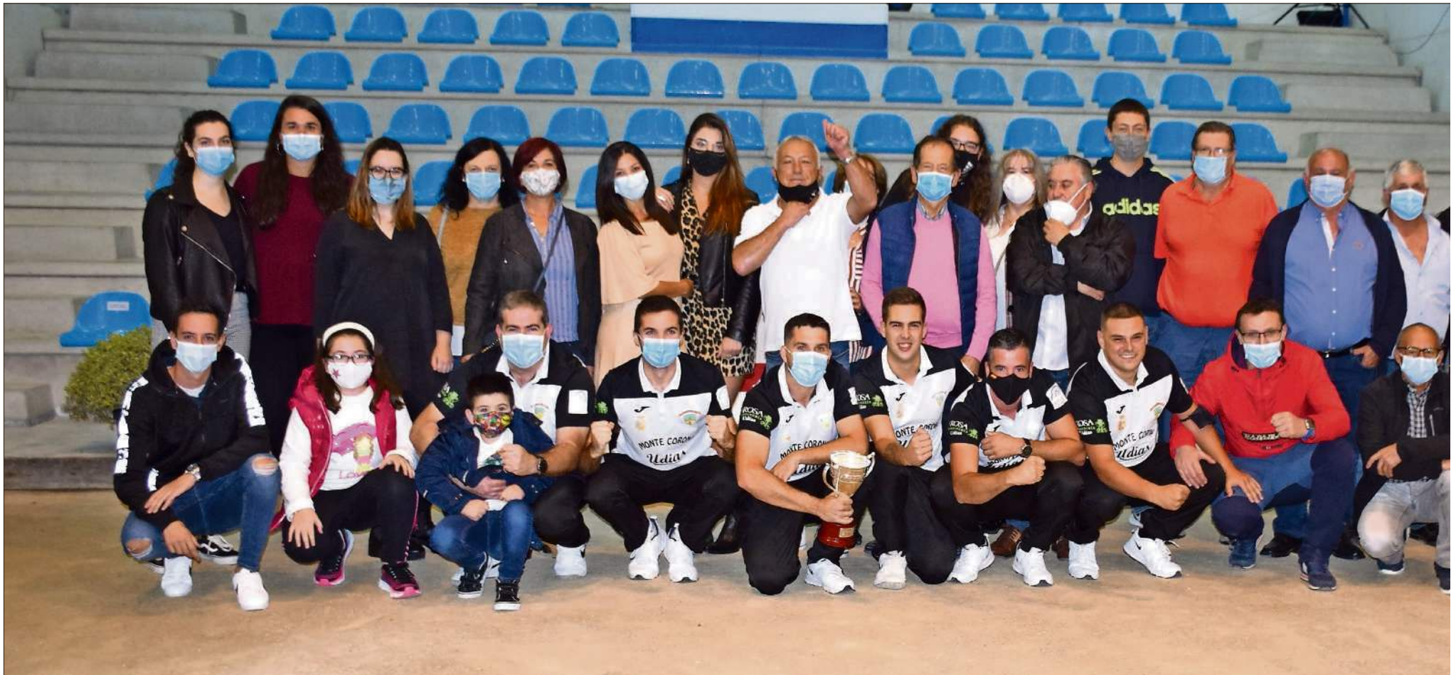
Jugadores y aficionados de la Peña Bolística Monte Corona que logró el triunfo en Cueto.