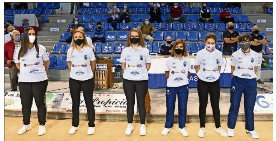
Las chicas del nuevo equipo femenino.

la disputa de la Copa Federación Española.