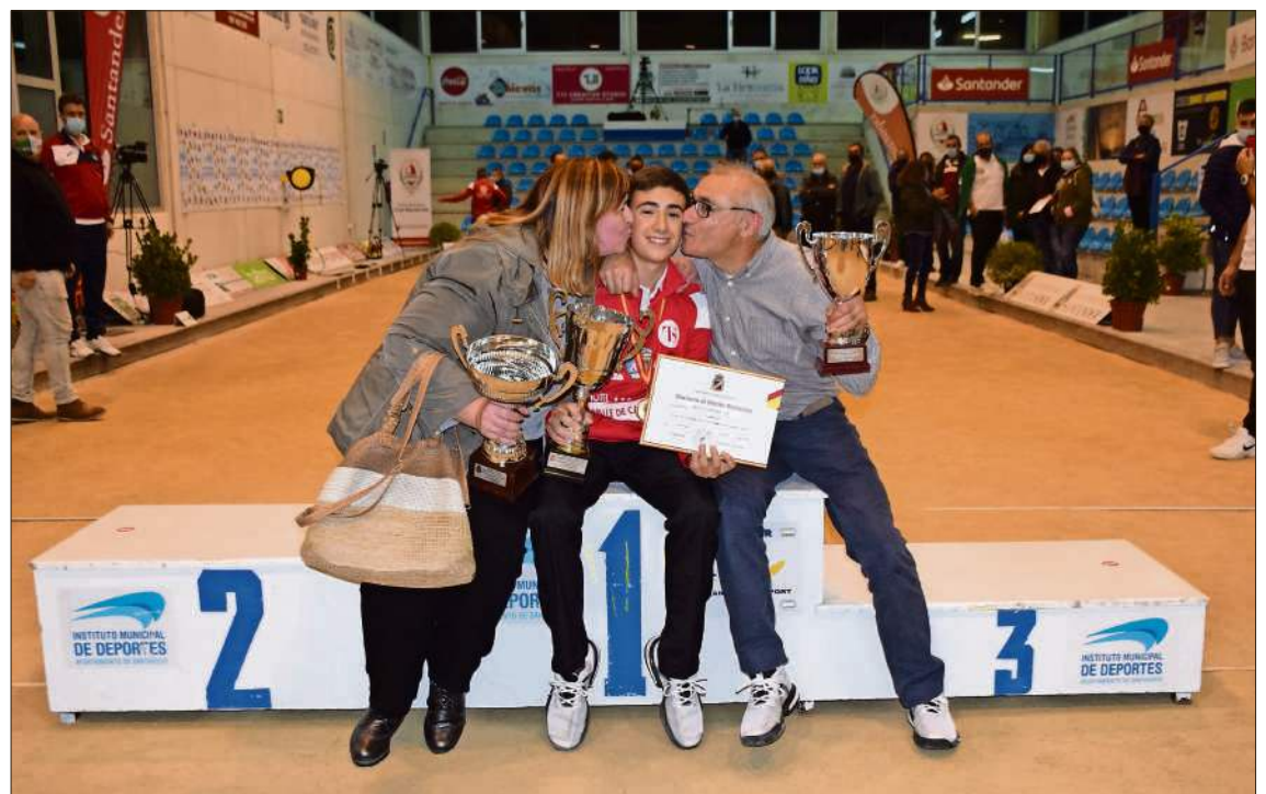
El campeón recibe la felicitación de sus padres.