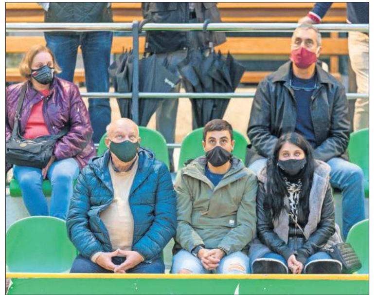
Los aficionados, atentos a la trayectoria de la bola.