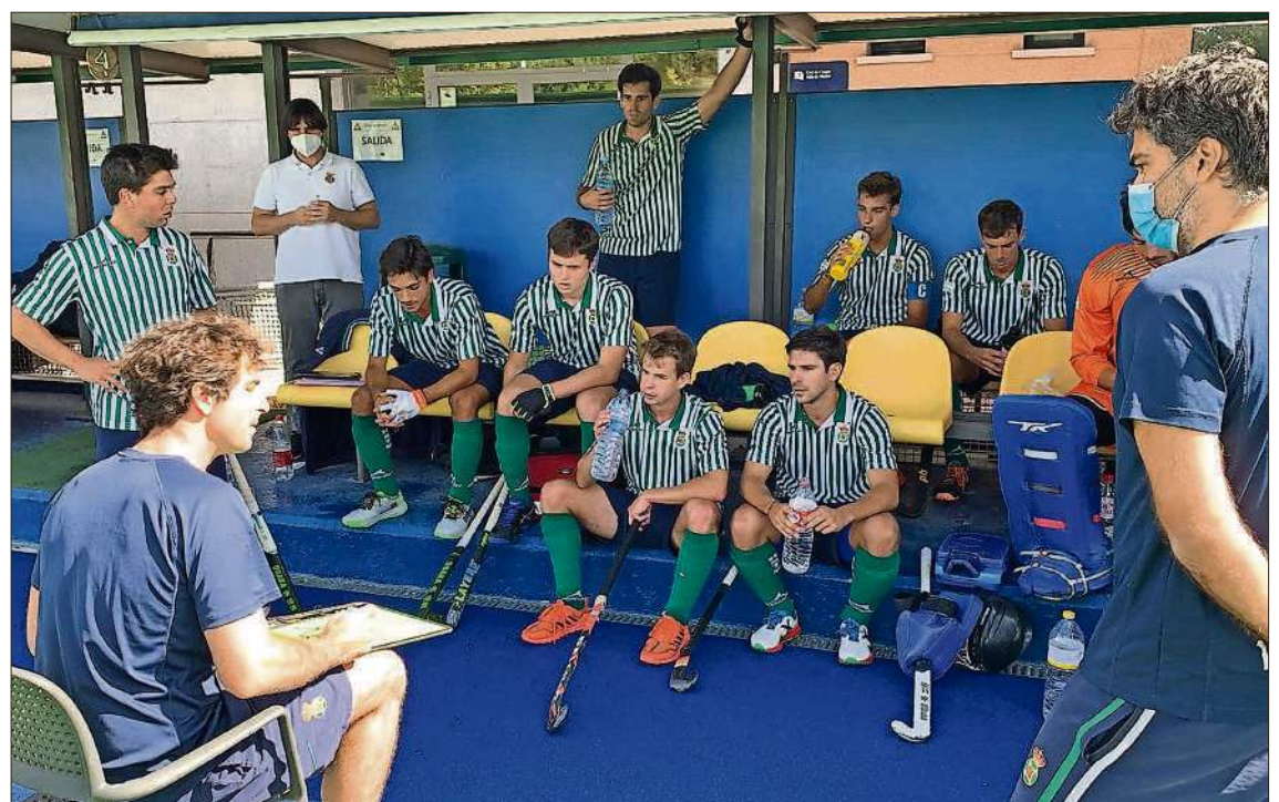
Charla en el banquillo a los jugadores del Tenis.