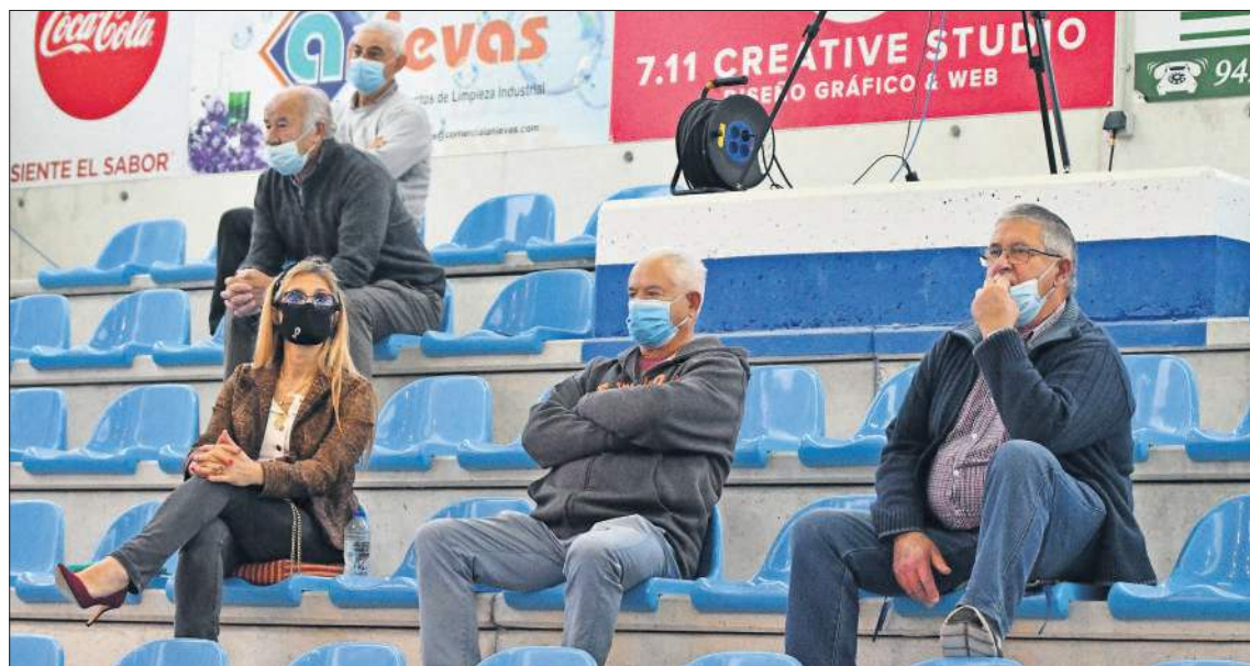
Público ayer en la bolera santanderina, siguiendo con atención el encuentro.