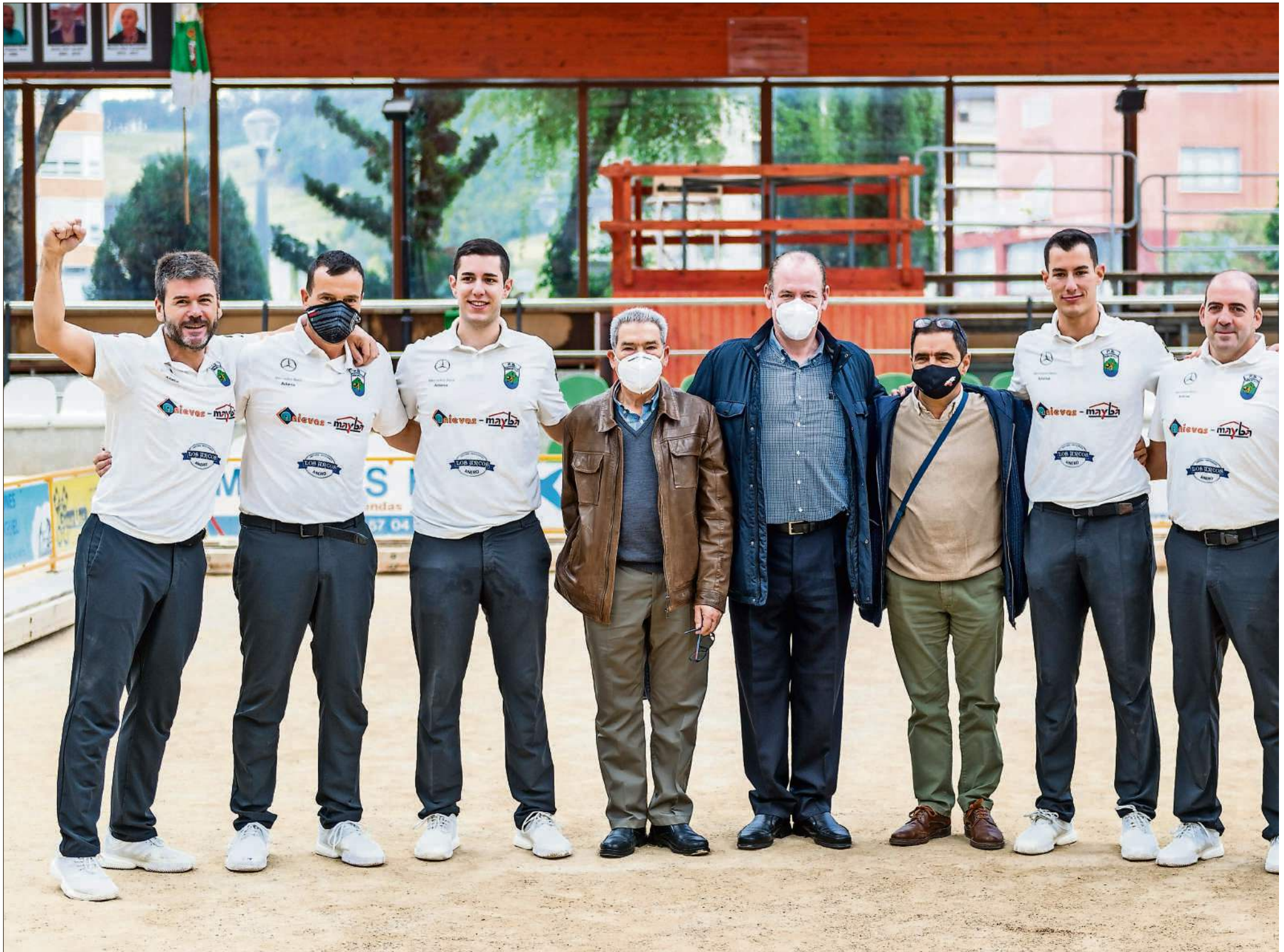
Jugadores y responsables de la Peña Peñacastillo Anievas Mayba posan tras conquistar el título de liga en Renedo.