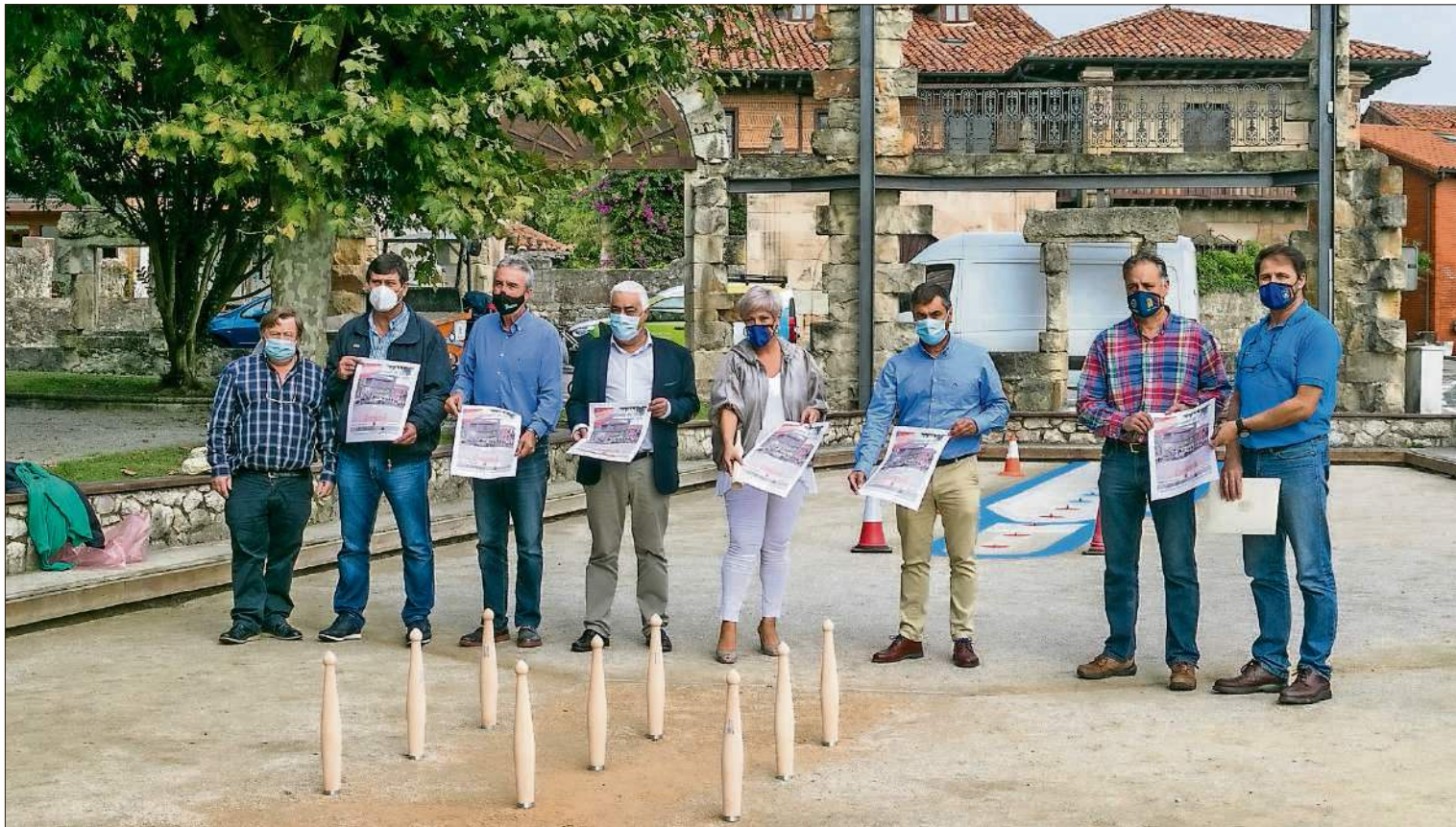
Representantes del Ayuntamiento y de las FCB y FEB en el corro de Polanco donde se disputará la final del Campeonato.