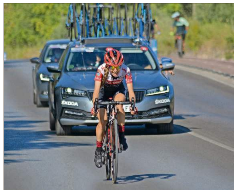
Una corredora del Meruelo en una prueba.