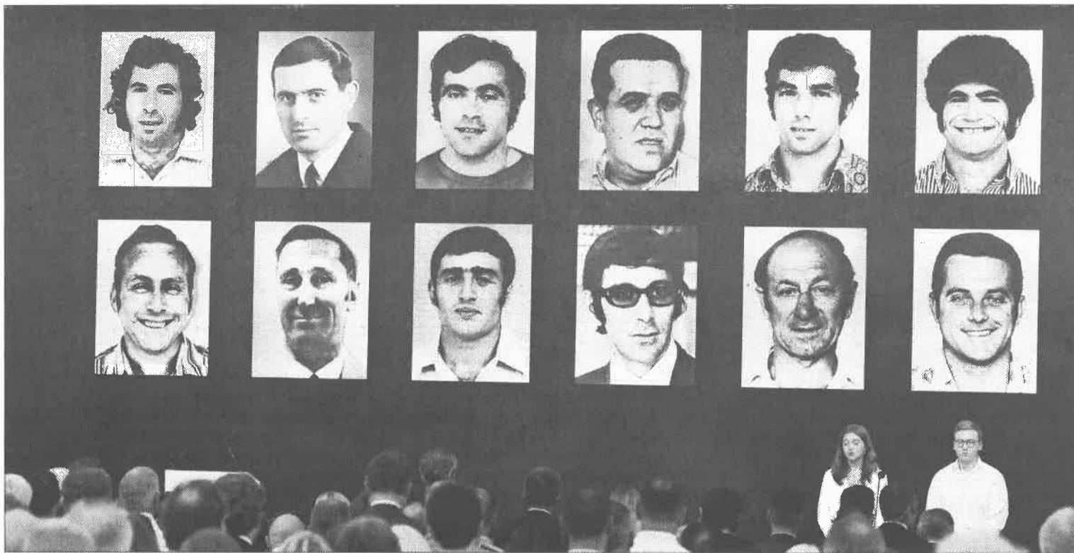
Fotografías de las víctimas del atentado terrorista en los Juegos Olímpicos de Munich 1972.