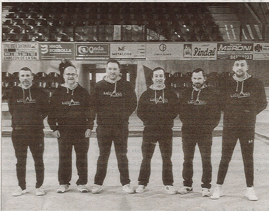
Integrantes de la peña bolística 'Liébana'.

LAS OLAS CONTINUA CON SU IMBATIBILIDAD TRAS CONSEGUIR UNA NUEVA VICTORIA, PARTIDO IGUALADO PARA SEGUIR EN LO ALTO DE LA CLASIFICACIÓN