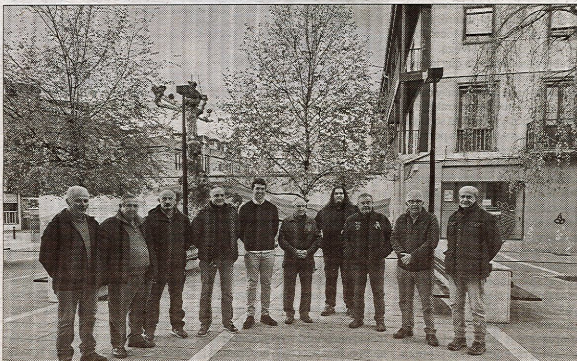
Presentación de la Liga de Invierno de Bolos de Torrelavega.

Su desempeño en la cancha ha sido consistente a lo largo de su carrera, y su experiencia en la Euroliga se remonta a la temporada 2017-18, cuando formó parte del Emporio Armani Milan, promediando 11,6 puntos, 4,7 asistencias y 11 de valoración. Según el comunicado del Saski Baskonia, la llegada de Theodore tiene como objetivo reforzar la dirección de juego del equipo y aportar su valiosa experiencia al juego exterior.