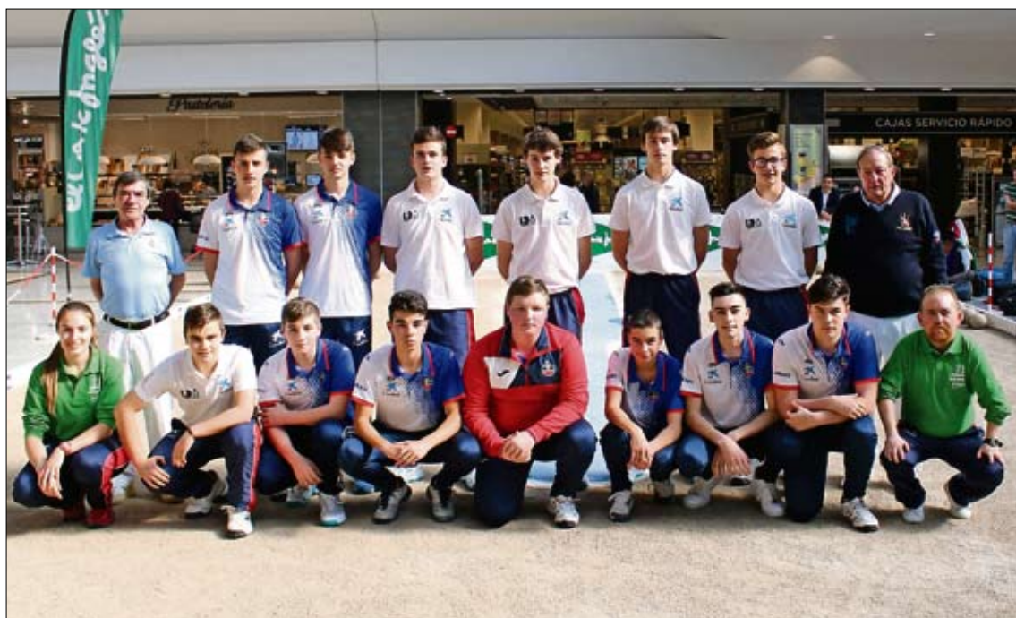
Los cadetes de las Escuelas Manuel García y Torrelavega abrieron ayer la tarde.