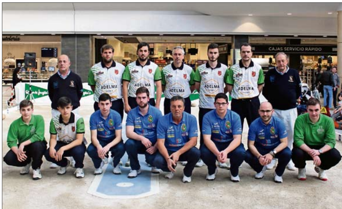
Componentes de los equipos San Roque Cemsa y Cóbreces Almacenes Lavín de Segunda Especial.

A continuación, Cóbreces Almacenes Lavín superó en 90 minutos a San Roque Cemsa Grupo Adelman, por 2-3 (72, 31/41-63, 37/26; 59,